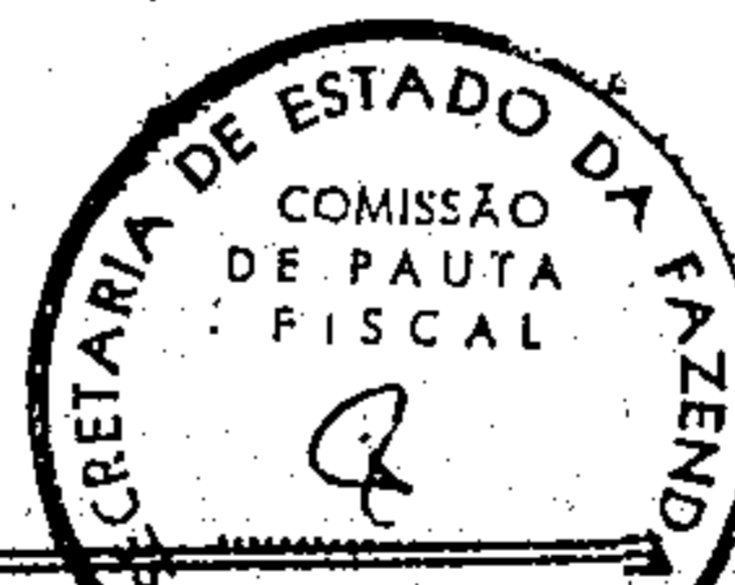
TABELA DE PAUTA FISCAL relativa a Resolução nº 11/83 - Preços a nível do produtor de generos "In-Natura" e outros, no Estado do Pará, sujeitos ao pagamento do ICM na forma prevista no Artigo 32 e seguintes do Decreto 2393 de 12/08/82, com vigência a partir de JULHO de 1983

GOVERNO DO ESTADO DO PARÁ Secretaria de Estado da Fazenda