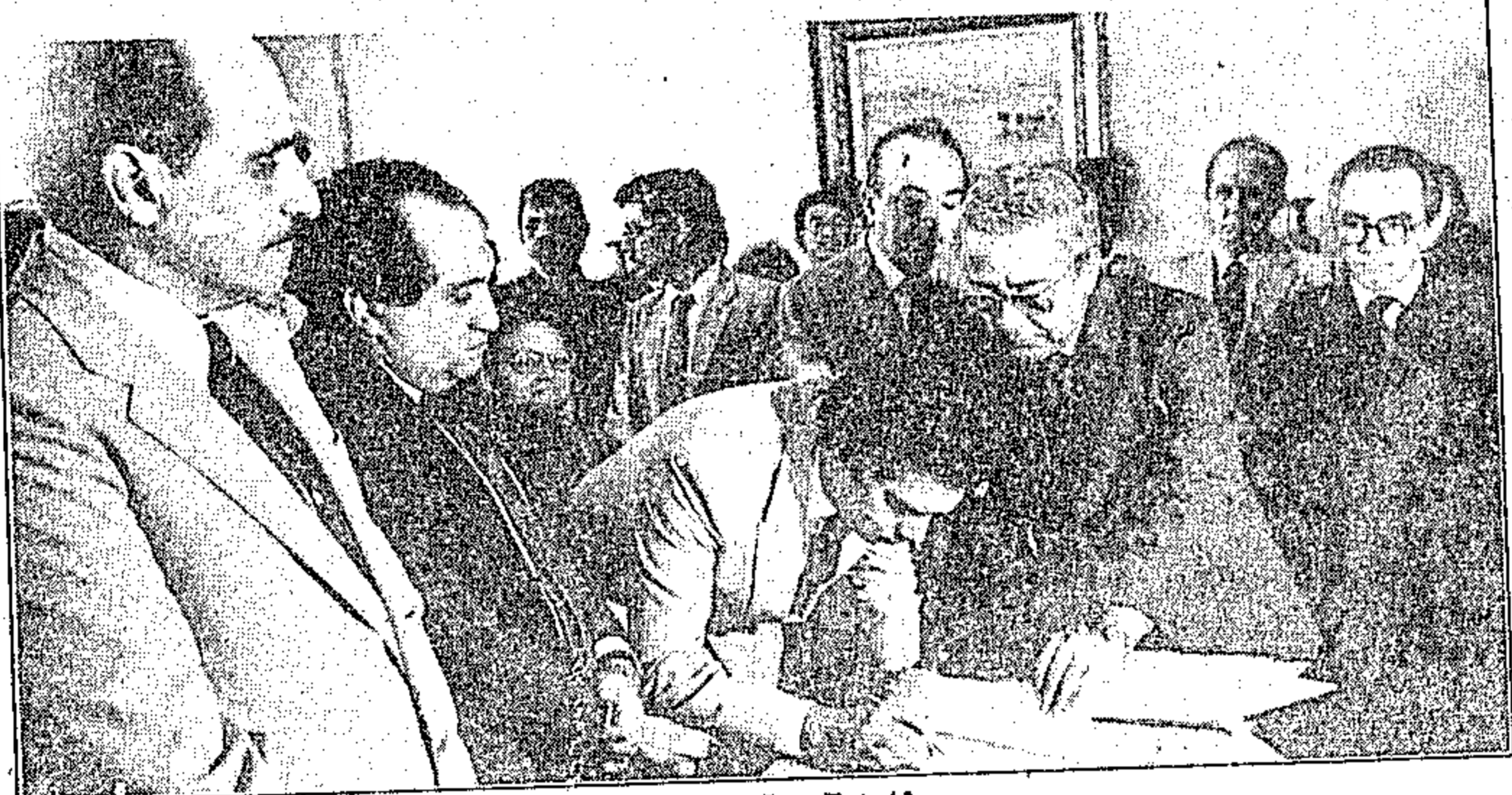
Jader assinando os atos no Palácio da Justiça

Os dois convênios foram assinados no gabinete do Secretário de Planejamento do Estado, Simão Jatene, onde o governador e outros secretários se reúnem diariamente para compor o orçamento estadual.