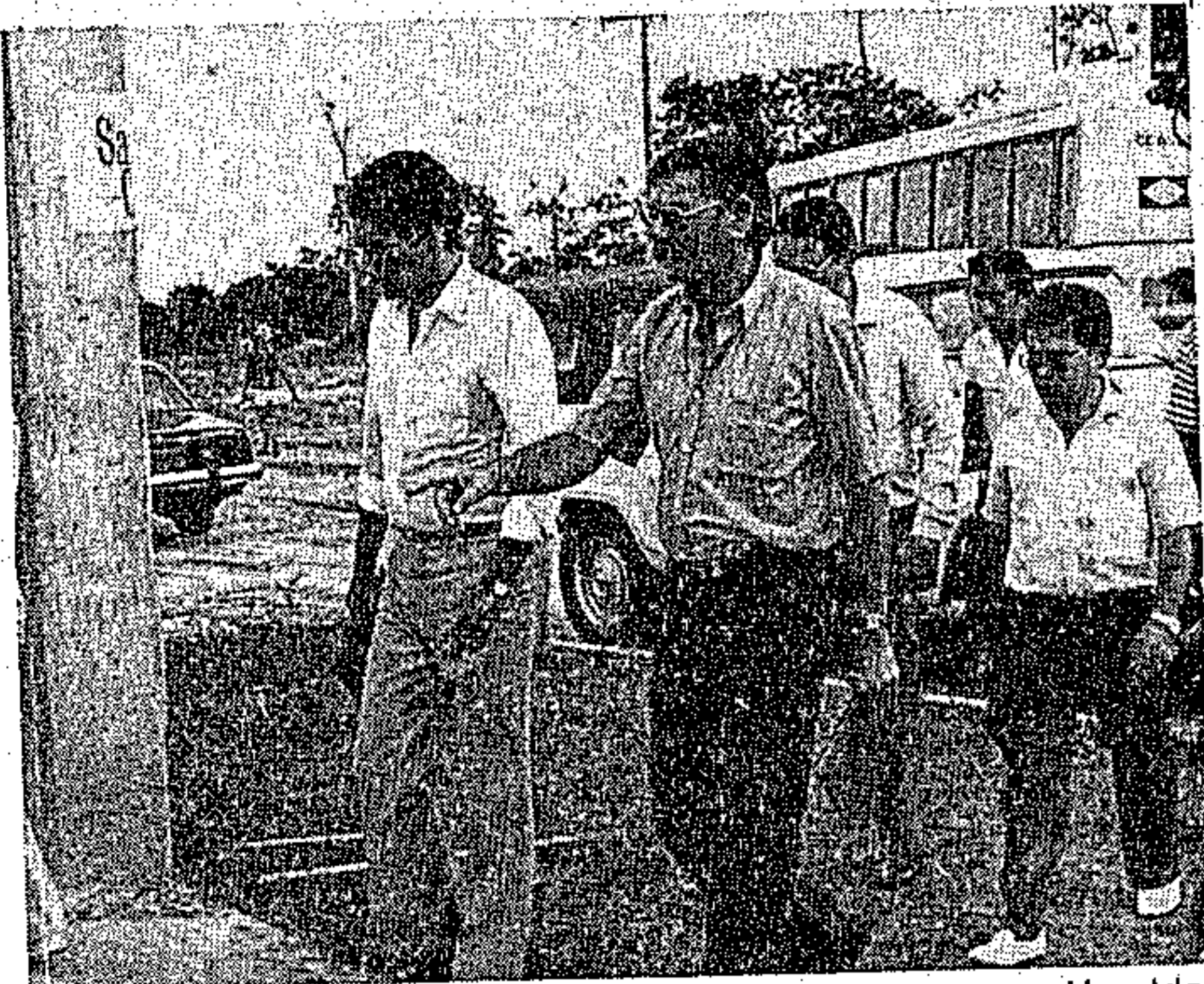
O governador Jader Barbalho e o presidente da Cosanpa, Haroldo Araújo durante a visita ao complexo do Utinga.

citou estatísticas afirmando que na década de 70 houve um crescimento populacional médio de 2,49 por cento, enquanto que o Pará cresceu 4,64 por cento, "o que significa dizer 80 por cento superior a média nacional. O reflexo deste crescimento é sentido de imediato nos serviços públicos e espe-