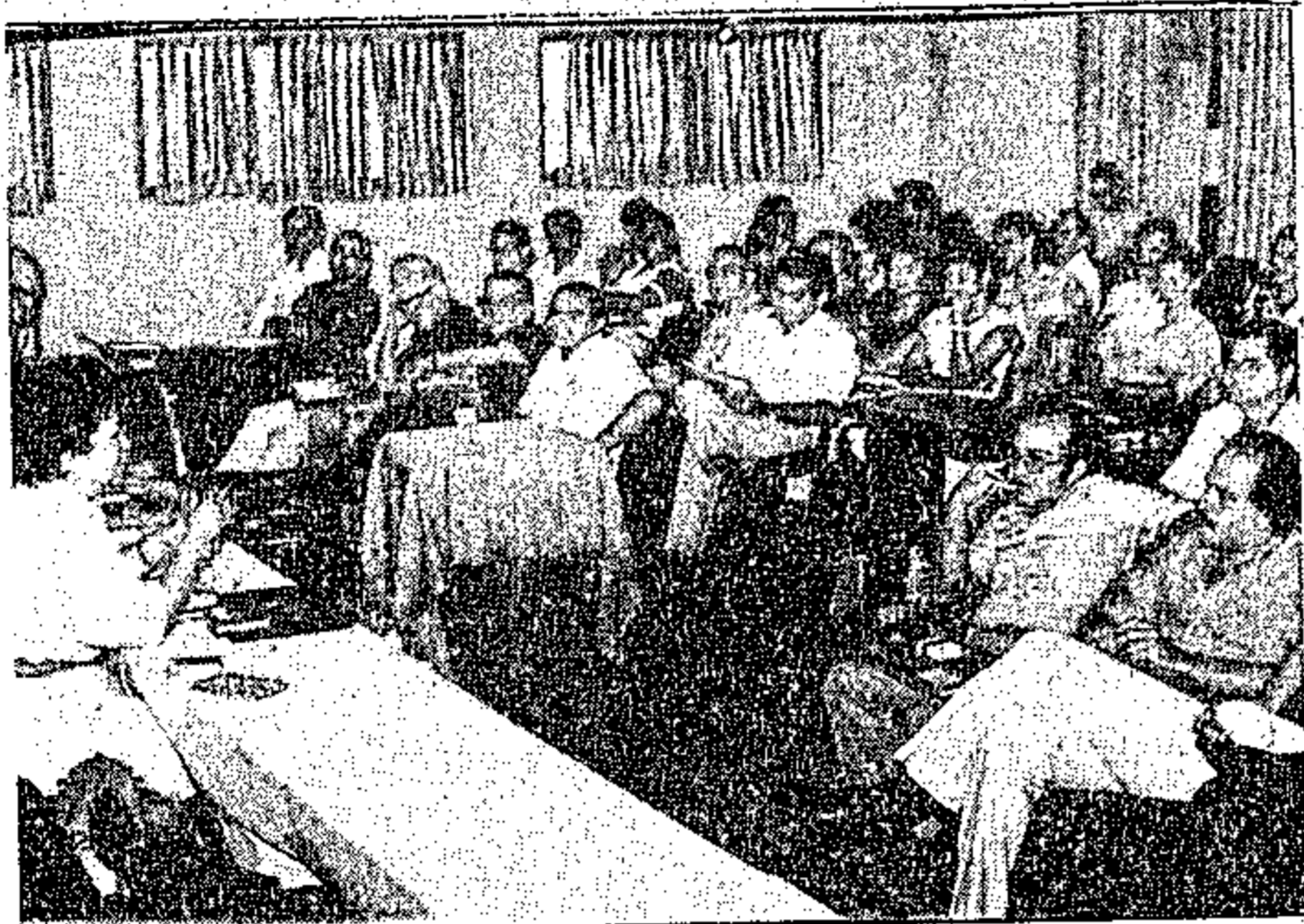
Aspecto da reunião avaliando programas de saúde pública

A abertura, na manhã do dia 22 - segunda-feira,