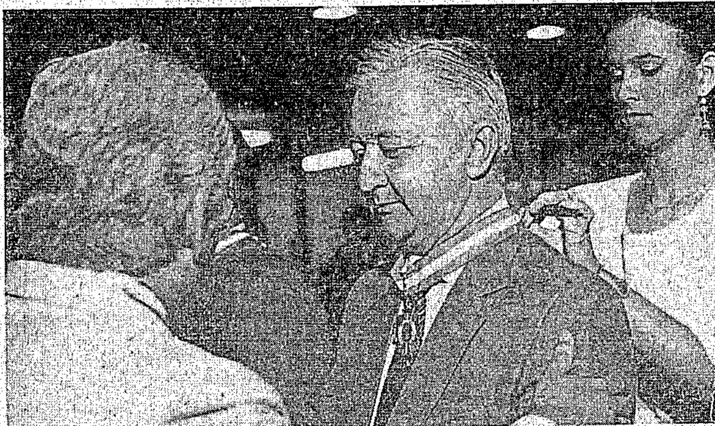
Grande Mérito para o senador Hélio Gueiros