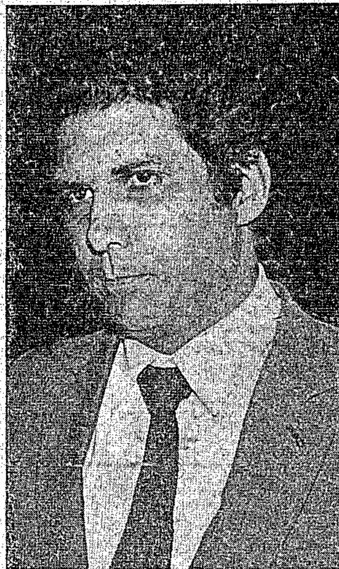
Governador Jader Barbalho: trabalho de equipe

Realizados no auditório da Faculdade de Ciências Agrárias do Pará - FCAP, os seminários foram encerrados na sexta-feira, dia 25, e cumpriram uma programação das mais concorridas, abordando os mais diferentes aspectos da administração municipal como um todo. Jornalistas sulinos e da Alemanha Ocidental, que fizeram a cobertura dos eventos, aproveitaram a presença do governador Jader Barbalho, para, numa entrevista coletiva, saberem do Chefe do Executivo Paraense, o que está sendo feito para a solução dos problemas fundiários no Estado do Pará.