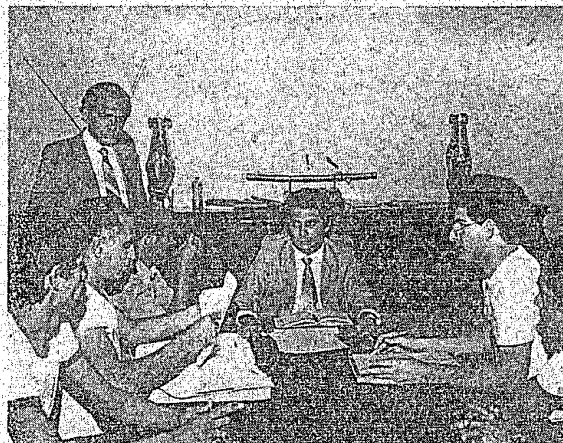
O começo: reunião de moradores com o governador