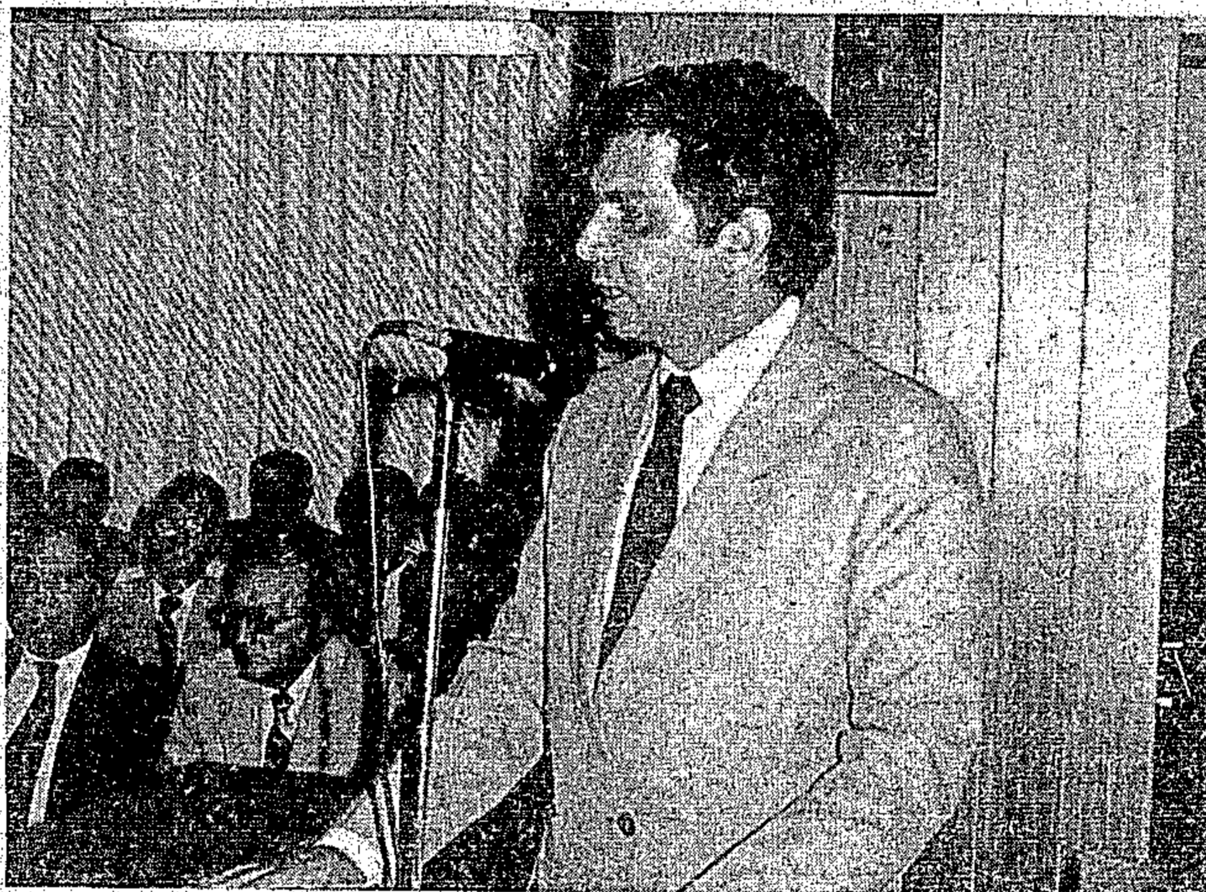
O governador abordará as realizações de sua administração

O chefe do executivo estadual, governador Jader Barbalho, traçará um perfil mostrando todos os resultados obtidos em seu desempenho no exercício de 1984, esclarecendo a aplicação dos recursos disponíveis pelo Estado nos diver-