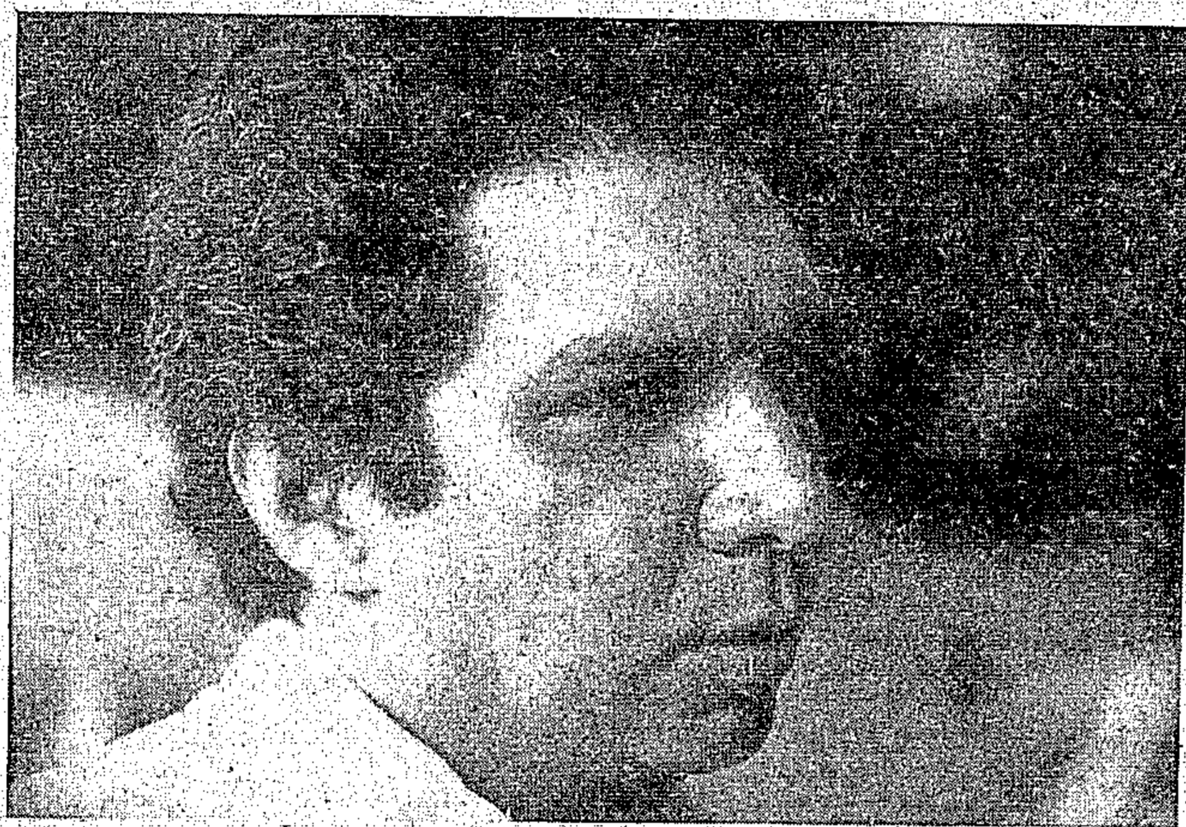
O governador Jader Barbalho, apesar de carência de recursos, vem cumprindo as metas prioritárias da administração estadual.

Os recursos disponíveis pelo Governo do Estado para realização de um programa de trabalho no exercício de 1984, foram da ordem