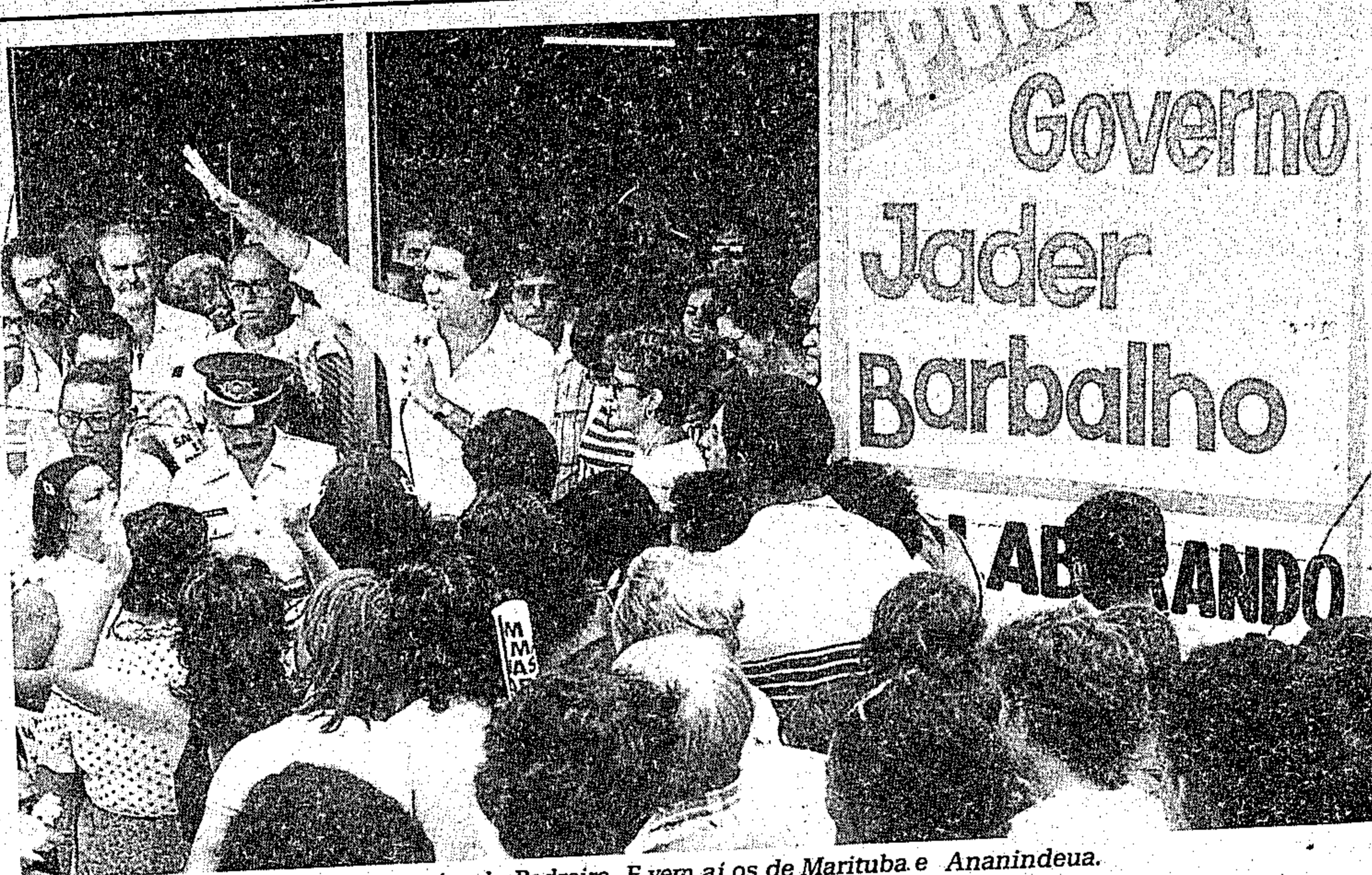
O próximo Sacolão das Carnes será o da Pedreira. E vem aí os de Marituba e Ananindeua.