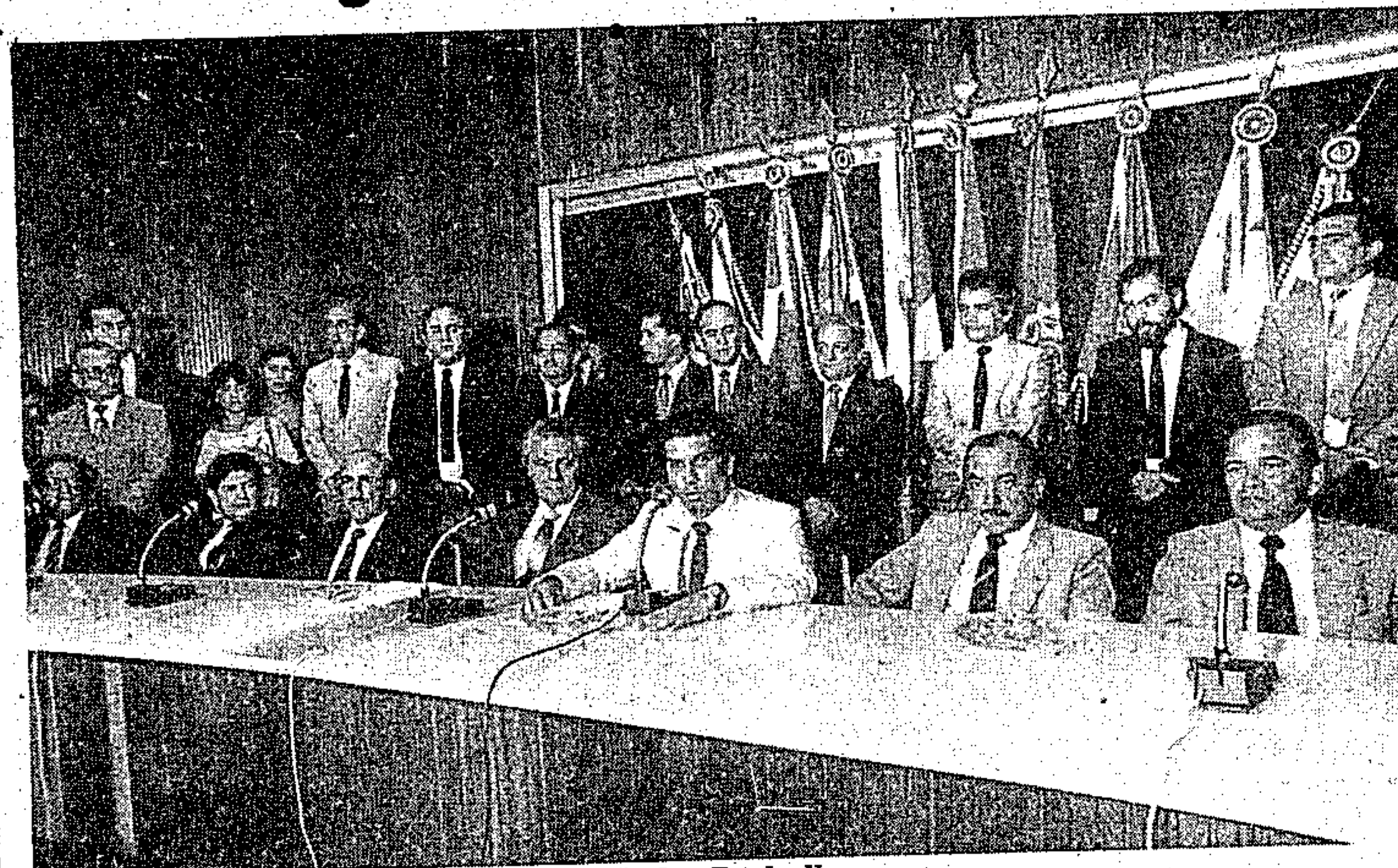
A mesa presidida pelo governador Jader Barbalho

O pronunciamento do novo superintendente foi todo dirigido em prol da mudança de uma