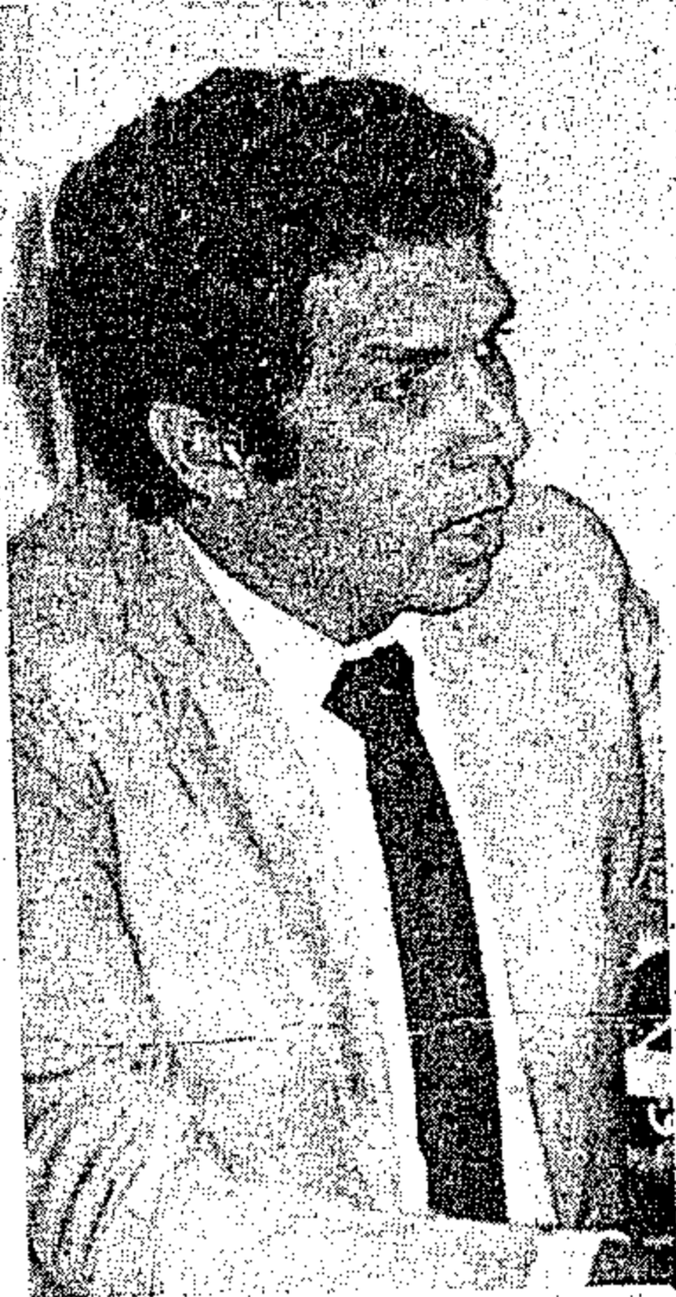
Governador Jader Barbalho

ria de Saúde foi composta de médicos, enfermeiros e pessoal de apoio. Levaram grande quantidade de remédios para socorrer aos enfermos, uma vez que é grande a incidência de doenças na área, principalmente malária que já acometeu milhares de crianças e adultos até agora e ameaça se alastrar ainda mais entre as famílias de garimpeiros.