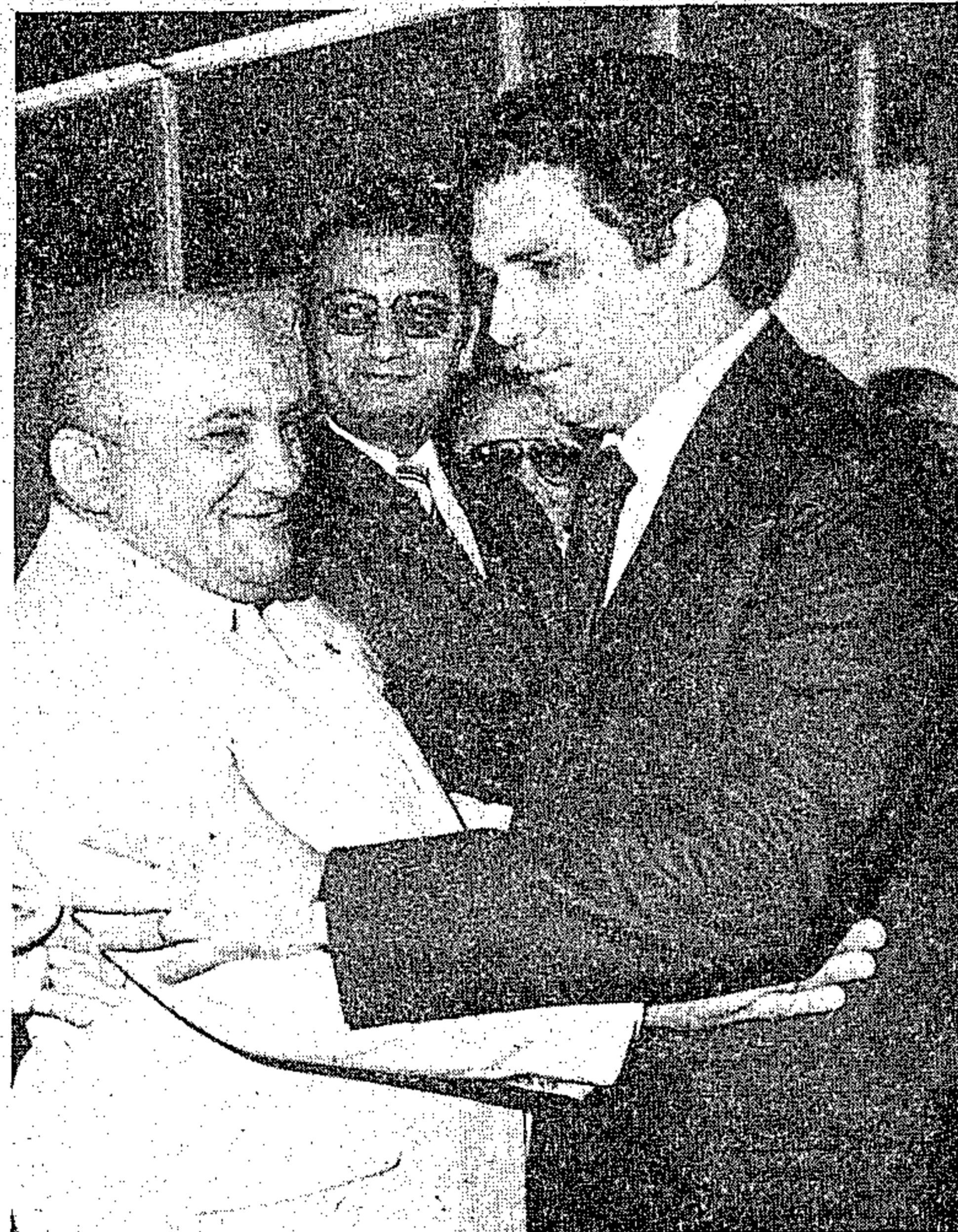
Acyr Castro e o governador Jader Barbalho: um trabalho afinado em benefício do Estado.

Além de Acyr Castro, estão representando o Estado do Pará no II Congresso Brasileiro de Escritores, os escritores De Campos Ribeiro, Rafael Costa, Paes Loureiro, Benedicto Mon-