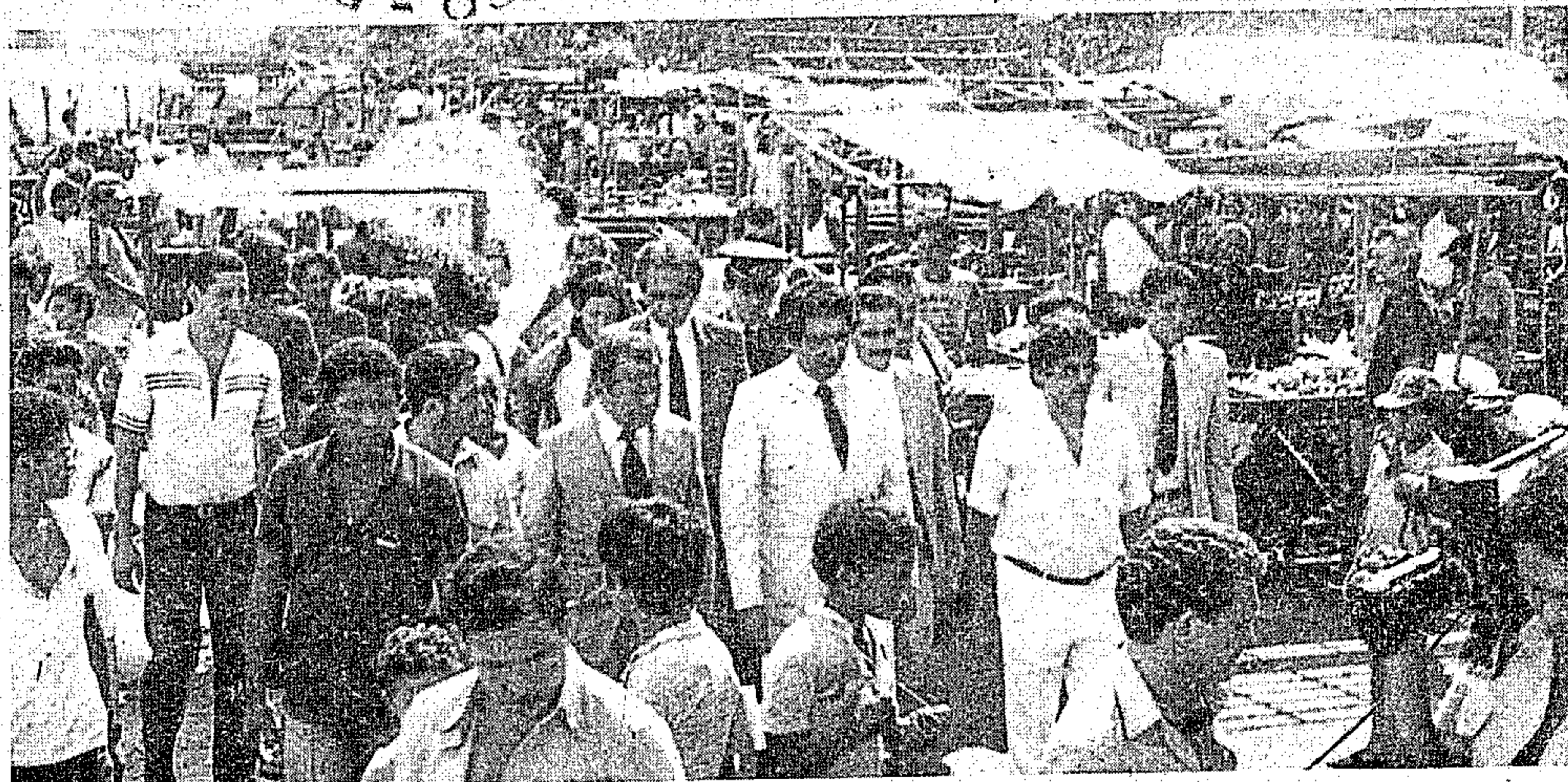
Jader viu as obras e garantiu os recursos necessários para a conclusão dos trabalhos

No Ver-O-Peso, a PMB efetuou o cadastramento dos feirantes que trabalhavam em maio de 84. Quem chegou primeiro, ficará.