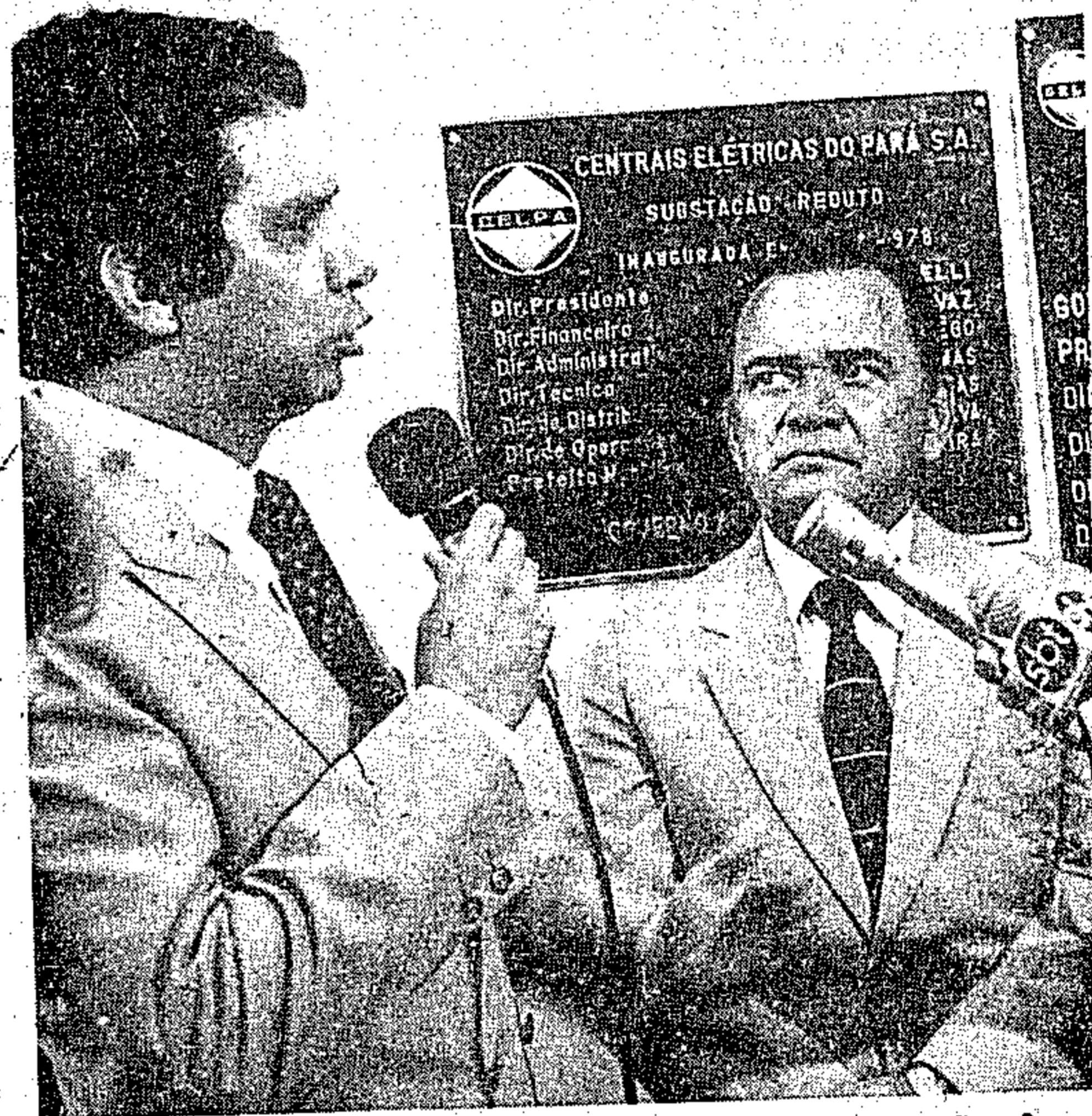
O governador determinou à Celpa a conclusão dos trabalhos na Rodovia Augusto Montenegro

Os estacionamentos do Mangueirão, que também sofrem a ação de ladrões, que levaram os fios, condutores e ficaram às escuras, também poderão ser beneficiados, voltando a ter iluminação, o que atualmente não ocorre e toda a área atualmente não conta com a iluminação desejada.