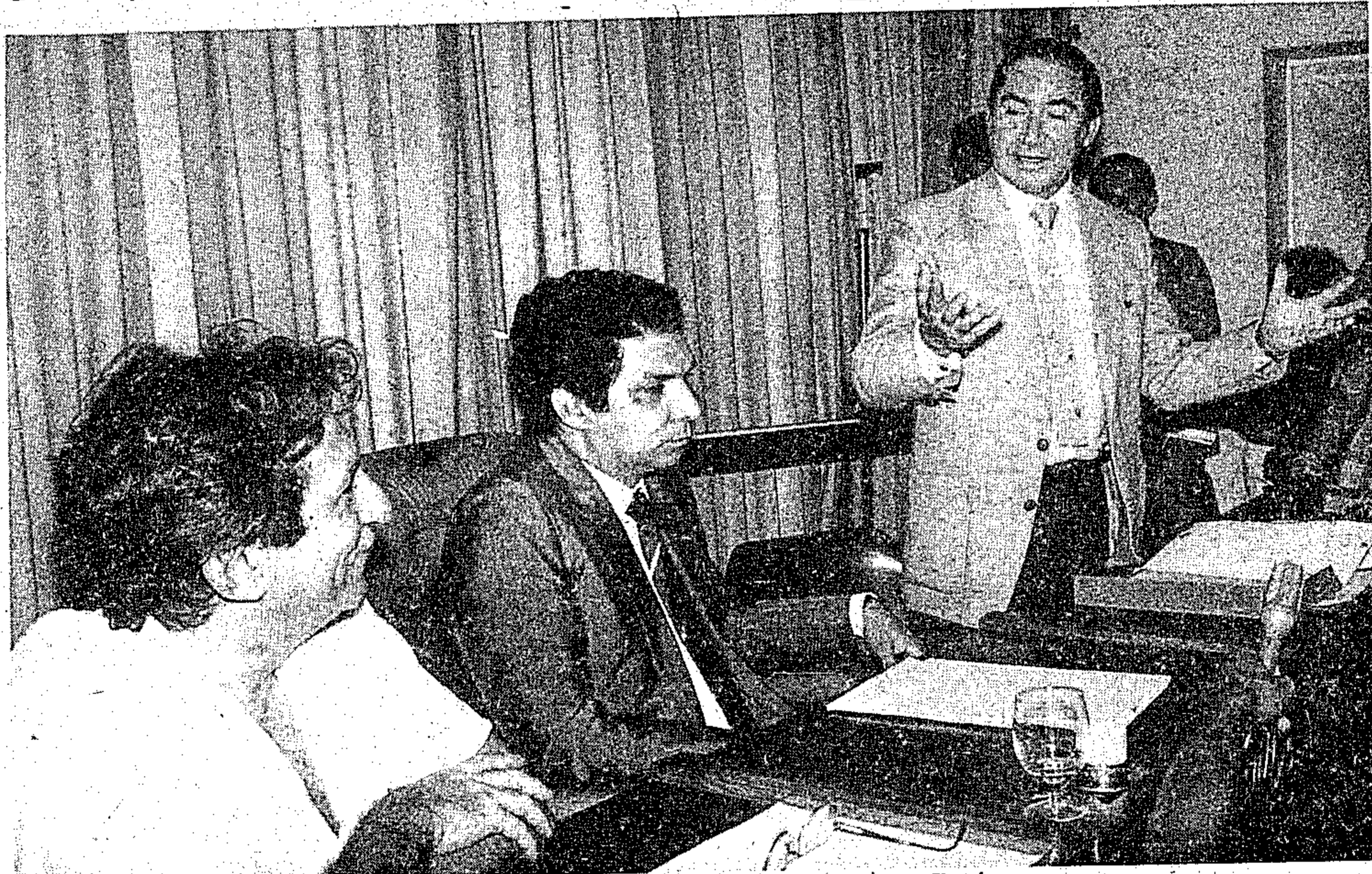
O secretário de Saúde explica ao governador o funcionamento do Centro

Jader enfatizou ainda que nos tempos da Nova República, haverá disposição das autoridades em apoiar e financiar o trabalho da zona rural, principalmente o pequeno agricultor, responsável por grande parte da cultura de subsis-