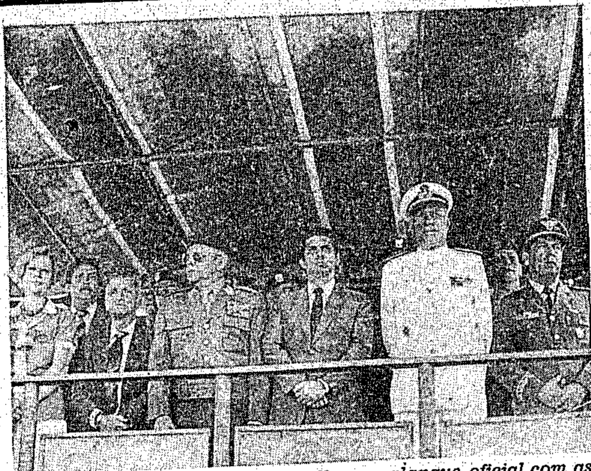
O governador Jader Barbalho no palanque oficial com as autoridades civis e militares.