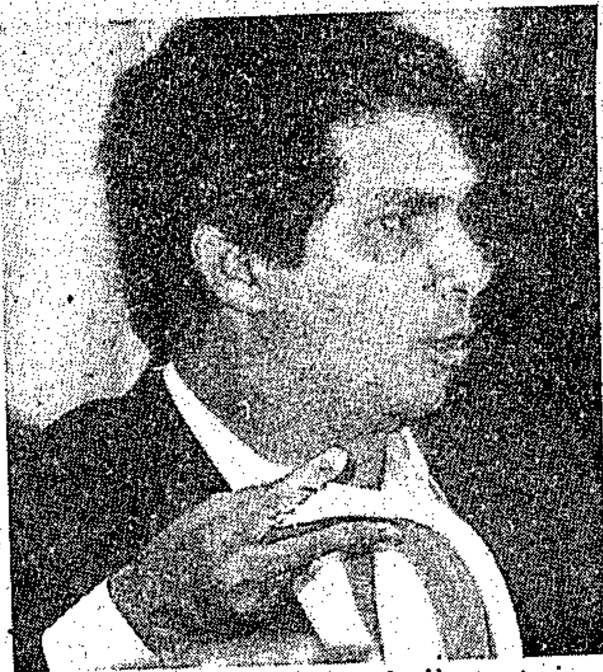
Governador Jader Barbalho: apoio à área de saúde

Acrescenta o secretário que durante o ano de 84, a Secretaria de Saúde desenvolveu o Programa de Interiorização das Ações de Saúde e Saneamento, conhecido como PLASS dando melhorias às condições de saúde da população; o Programa de Controle de Doenças Transmissíveis e a cooperação com a Central de Medicamentos através de estudos e insumos, recebendo apoio técnico financeiro dos Ministérios da Saúde e Previdência e Assistência Social. A nível internacional, informa o secretário que a rede de serviços básicos da Sespa atuou como campo de observação do Programa de Controle das Infecções Respiratórias Agudas, desenvolvido pioneiramente pelo Estado do Pará, além de pesquisas no Tratamento Encurtado da Hanseníase