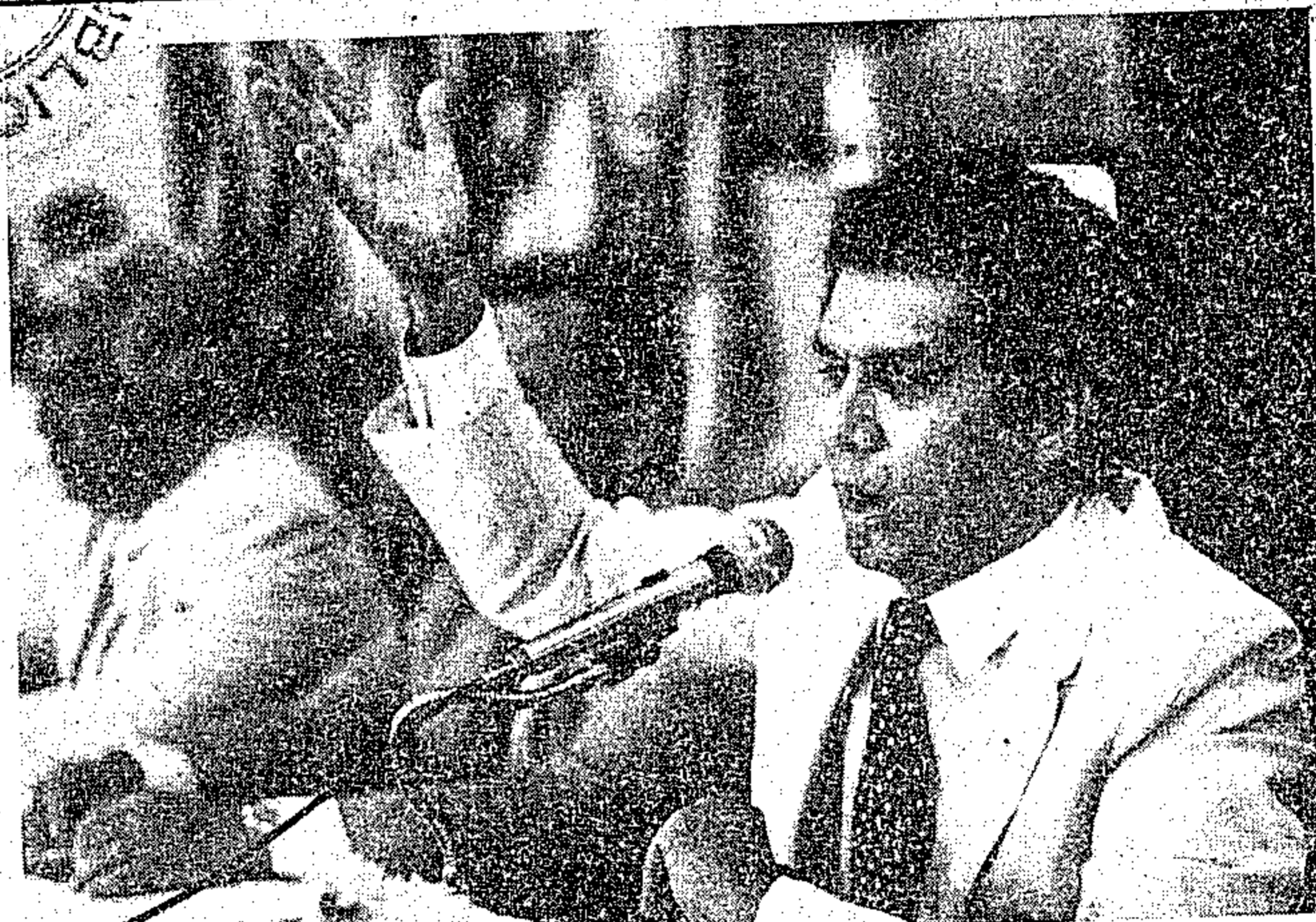
Jader quer o fim do convênio assinado em 1980

Várias reuniões estão acontecendo para que o evento transcorra conforme o estabelecido e a juventude rural de nosso Estado tenha uma oportunidade única de manter um salutar intercâmbio. O presidente da Emater-Pará solicita o desempenho de todos para que a Convenção alcance as metas definidas.