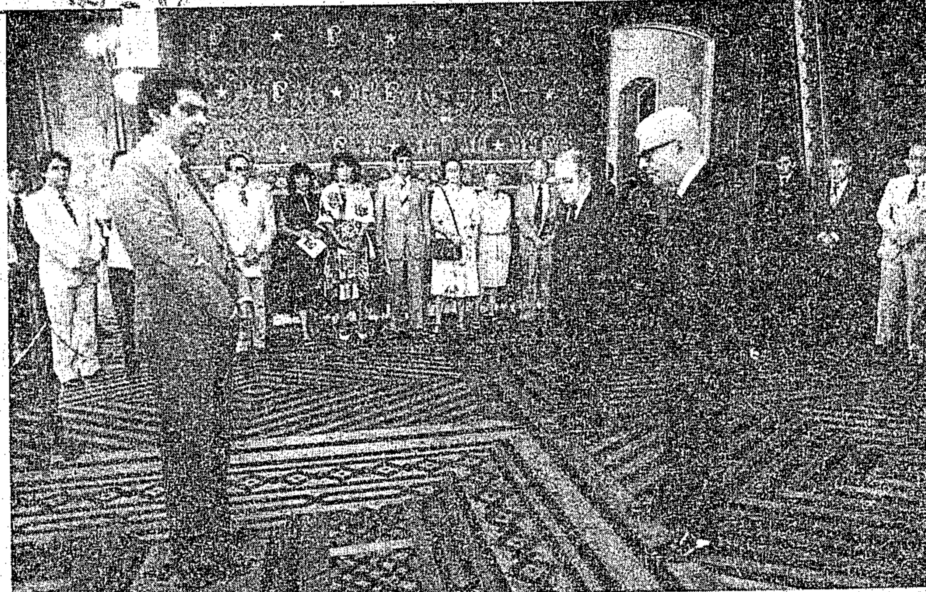
No grau comendador, o governador Jader Barbalho procedeu as homenagens em Palácio

Depois do governador, os militares cumprem uma longa pauta de visitas às autoridades locais.