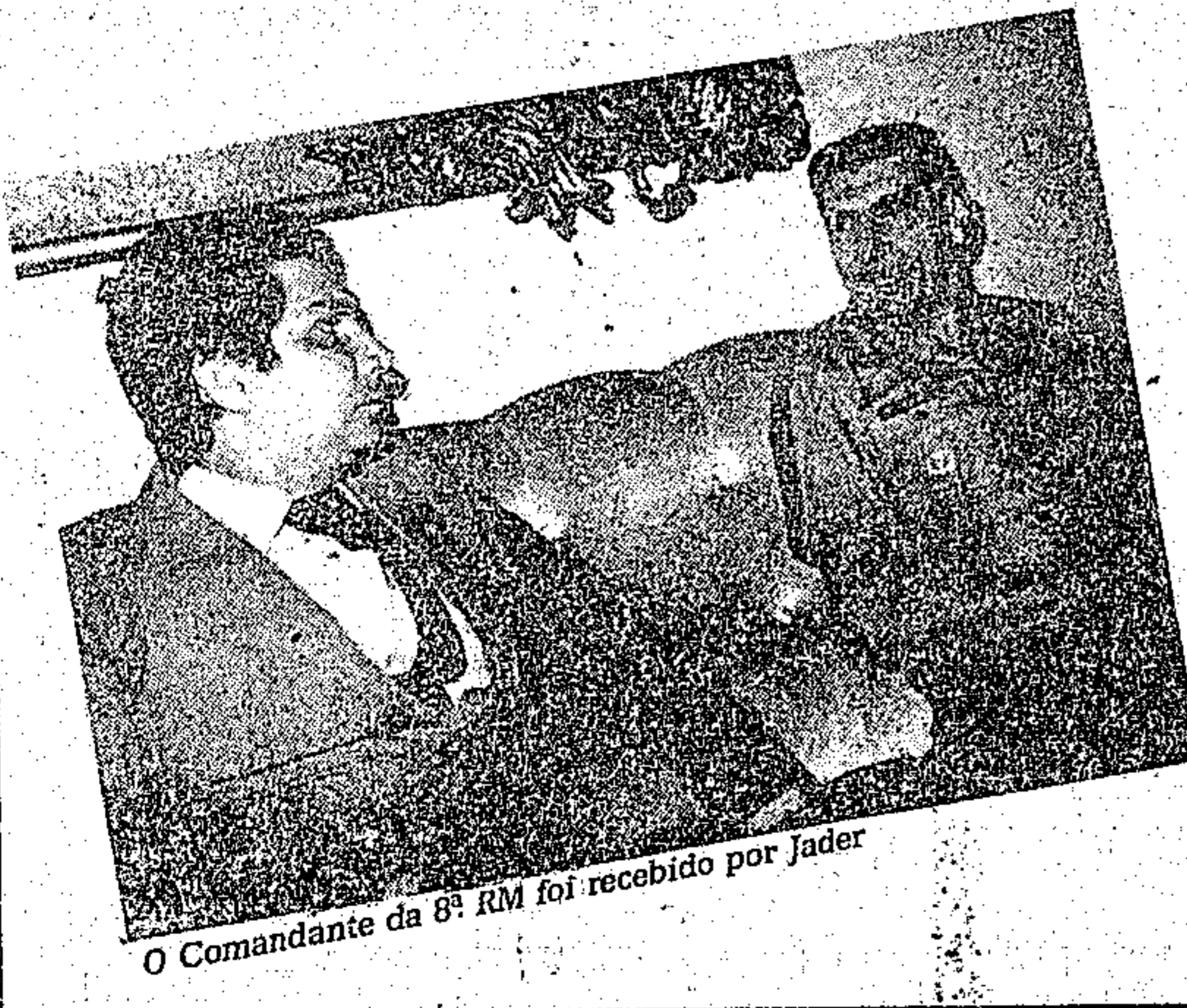
O Comandante da 8ª RM foi recebido por Jader