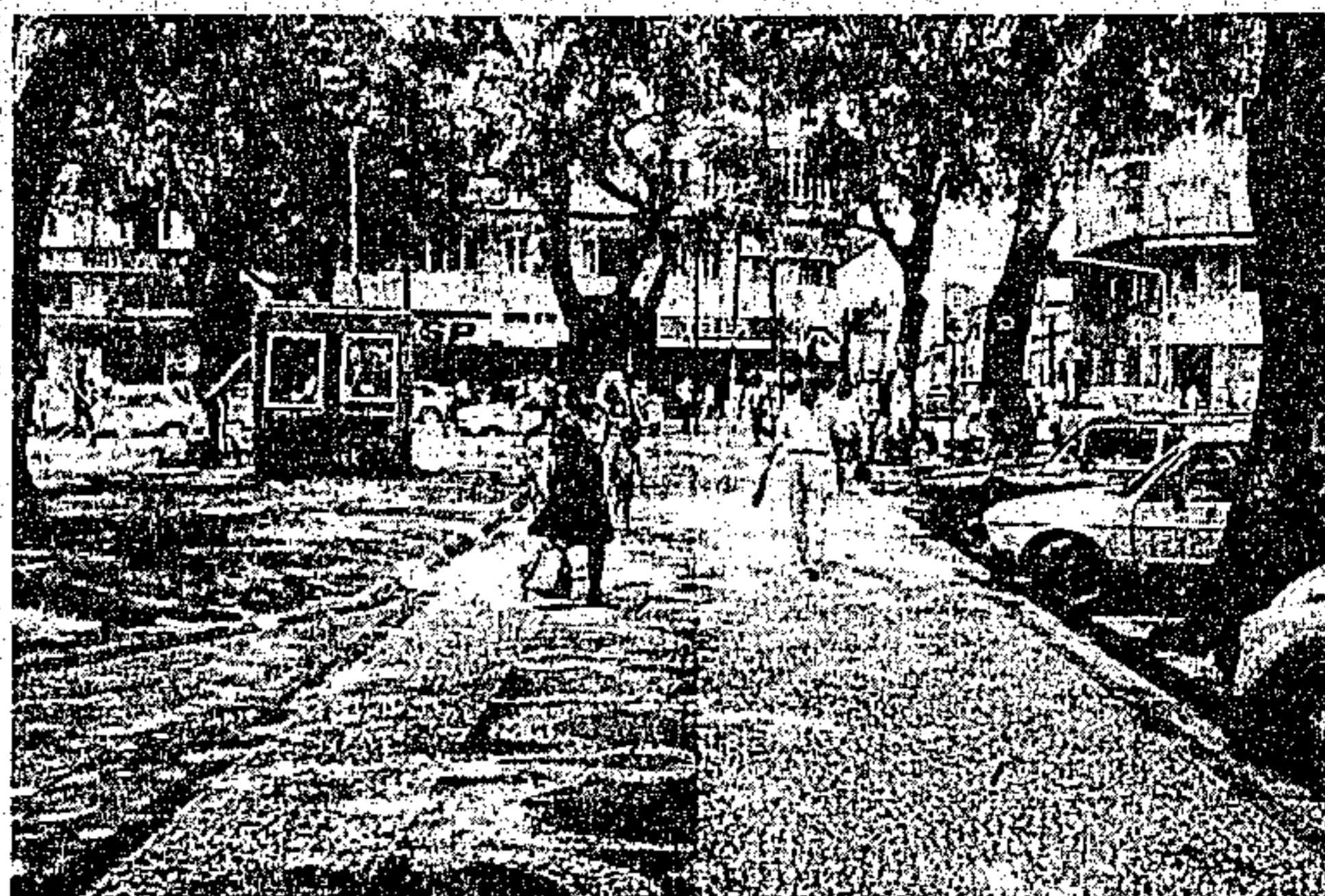
A nova Praça da República custou mais de 1 bilhão

Nos dois locais haverá partes destinadas à venda de carne, peixe, caranguejo, farinha, frutihortigranjeiro, além de lojas de miudezas na área interna do mercado. Também haverá depósito para frutas, legumes e verduras.