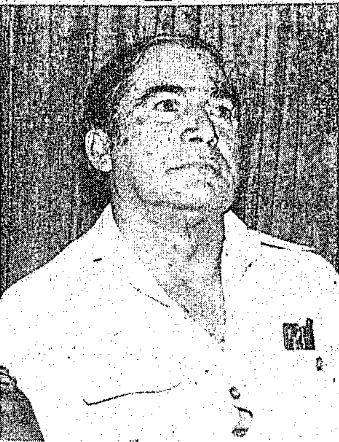
Médico Luiz Carneiro, titular da Secretaria de Estado de Saúde Pública

De acordo com o secretário de Estado de Saúde Pública, Luiz Carneiro, o controle da infecção hospitalar está relacionado intimamente com a finalidade de serviços prestados nos hospitais, clínicas e outros estabelecimentos envolvidos na eficácia médica e de enfermagem por terem todo instrumental na rotina da unidade. Assinalou que o controle da infecção hospitalar está por outro lado situado dentro do capítulo legal do controle dos registros das profissões e ocupações técnicas e auxiliares relacionadas com a saúde. Diante disso, os hospitais e clínicas com elevado índice de infecção estão sujeitos a sanções previstas no Decreto Lei número 7708 de janeiro de 1976, que prevêem até o fechamento do estabelecimento.