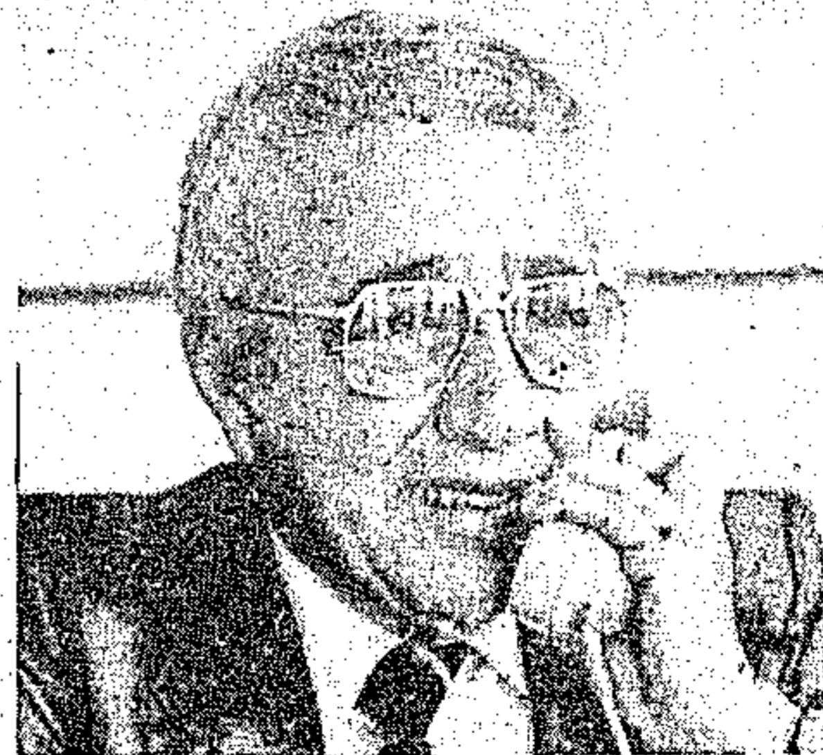
Itair Sá da Silva, secretário de Justiça do Estado

te este sistema em Belo Horizonte, mas já está sendo implantado também em Porto Alegre e São Paulo.