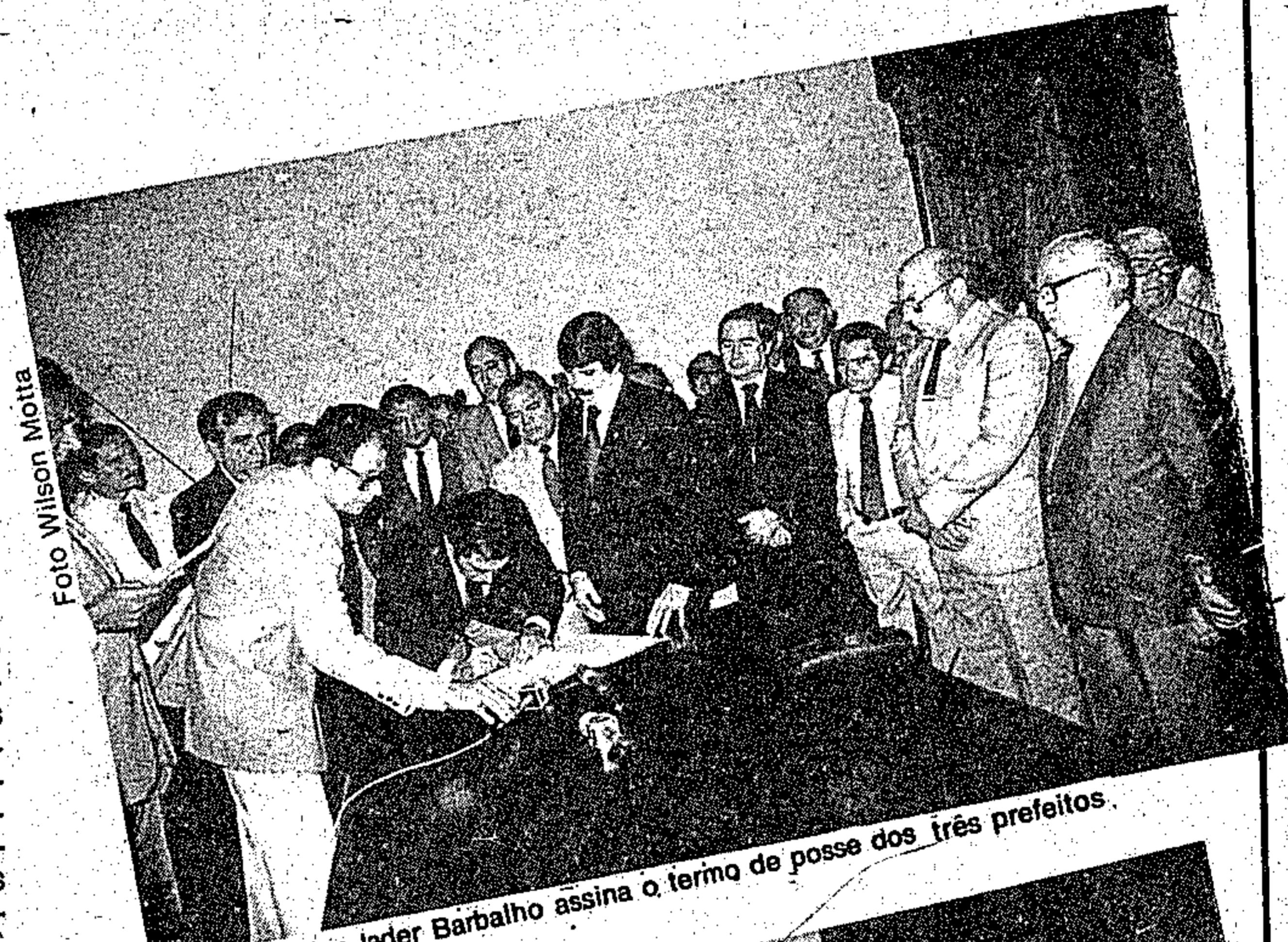
O Governador Jader Barbalho assina o termo de posse dos três prefeitos.

Ao final o governador incentivou os três novos prefeitos que trabalhassem pela restauração da federação e cumprissem seus deveres com a comunidade que passavam a dirigir.