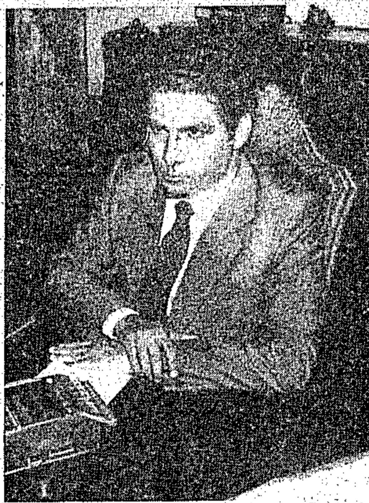
Governador Jader Barbalho: apoio à produção de algodão no Estado

A produção de algodão no Estado vem de sofrer um declínio, após ter registrado um acentuado crescimento. Segundo levantamentos, em 1980 a Sagri registrou 1.500 produtores; em 1981 o número de produtores envolvidos com o