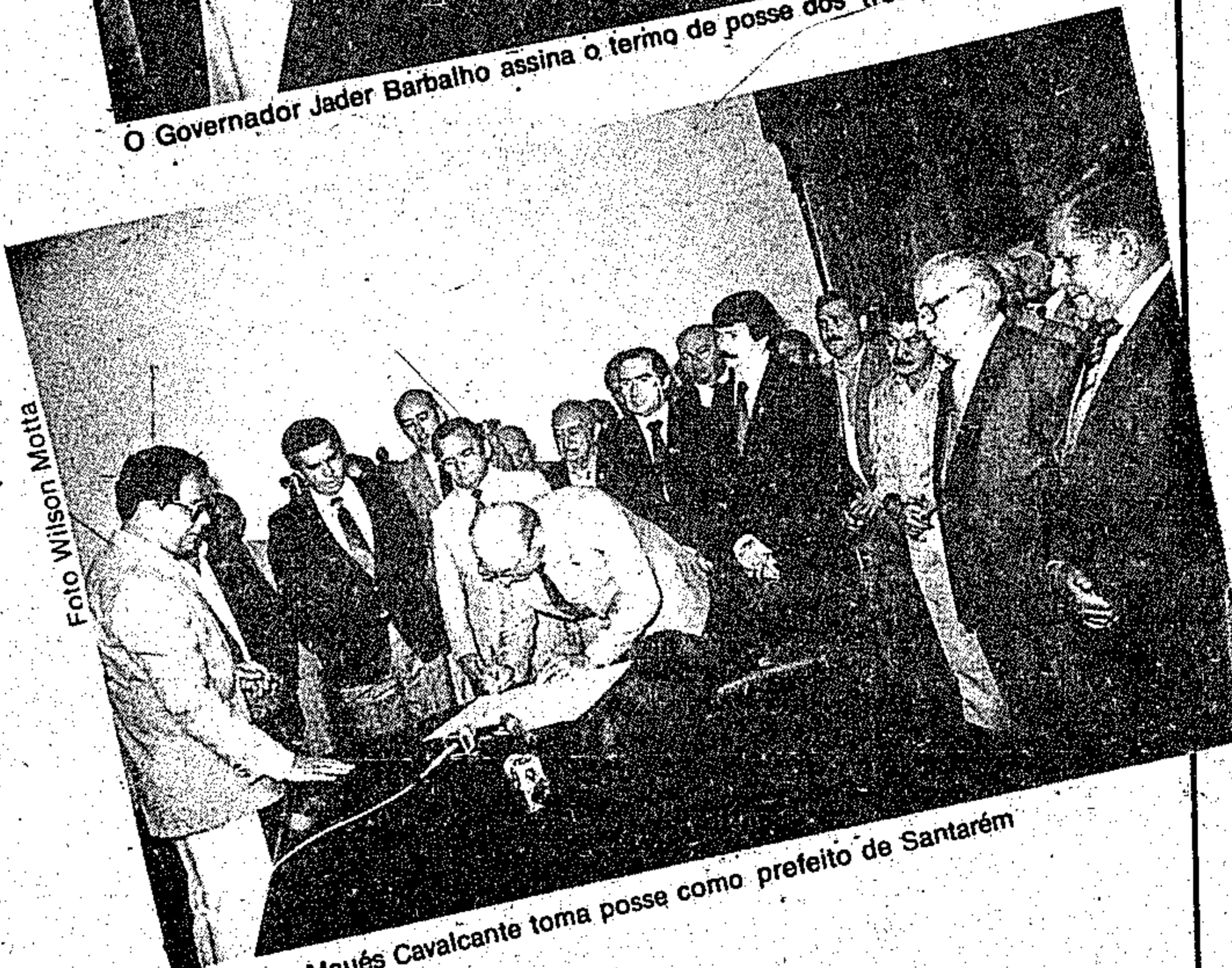
Adelerme Maués Cavalcante toma posse como prefeito de Santarém.