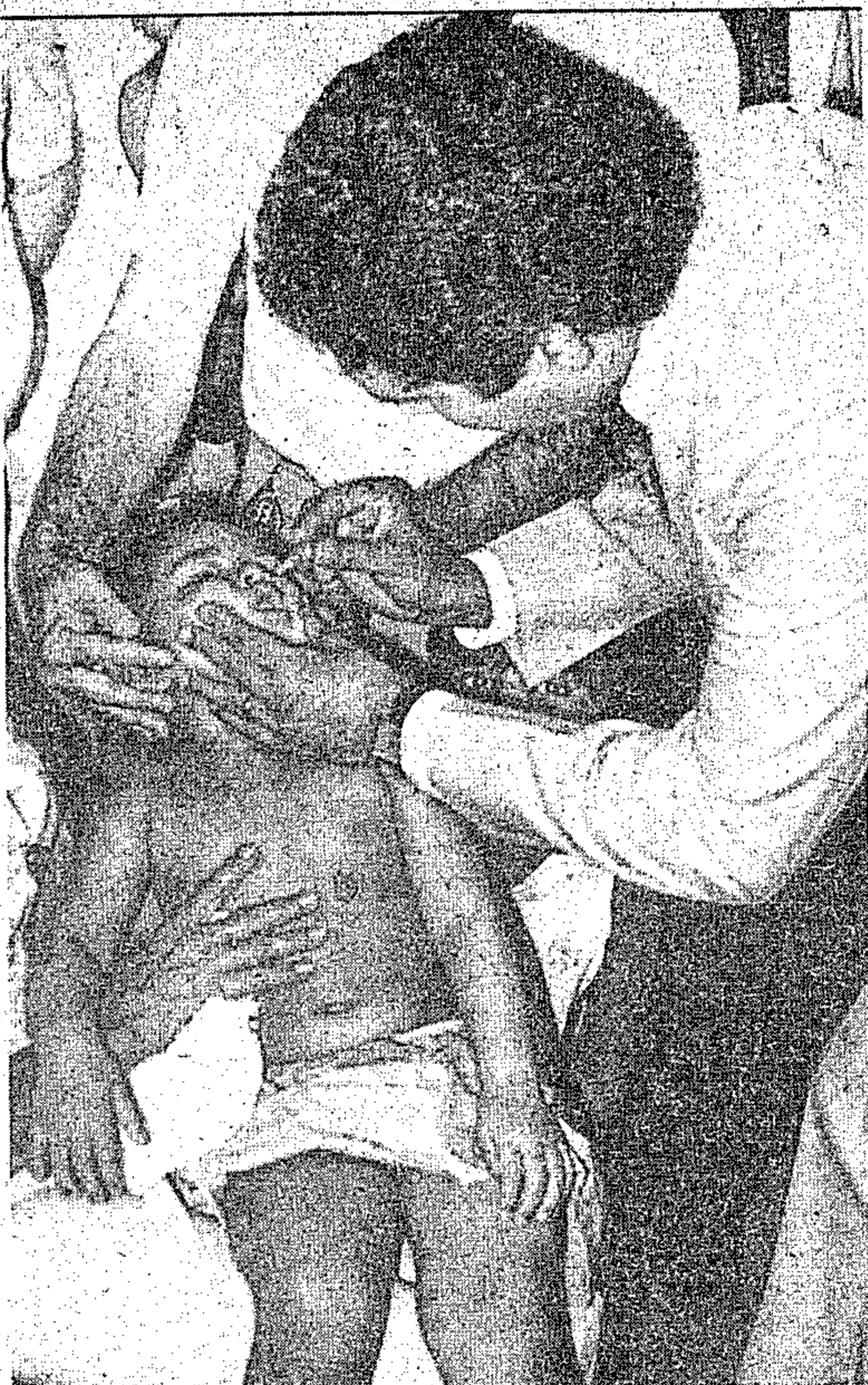
O governador Jader Barbalho retornou ontem de Brasília. Amanhã, participa pessoalmente da campanha de vacinação