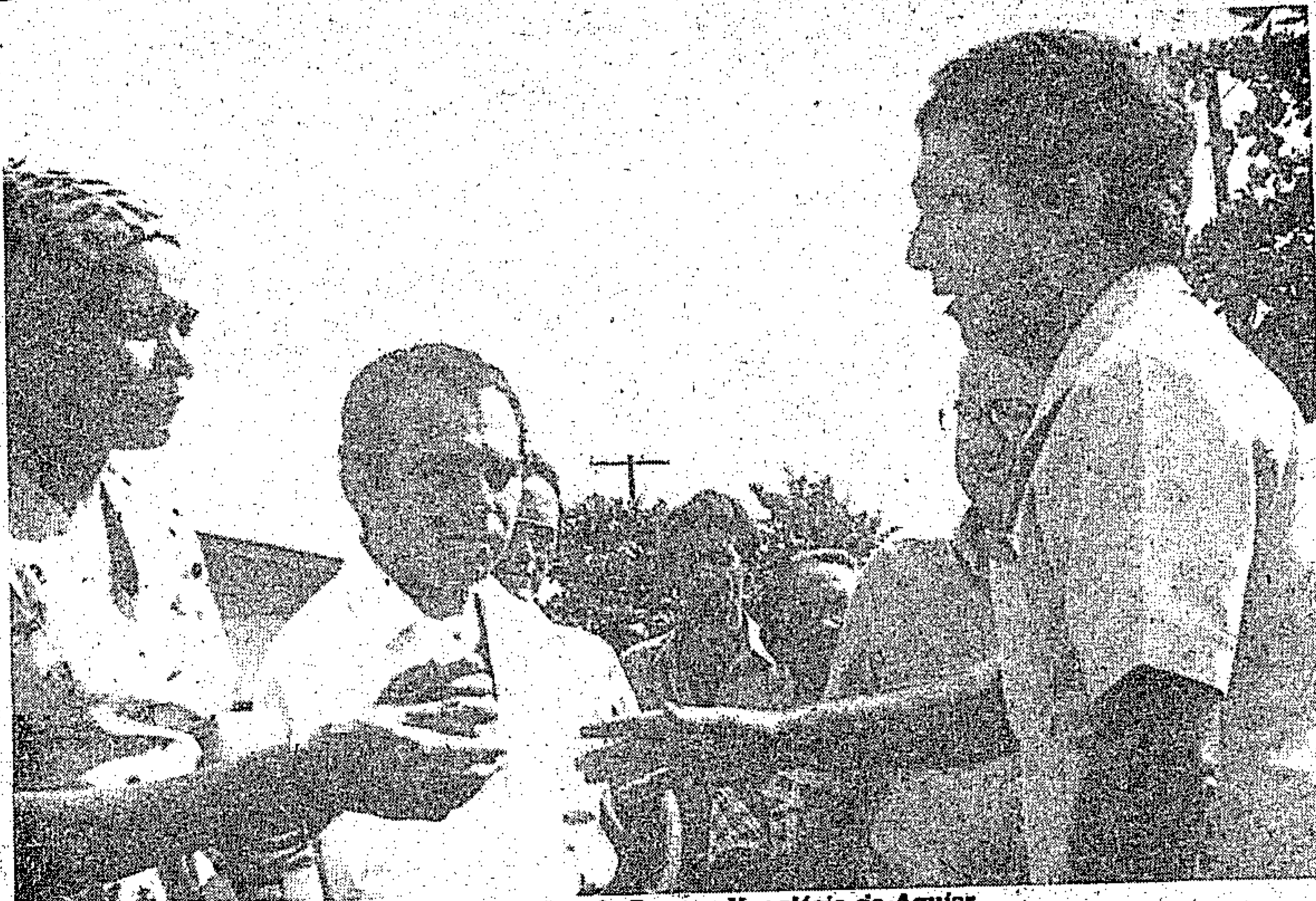
O governador Jader Barbalho com o presidente da Emater, Vanglésio de Aguiar

Por outro lado, quase 20% da renda gerada pela economia paraense vem do campo, e pela potencialidade agropecuária de nosso Estado, suas dimensões e posicionamento geográfico, era de se esperar maior