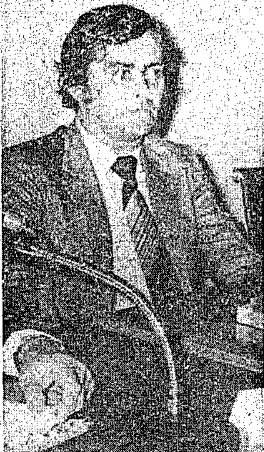
O novo presidente do Getat