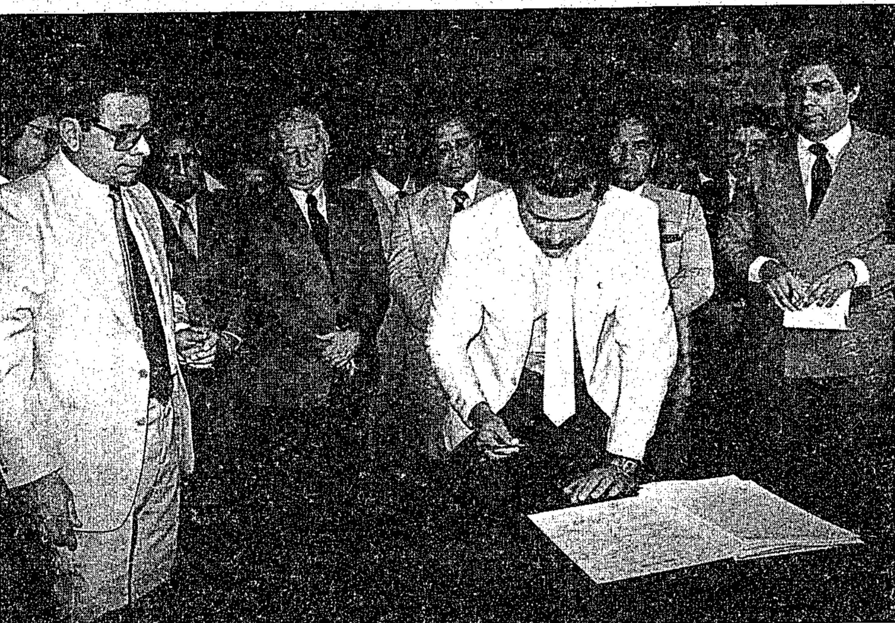
Coutinho Jorge, quando assumia a Secretaria de Educação

de licitação entre empresas empreiteiras para a construção de mais de cem salas de aula dentro do programa de recuperação e ampliação dos estabelecimentos de ensino da rede estadual com vistas a atender a matrícula de cerca de vinte mil crianças em idade escolar.