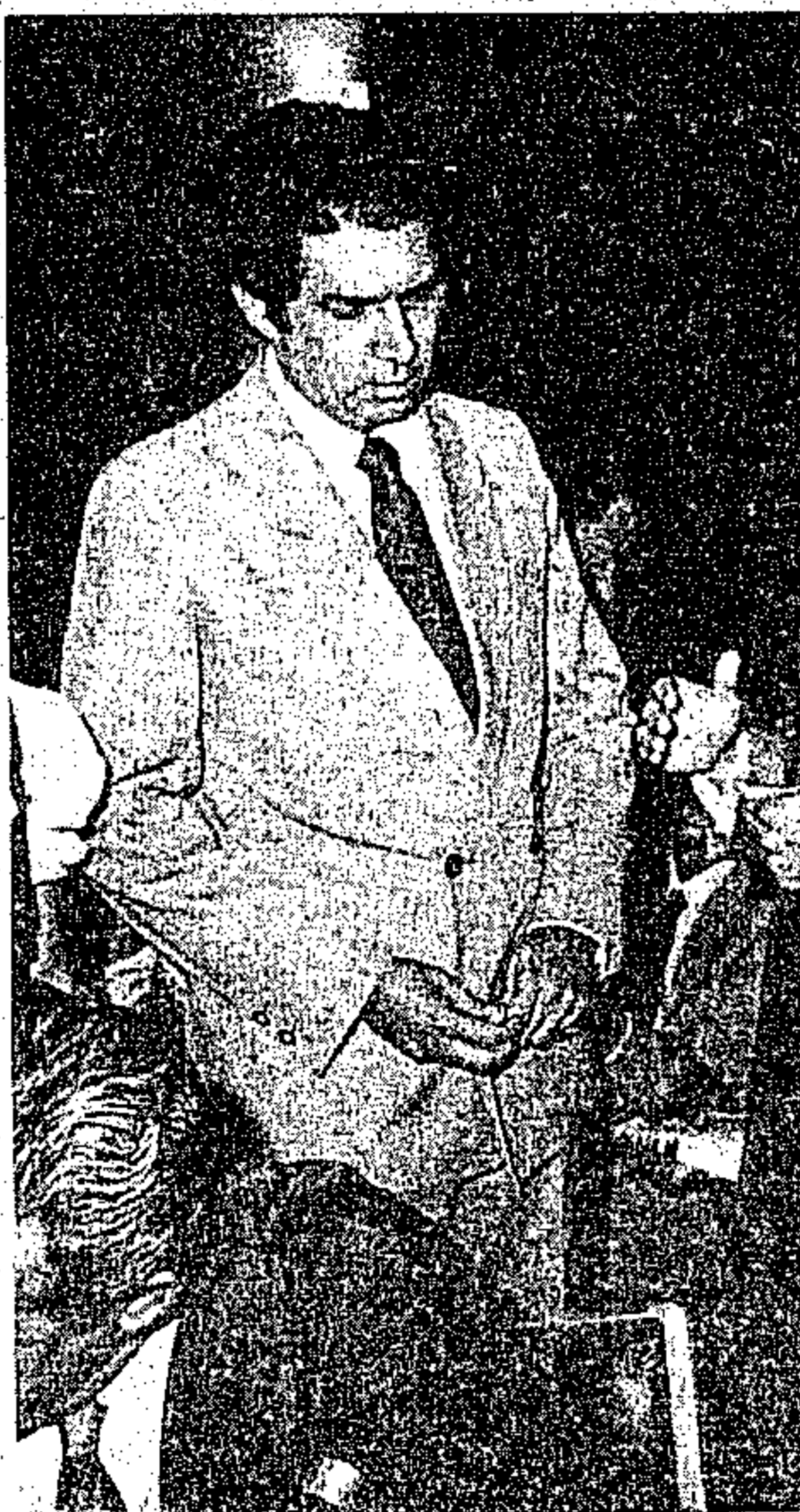
Jader cumpriu metas traçadas no Governo Itinerante

O governador Jader Barbalho e sua comitiva, após