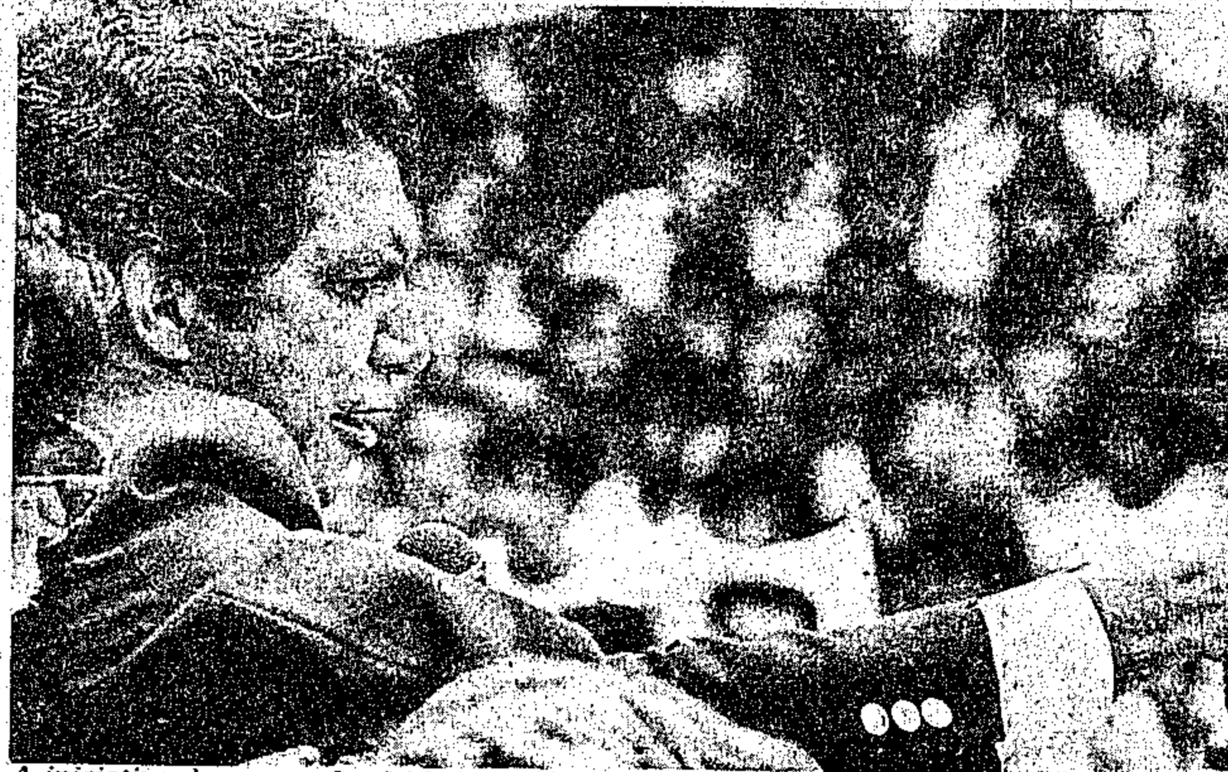
A iniciativa do governador foi bem aceita pelos candidatos