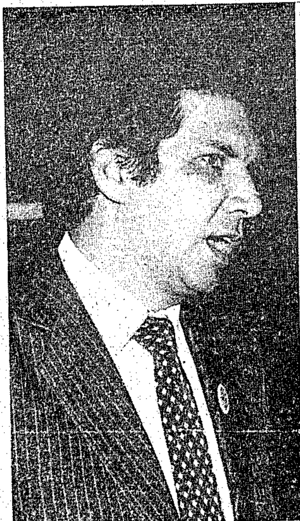
O governador, atento ao caso