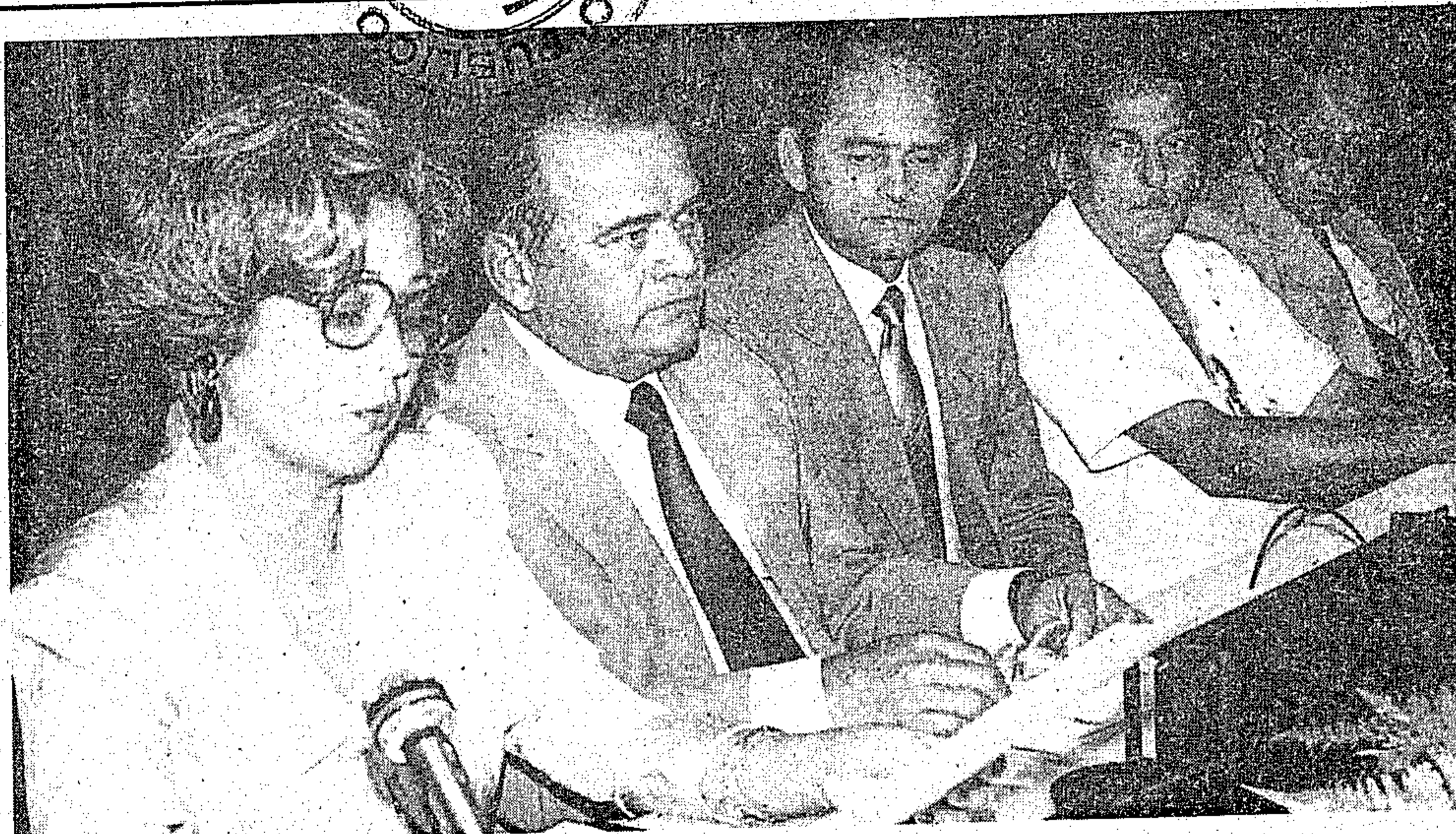
A solenidade de posse do novo superintendente regional do Iapas

As propostas dos funcionários da Fbesp foram aprovadas pela direção, que enviou o documento ao governador do Estado.