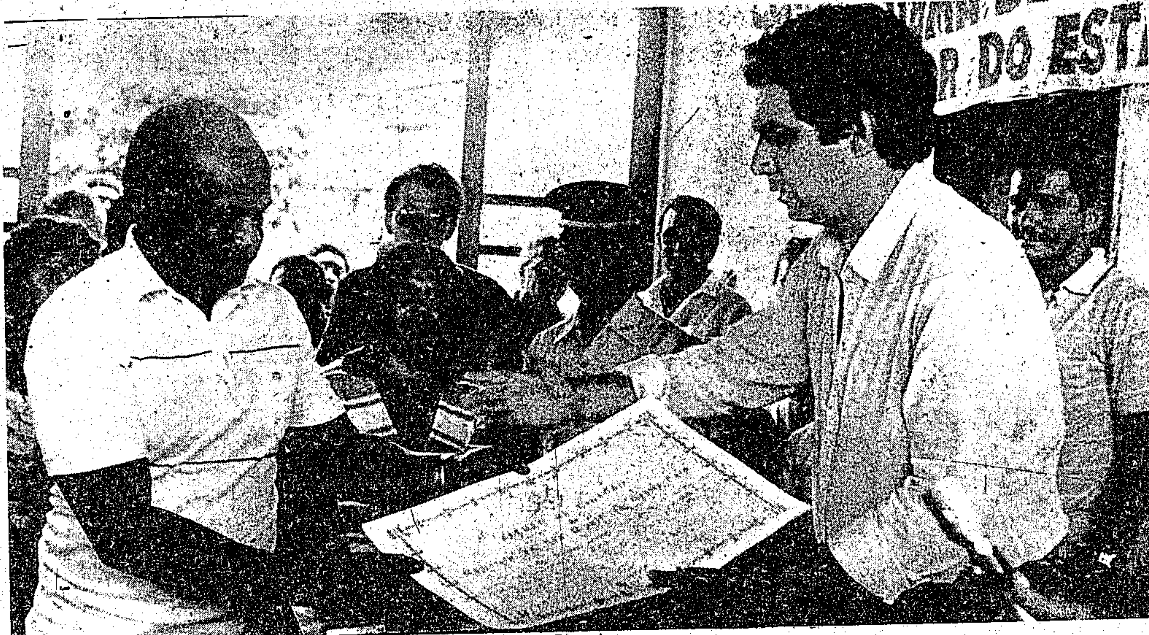
O governador Jader Barbalho entrega título de terra de São Miguel do Guamá

O chefe do Executivo manifestou sua satisfação pela obra ter sido concluída, cuja inauguração representava o resgate de uma