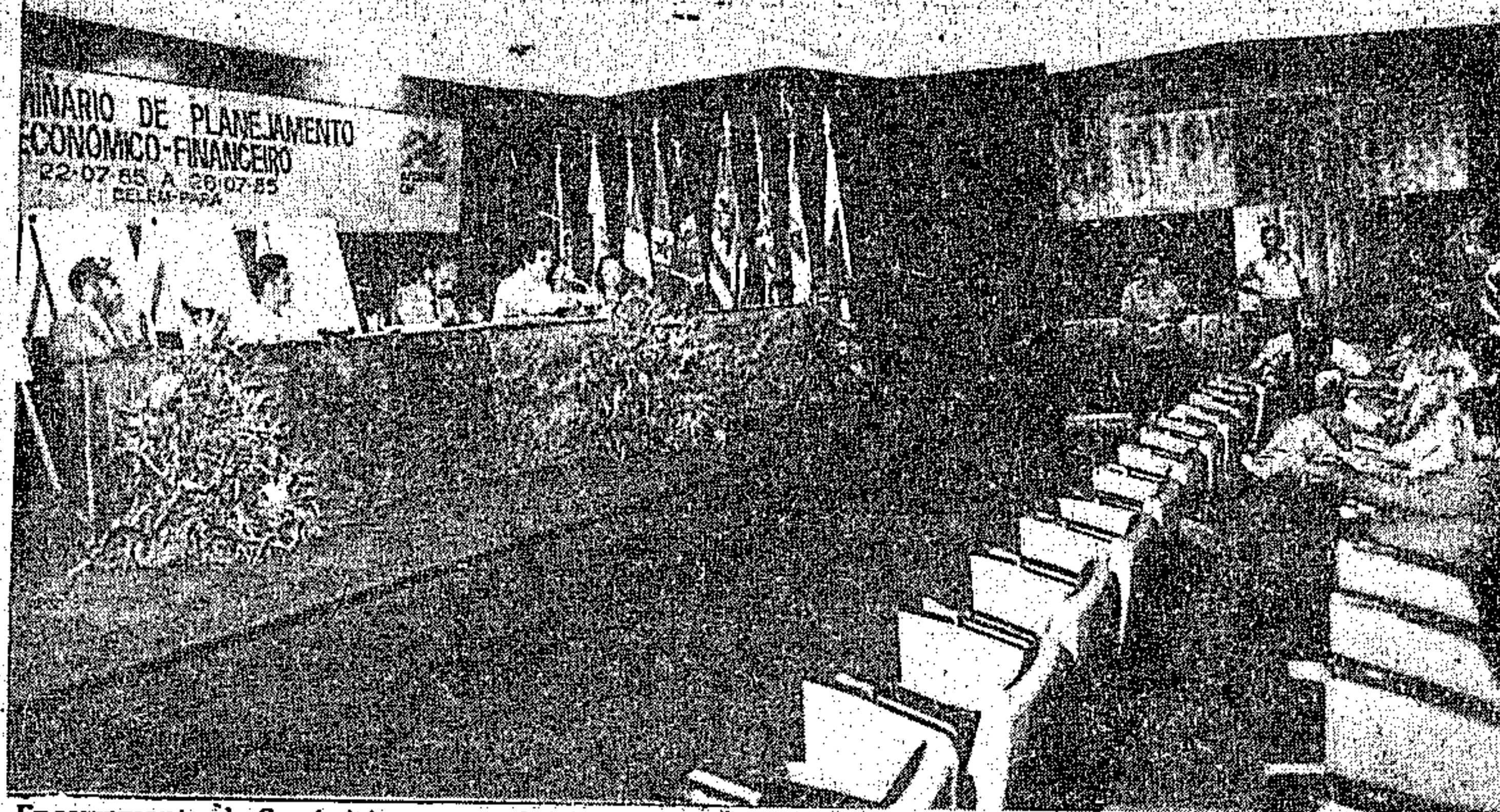
Encerramento do Seminário que envolveu o setor de eletricidade.