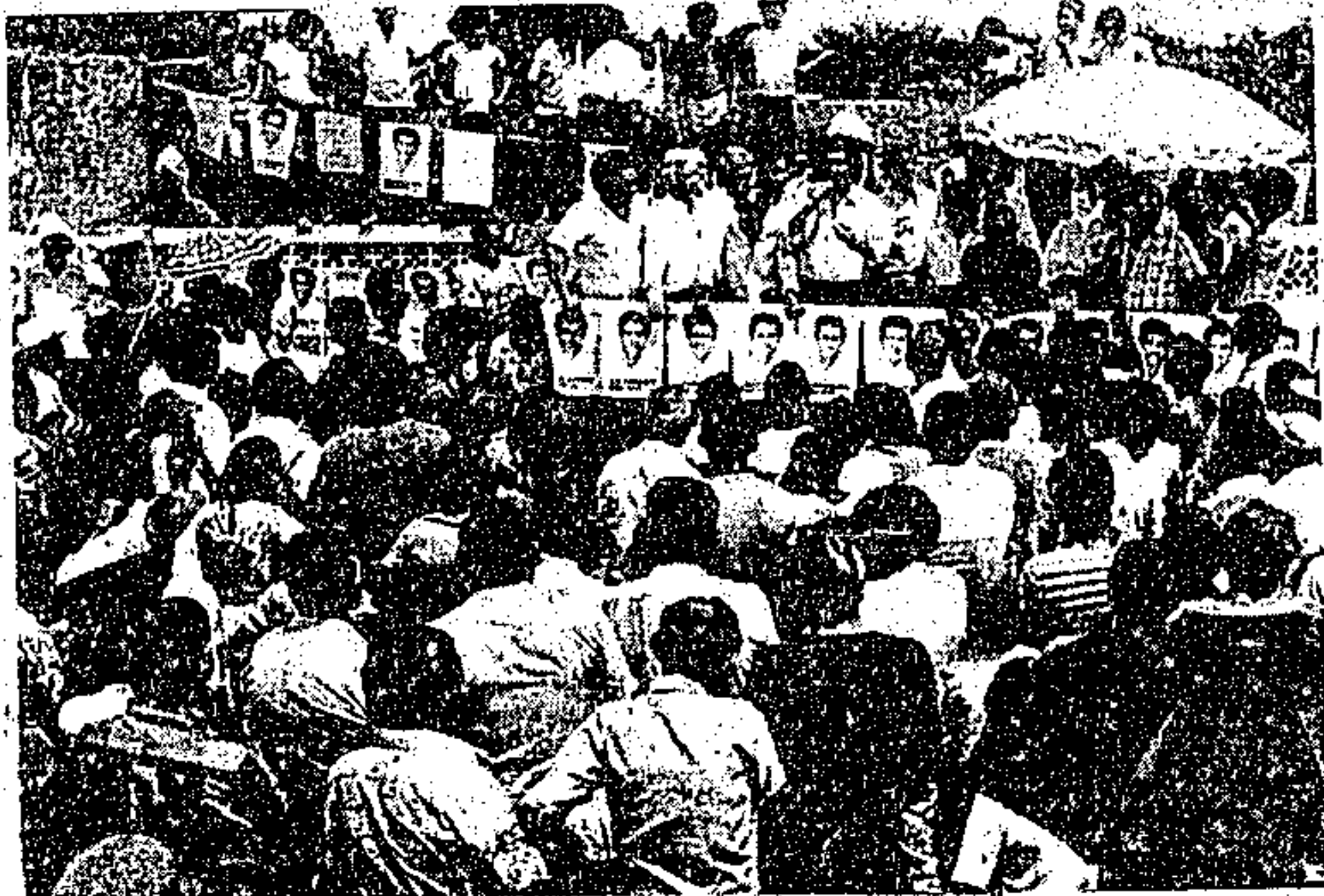
A população de São Miguel prestigiou o evento inaugural

O governador assinou convênio da Secretaria de Planejamento com a prefeitura local, no valor de 60 milhões de cruzeiros. No início de seu governo, Jader Barbalho fora a São Miguel do Guamá para inaugurar o prédio do terminal rodoviário. Este fato foi lembrado pelo governador, que se referiu ainda a pedidos que recebera de mais salas de aula para o colégio São José e instalação de uma feira do produtor.