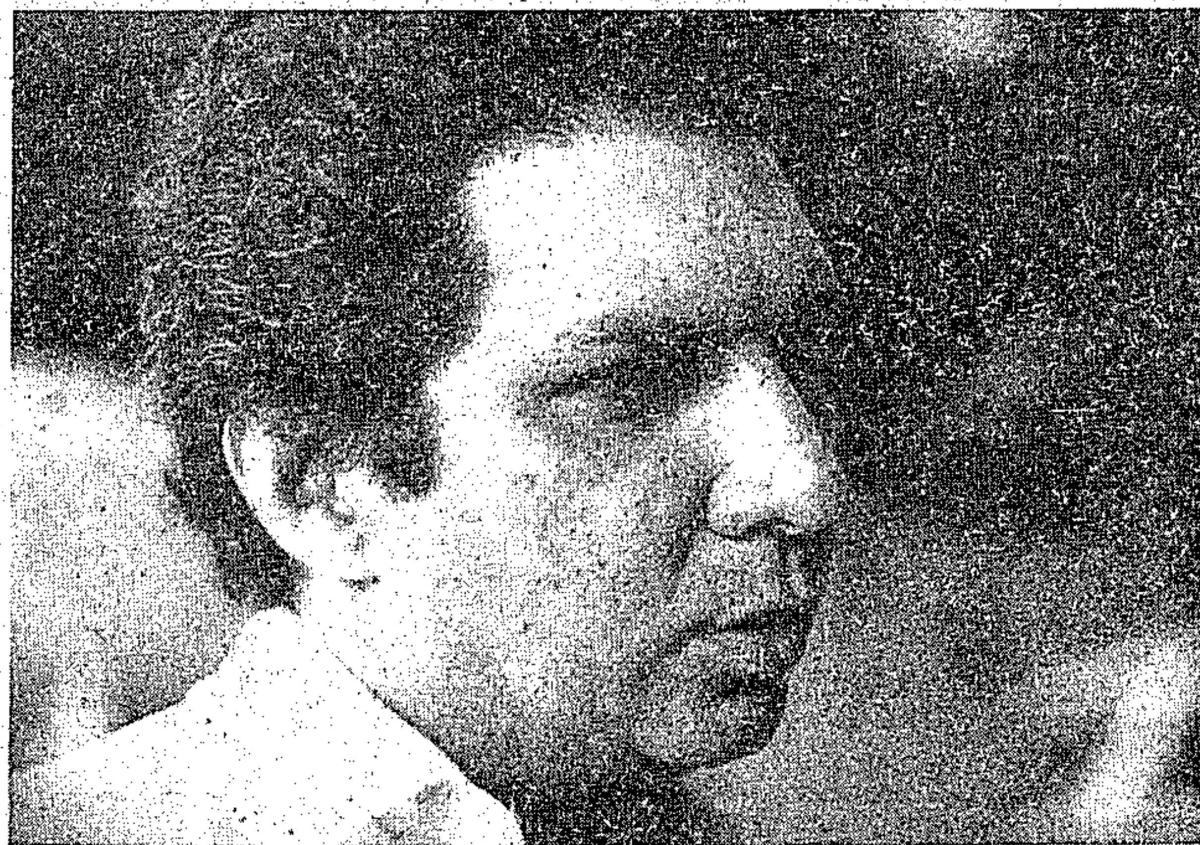
Jader mostra a dependência do Estado em termos de produção

E enfatizou o governador: "Com essa política de crédito, fica muito difícil o apoio ao pequeno agricultor, principalmente na região Norte, onde a diferença é fundamental a nível de estrutura fundiária. A política de crédito não pode ser única, adotada no Rio Grande do Sul ao Acre, porque o valor da terra no Pará, por exemplo é muito inferior ao valor da terra no Paraná. Um agricultor que tem 100 hectares no Paraná consegue oferecer a terra como garantia real e levantar um empréstimo considerável, que permite a execução de um projeto de agricultura".