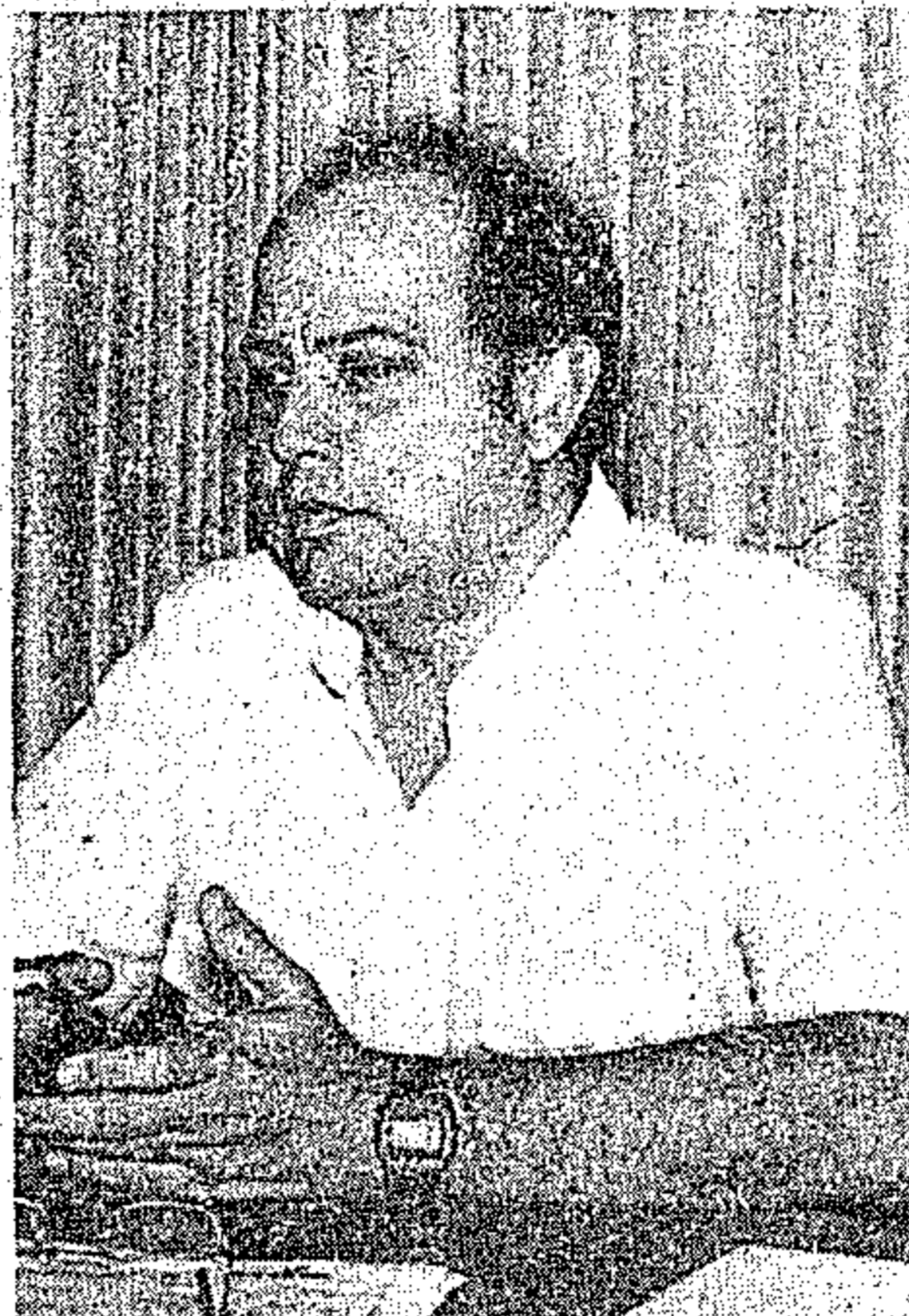
Bastos: pela descentralização

O Delegado Federal do DFA pleiteia também que no orçamento global para 1986 da União, sejam incluídas verbas afim de possibilitar a criação de uma estrutura rigorosa de fiscalização nas fronteiras do nosso Estado, evitando o que aconteceu agora, quando, por inexistên-