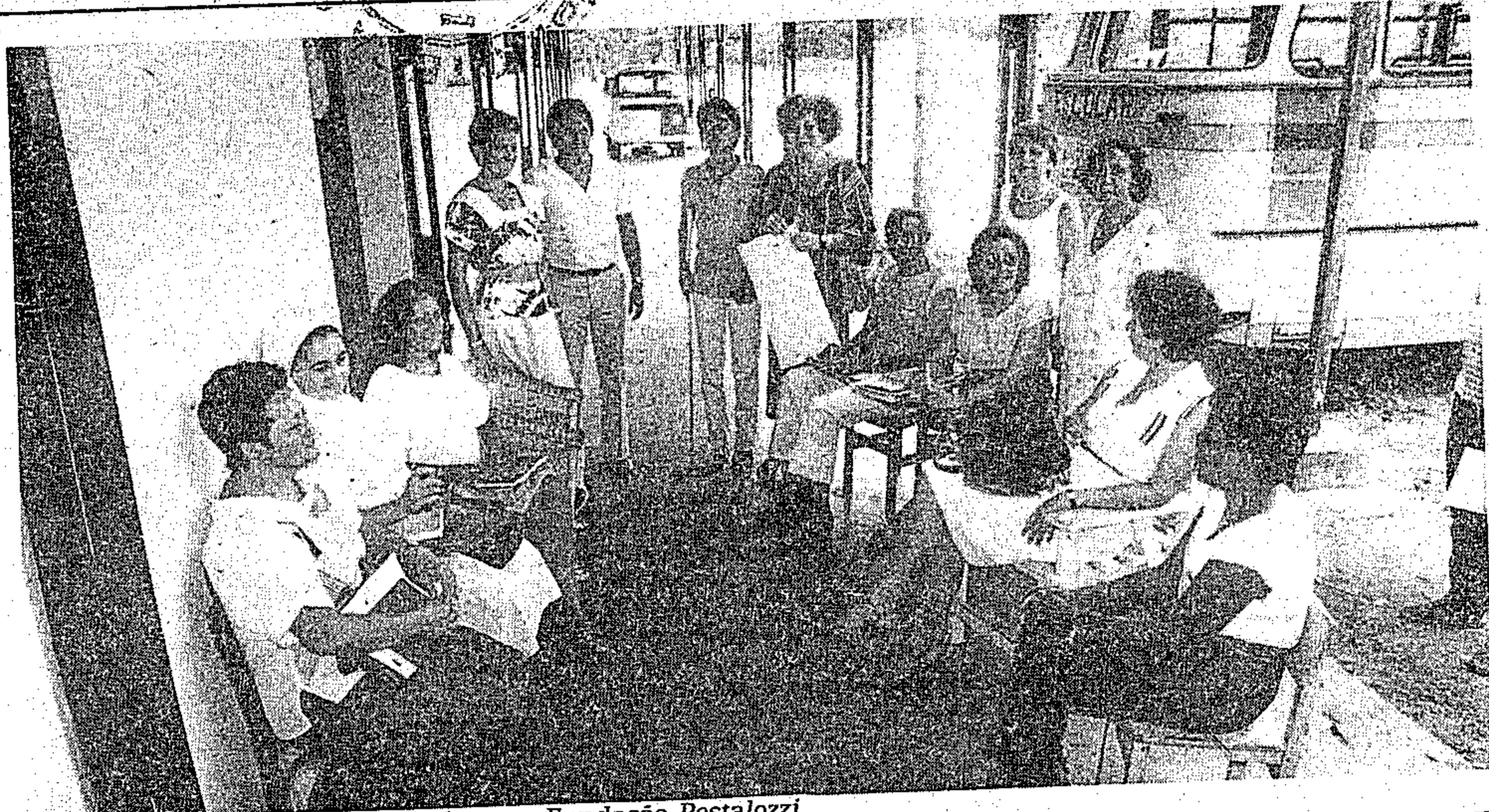
Reunião da comissão organizadora na Fundação Pestalozzi