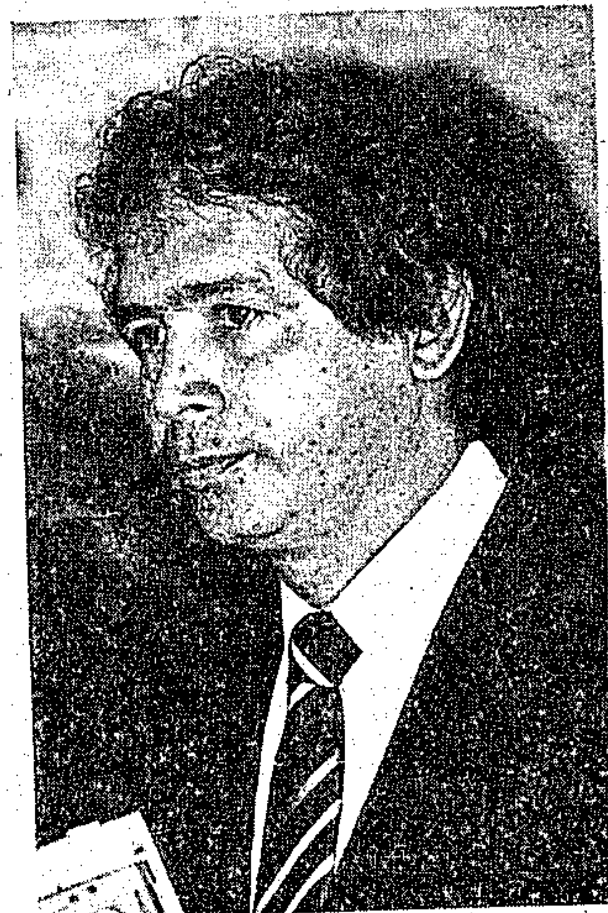
Herculano manteve contato com o governo japonês

Para o Secretário de Agricultura o governo Estadual tem grandes possibilidades de ter financiados esses quatro projetos pelo Governo japonês e uma resposta será oficializada dentro de um pequeno espaço de tempo.