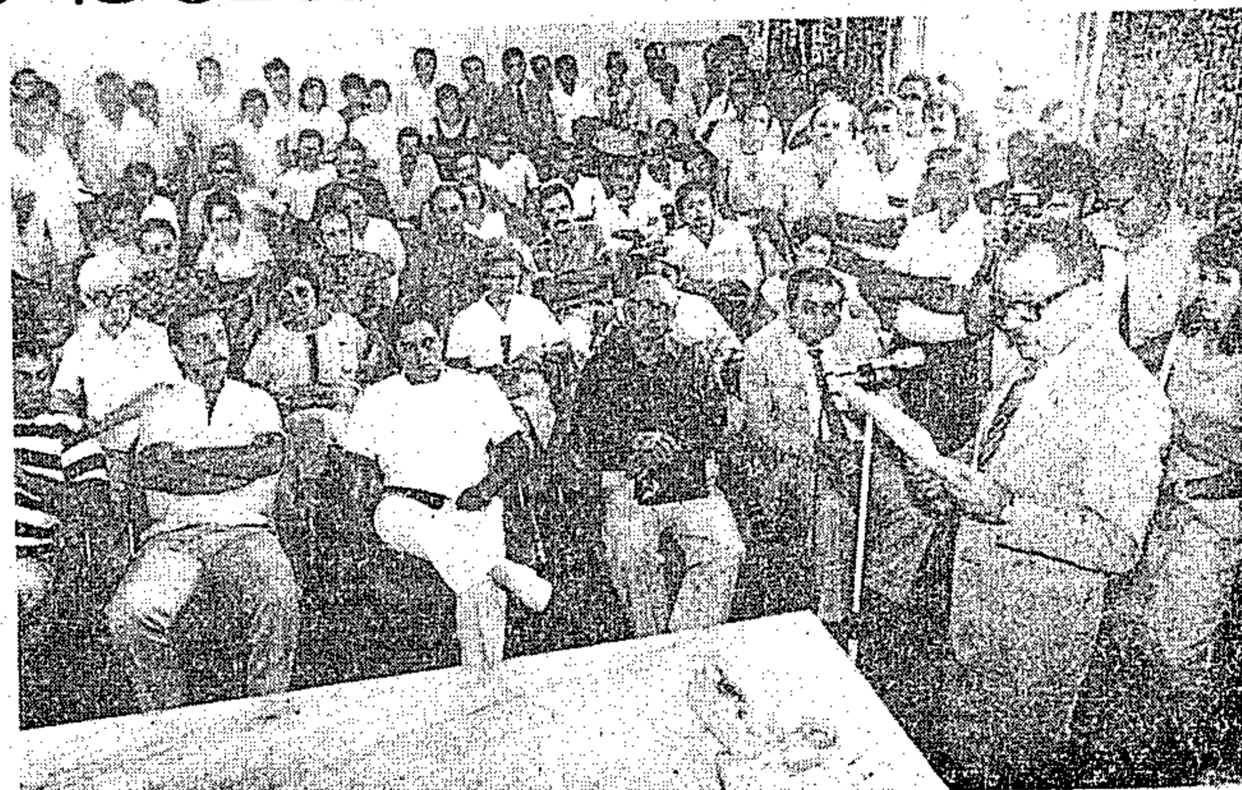
O novo chefe do 2º DRF discursa e aponta distorções

Reportou-se ainda a situação do DER-Pará, recebendo 600 milhões de cruzeiros mensais, que não cobrem um quarto de sua mão