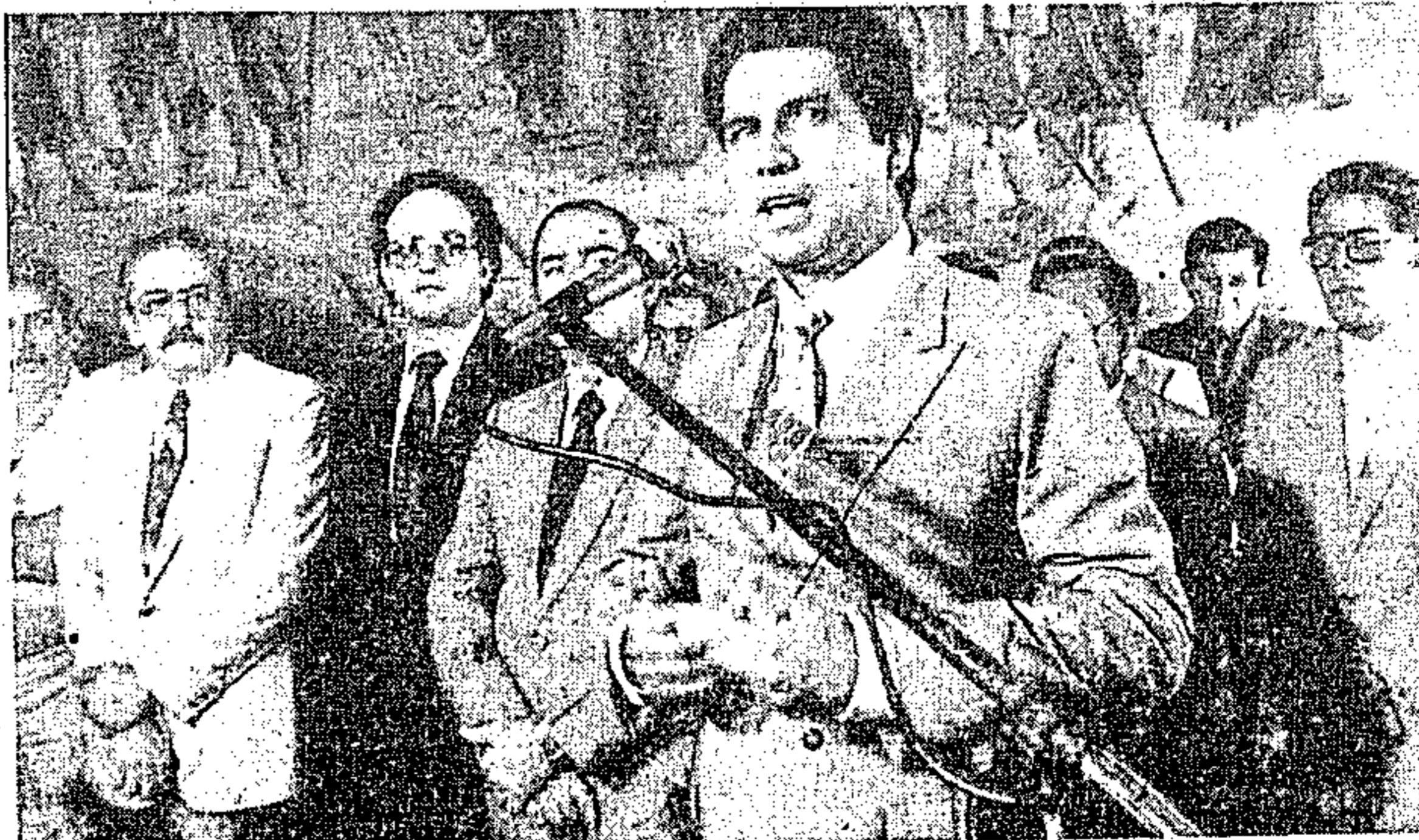
O governador falando na cerimônia do lançamento do selo

Em seu discurso, o chefe do Executivo disse que "há poucos dias, quando da reunião de secretários de Cultura, realizada em Belém, tivemos a alegria de receber o primeiro ministro da Cultura em Belém e no pronunciamento que proferimos, naquele encontro, tivemos a oportunidade de solicitar a ele que o Ministério pudesse programar e orientar o governo federal no sentido de que as ações culturais visassem a garantir a identidade regional".