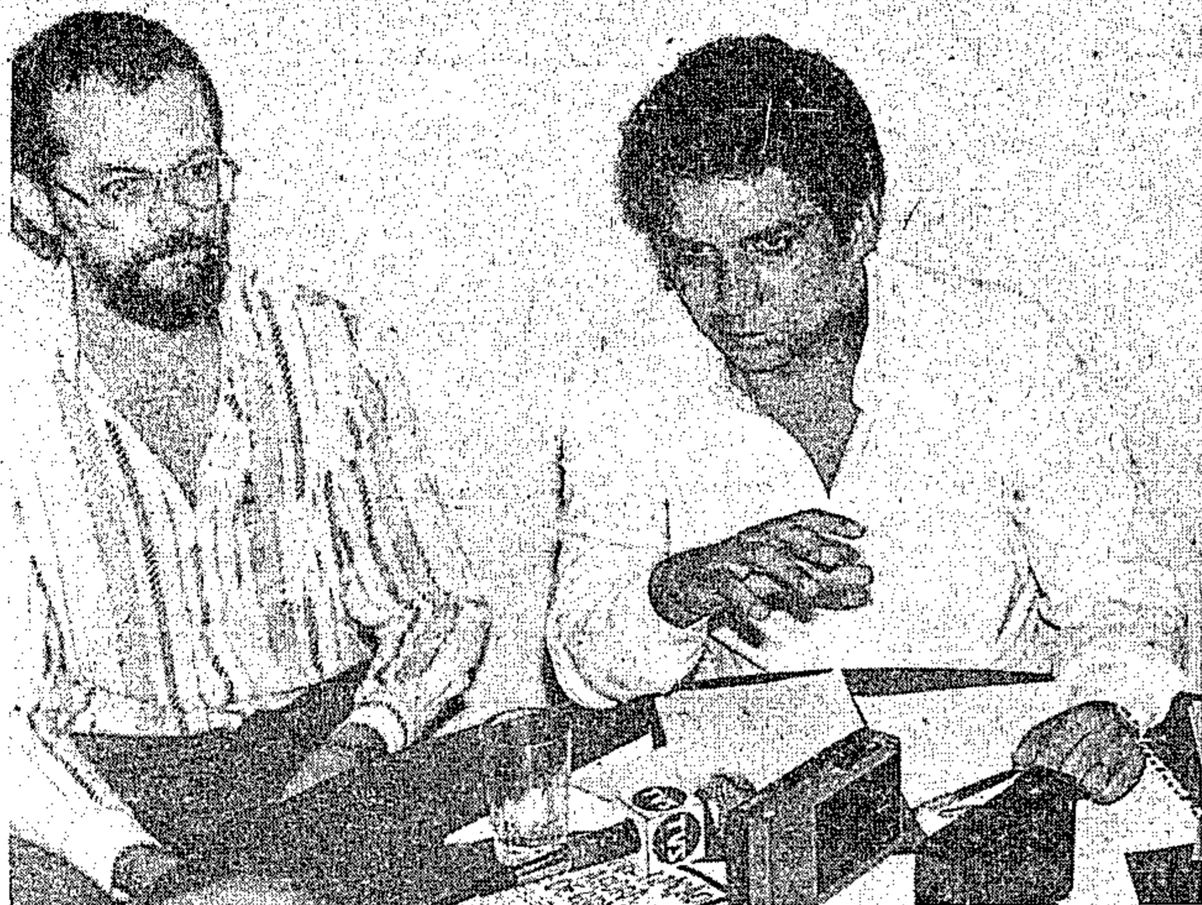
O titular da Seduc com o governador