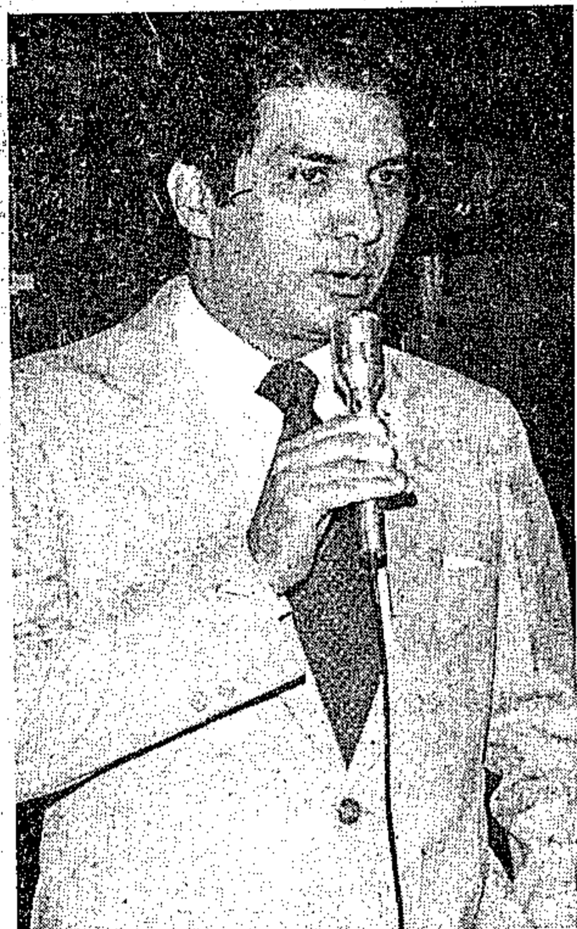
O governador manteve contatos com o presidente José Sarney

BELEM - QUINTA-FEIRA, 22 DE AGOSTO DE 1985