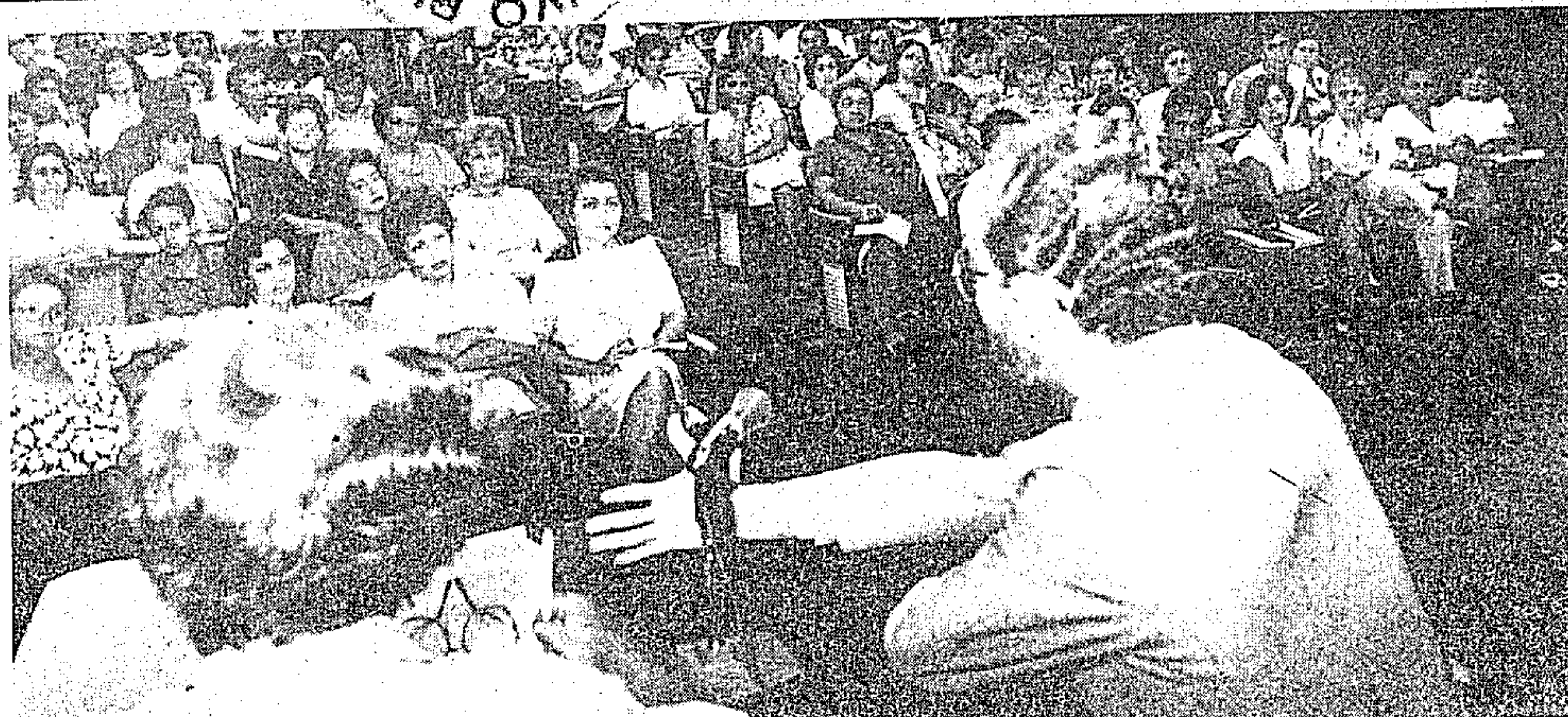
O titular da Seduc reuniu-se com todas as diretoras de escolas.