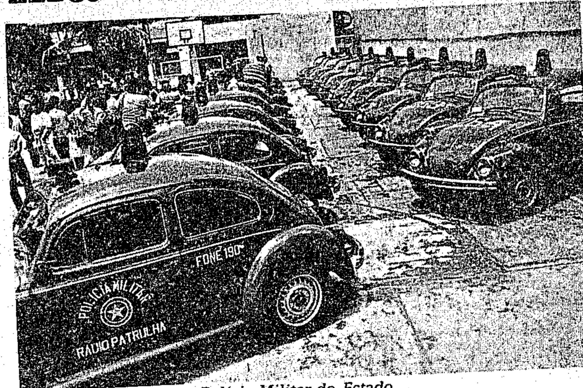
Novas viaturas para a Polícia Militar do Estado

Por sua vez, o Governador Jader Barbalho disse que há poucos dias se reuniu com os assessores e assinou um decreto para que o Estado do Pará se enquadre na orientação do Presidente José