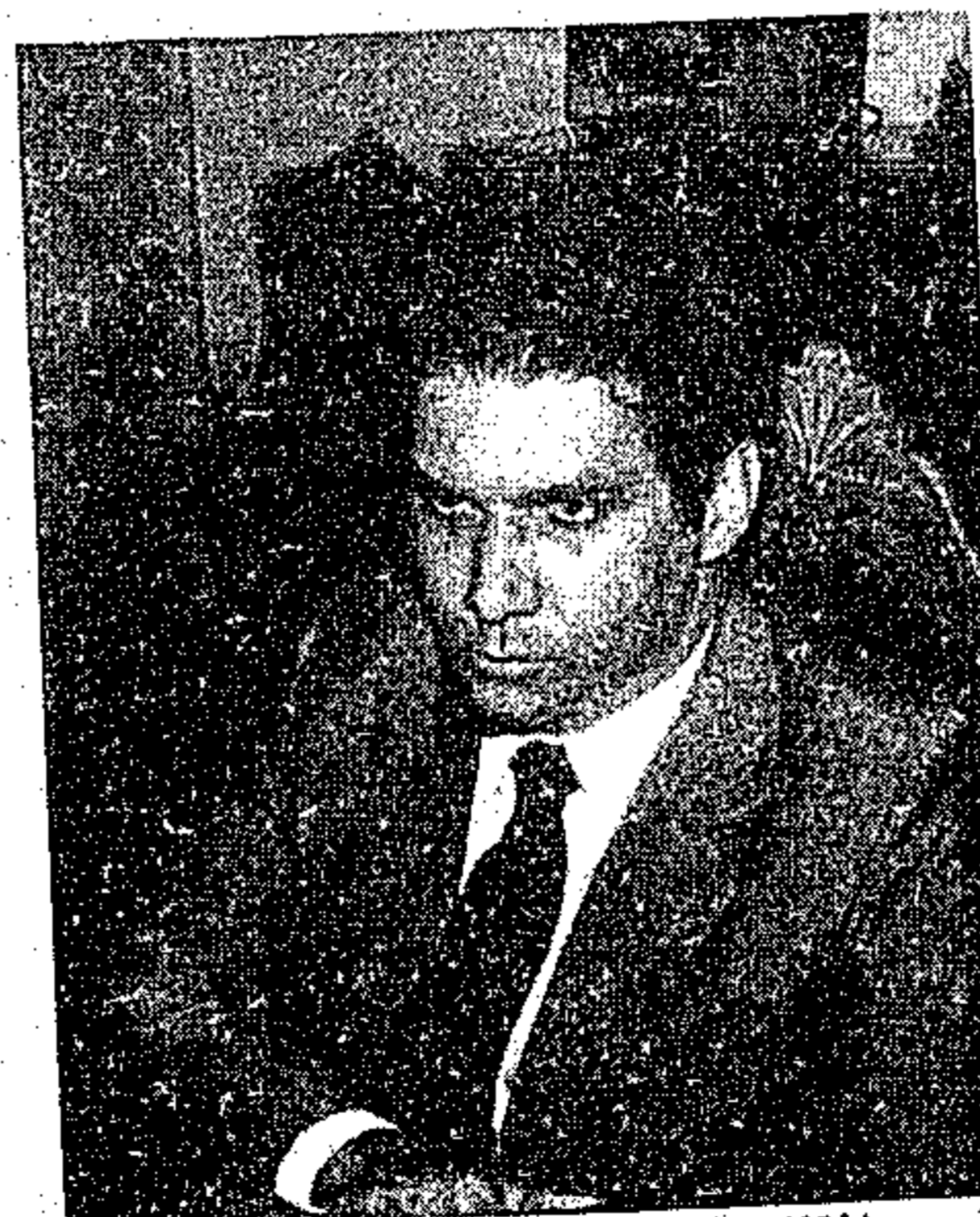
Jader reforça a Polícia Militar do Estado

A iniciativa do Governador do Estado, visa dar um combate à situação de insegurança em áreas concentradas no sul do Pará, considerando os apelos partidos da comunidade e informações veiculadas pela imprensa local, denunciando o estado de tensão e um clima de violência que ameaçam a tranquilidade pública, naquela região. O esquema faz parte do Mutirão Contra a Violência Urbana lançado recentemente pelo Presidente José Sarney e encampado pelo Governo do Estado, objetivando conter toda e qualquer ação criminosa que afete a paz e a segurança da coletividade, se impondo a tomada de medidas eficazes que