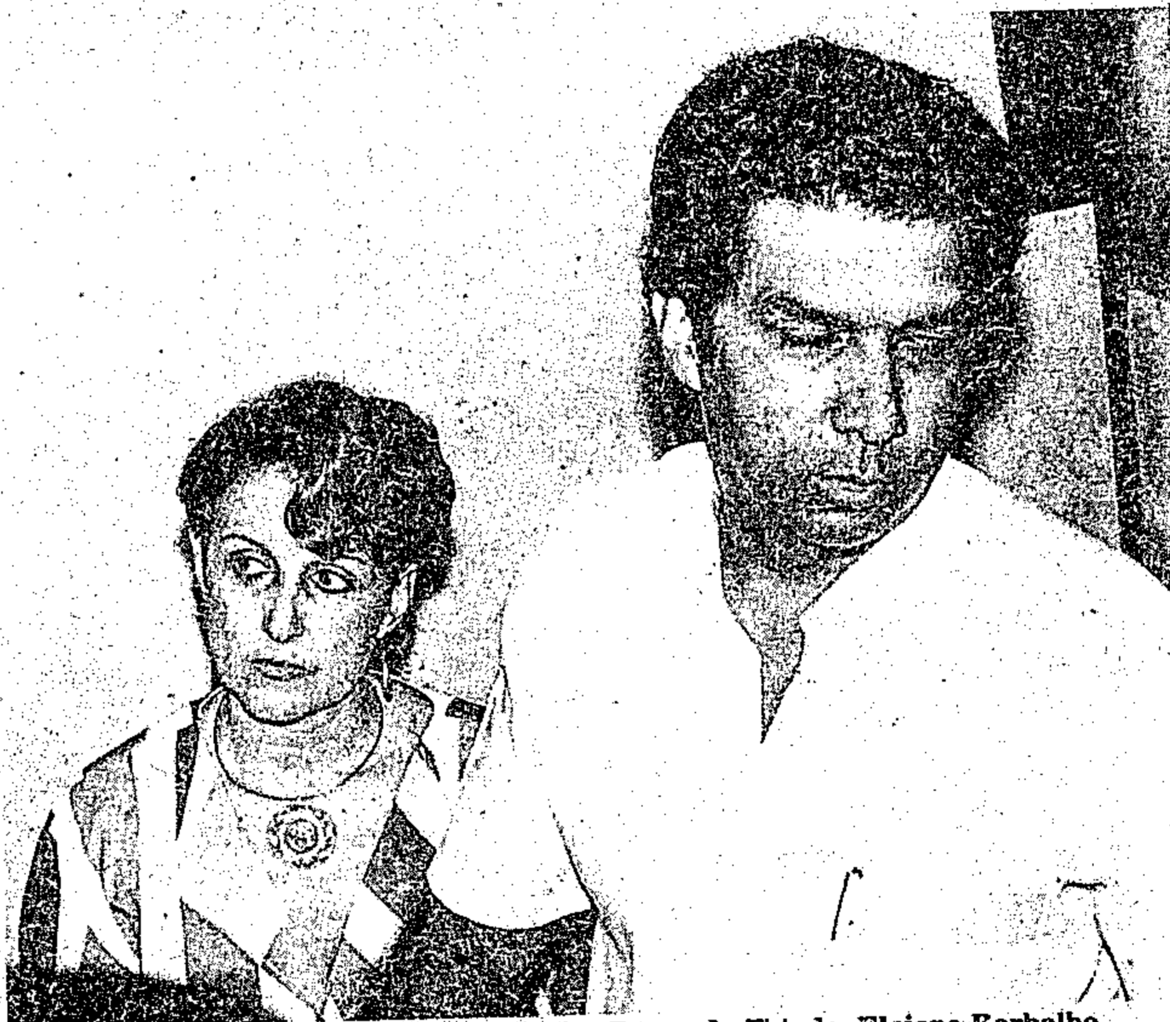
Governador Jader Barbalho e a Primeira Dama do Estado, Elcione Barbalho