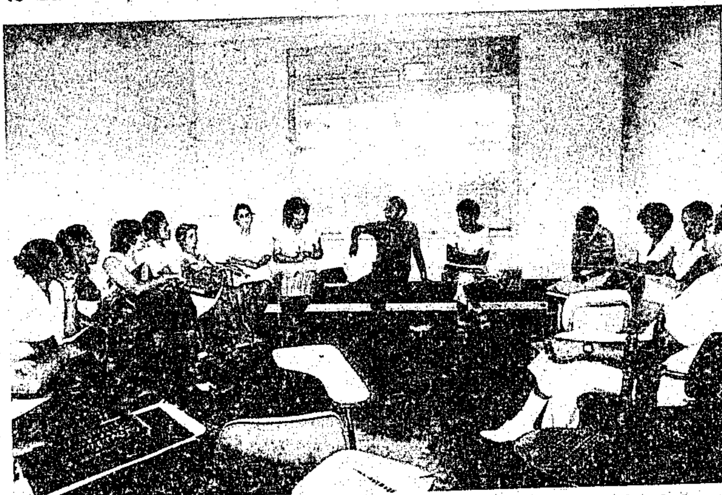
O encontro de técnicos, que comemora os 93 anos da instituição