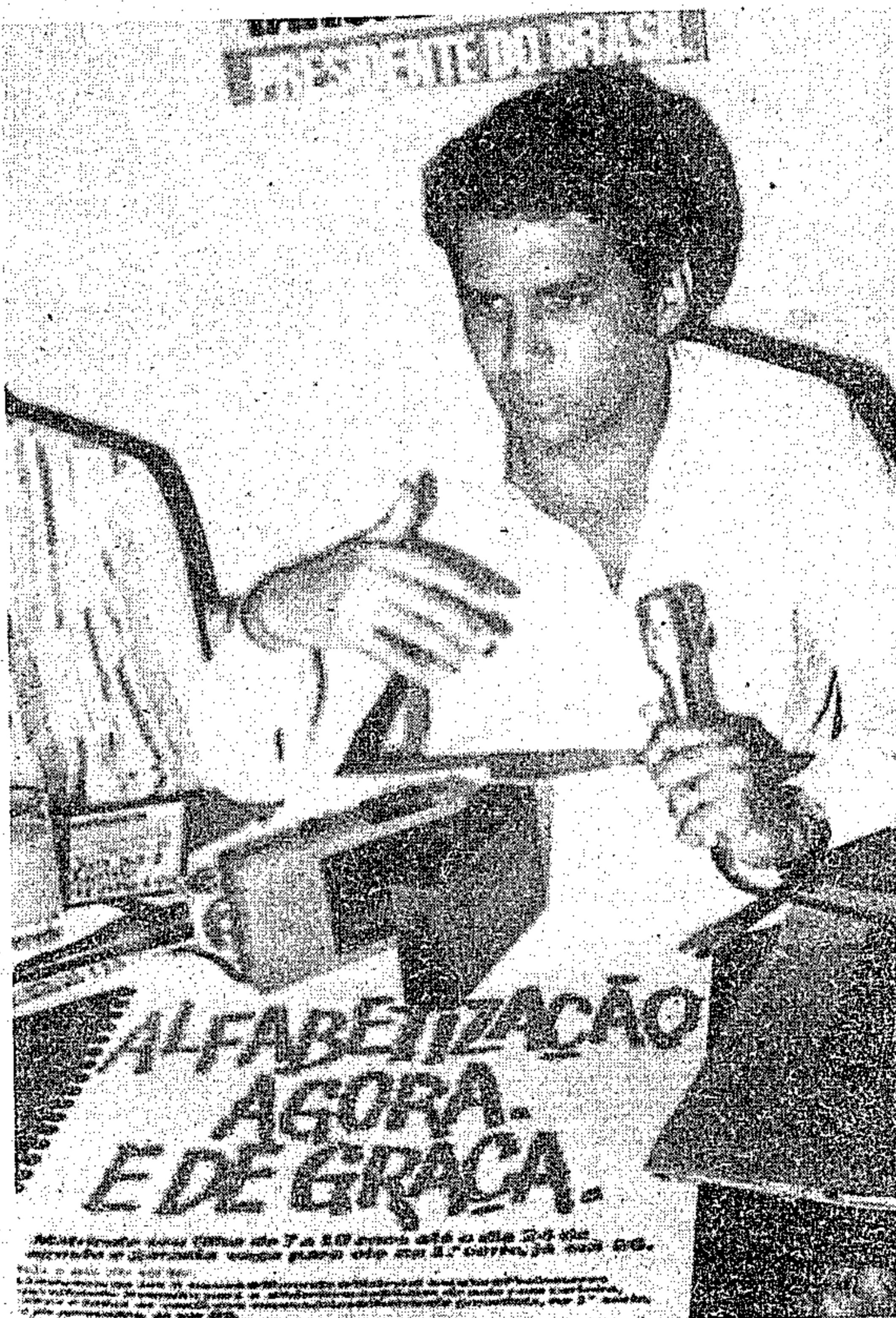
O governador Jader Barbalho quando lançava o Programa