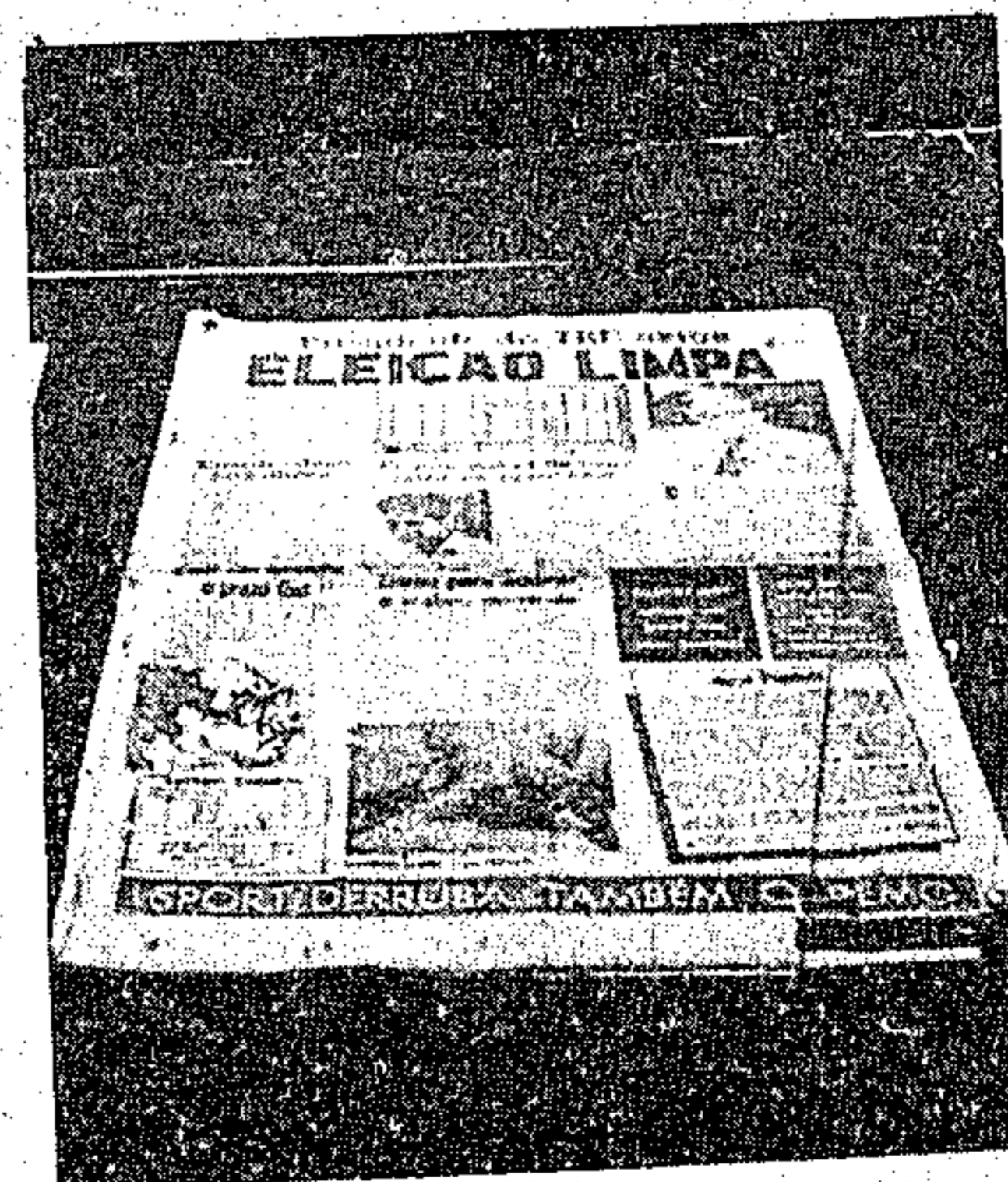
Entre os jornais expostos no Museu, o primeiro número do DIARIO DO PARA