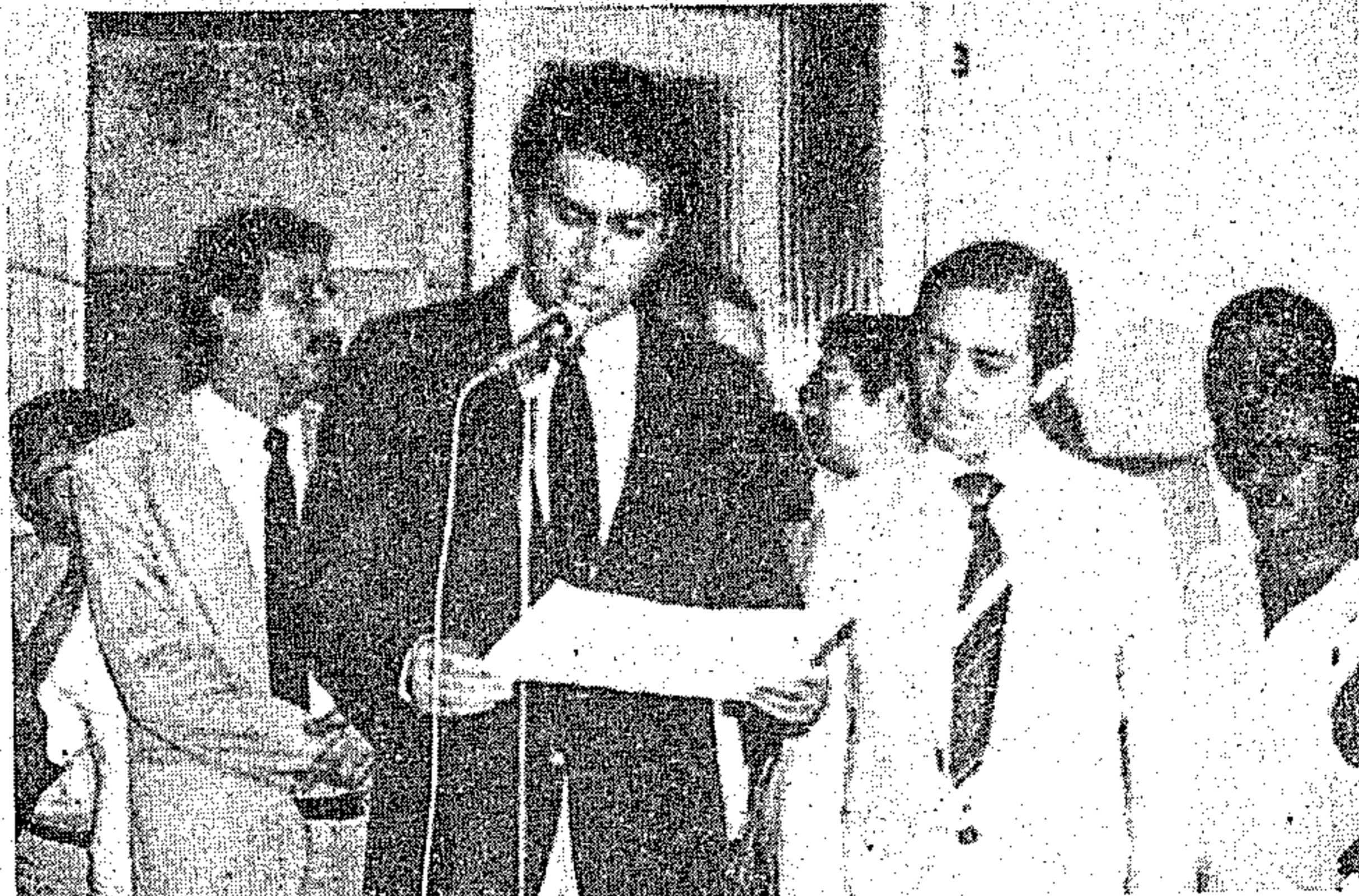
Na Segup, Jader anuncia os novos índices salariais

Enfatizando que os percentuais de reajuste de salários foram estabelecidos a níveis superiores ao INPC, e que a partir de agora nenhum funcionário do Estado ganha proventos inferiores ao salário mínimo, o governador Jader Barbalho falou à categoria, ressaltando a sua manifestação em poder atender uma antiga reivindicação: equiparar os salários dos policiais com os que servem ao Poder Judiciário. E que esta iniciativa se apresentava como um estímulo para quantos servem nos quadros da Secretaria de Segurança.