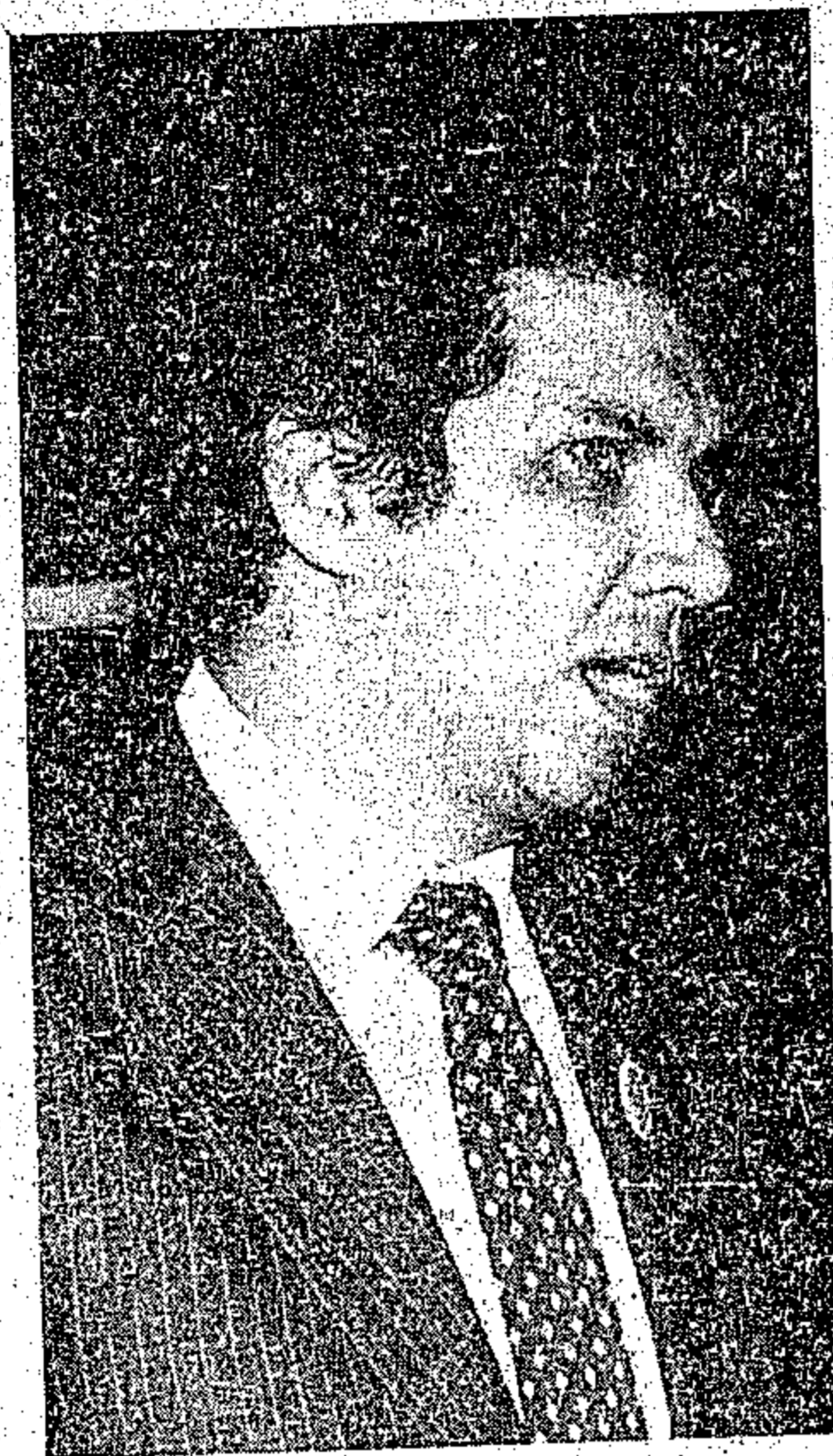
O governador inaugurou o Cenatran