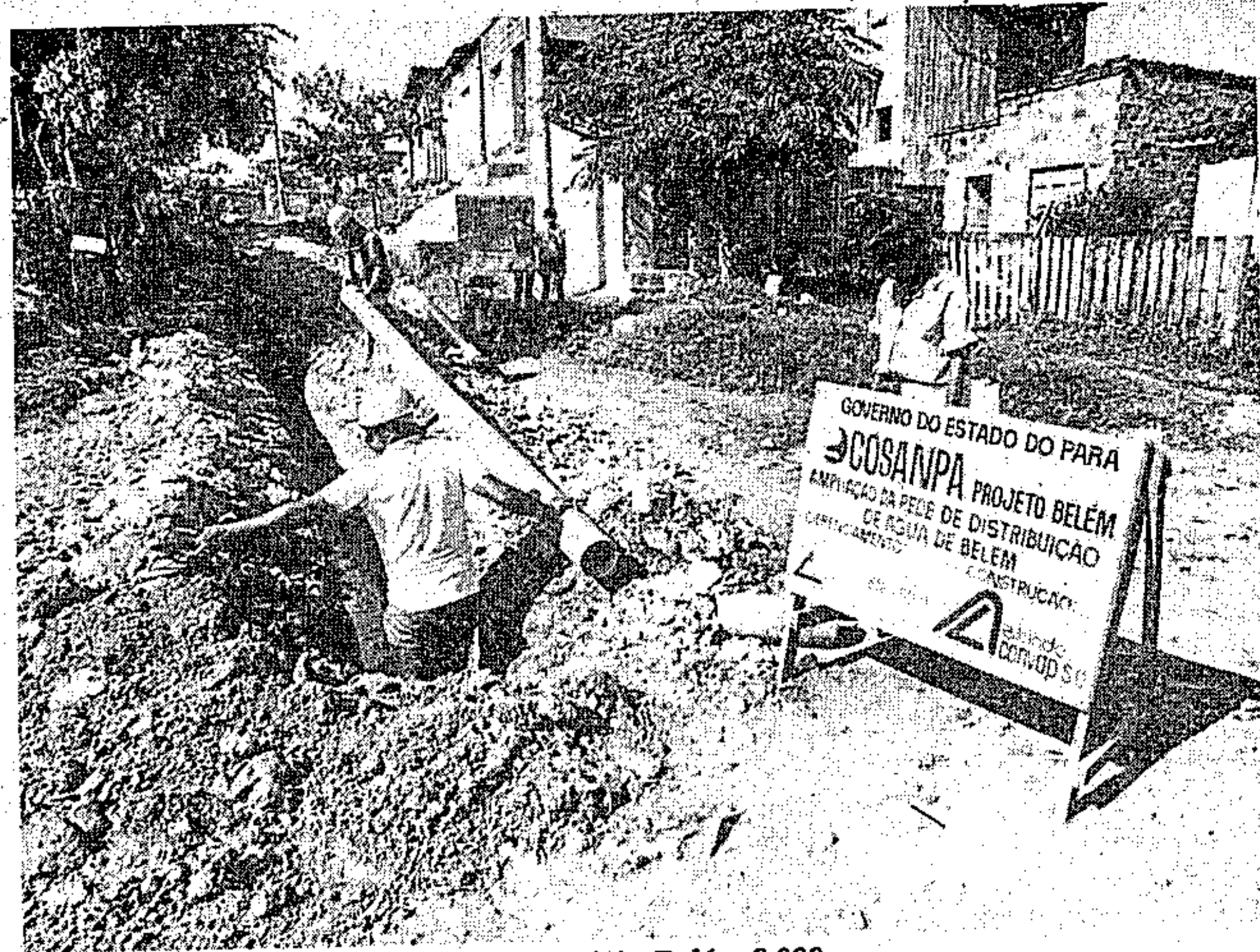
A Cosanpa vem desenvolvendo o Projeto Belém 2.000

Os dirigentes das empresas de Saneamento, que antes de ir ao ministro do Planejamento e à Seap mantiveram uma reunião coordena-