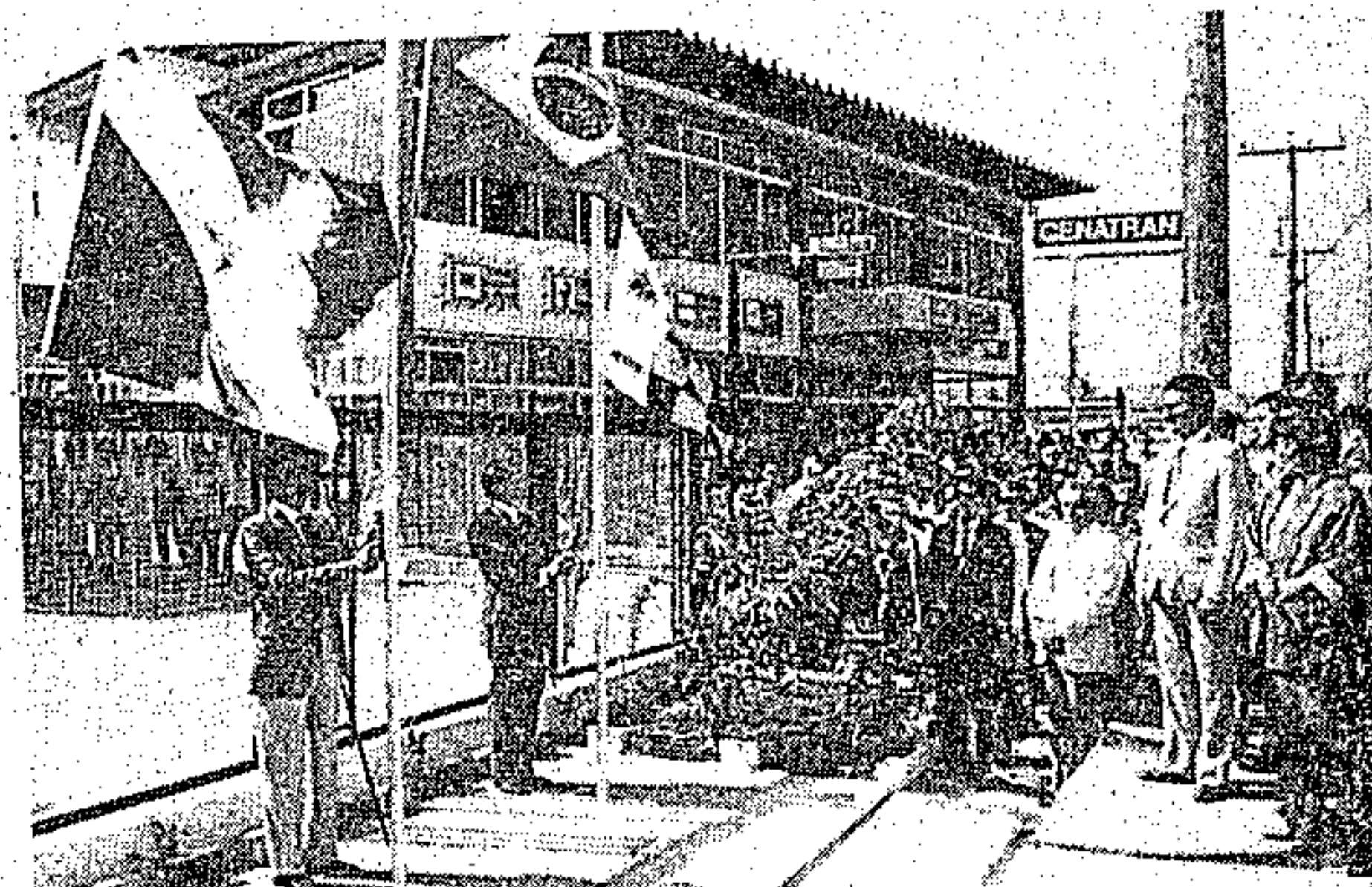
O governador no hasteamento das bandeiras