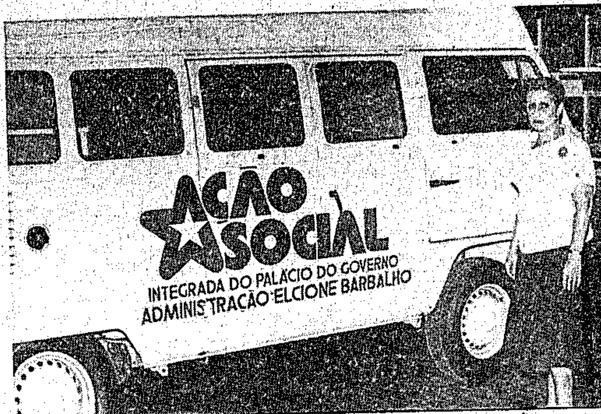
A Ação Social atua junto à população carente