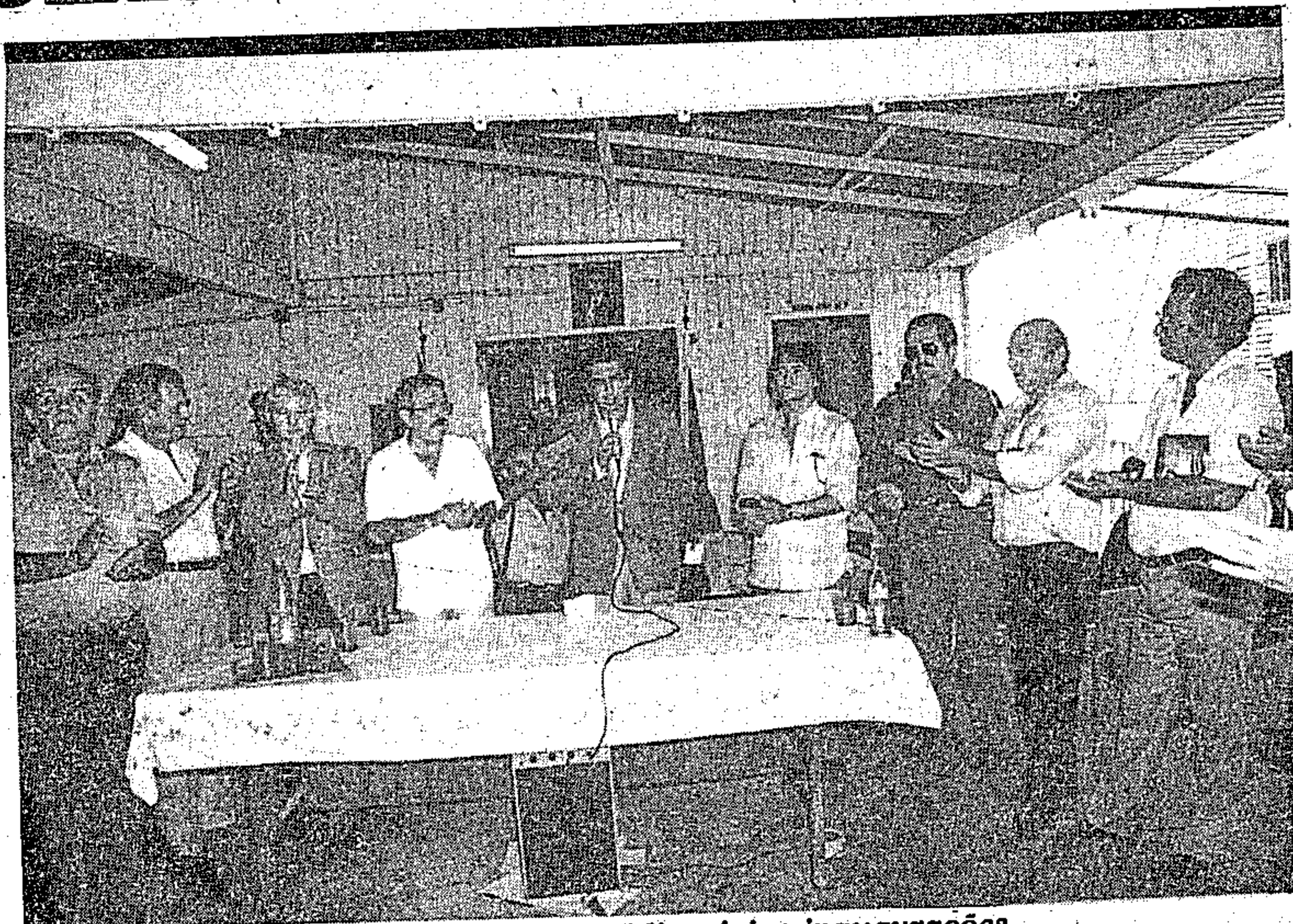
Jader esteve em Santarém, onde presidiu várias inaugurações -

A seguir, a programação de inaugurações a ser cumprida pelo Governador Jader Barbalho, em Breves: QUINTA-FEIRA - 9 horas, chegada ao aeroporto; 9:30 inauguração de Antena Parabólica para captação de sinais da Funelpa via satélite, à Rua do Aeroporto, a antiga estação de passageiros; 10 horas, instalação da Pedra Fundamental do 6º Batalhão da Polícia Militar do Estado, à Rua do Aeroporto, próximo a Horta Comunitária; 10:30 horas, visita à Escola Esta-