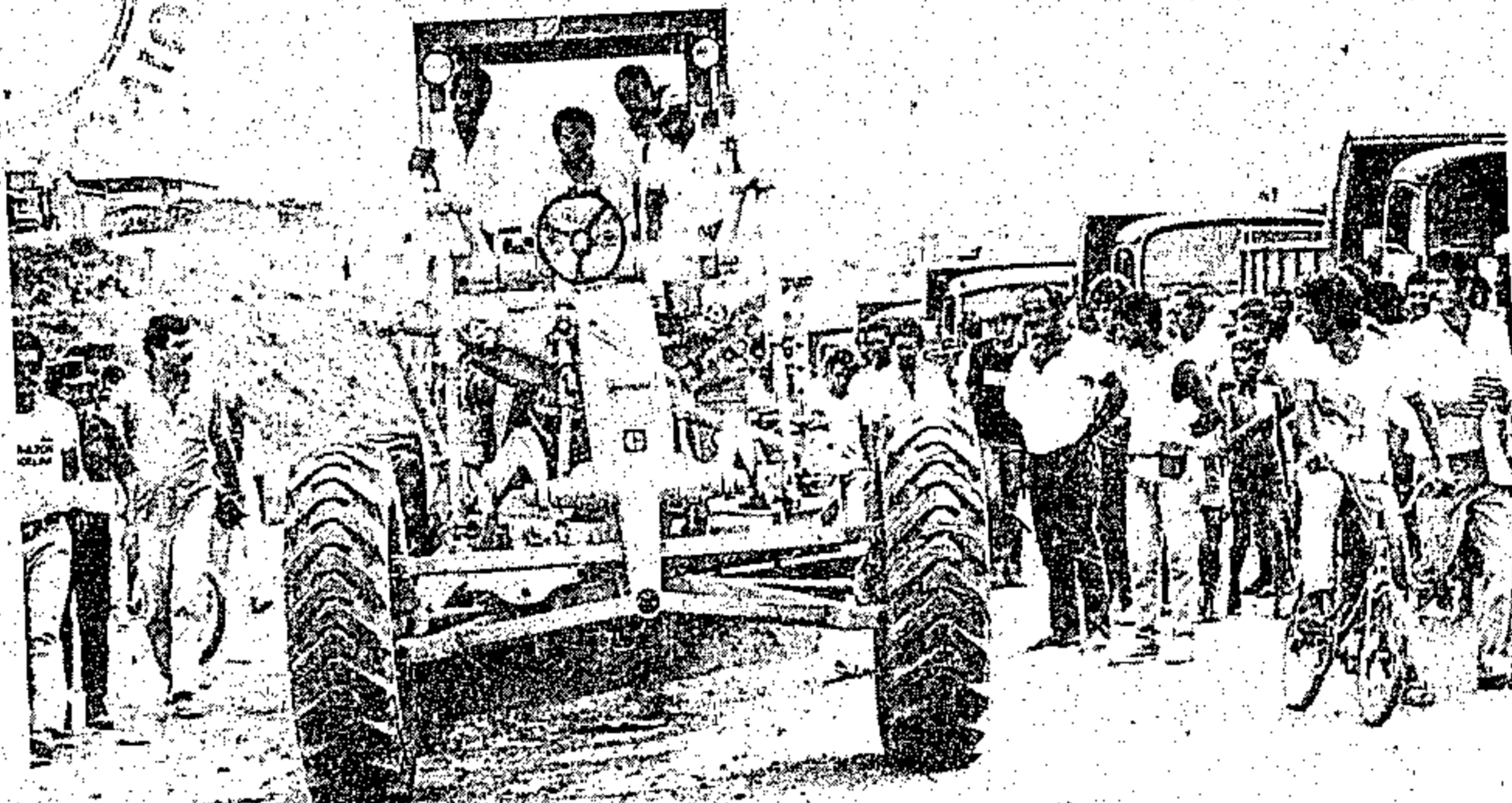
Em Curionópolis foi dada a partida para a restauração urbana

A Celpa investiu 25 bilhões de cruzeiros na energia elétrica