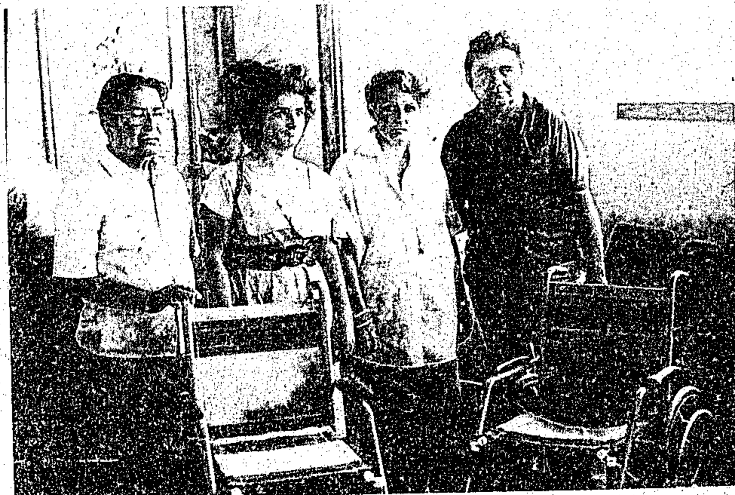
D. Elcione distribuiu mais cadeiras de rodas aos carentes

Operários já começaram o trabalho de desmontagem das barracas e stands da Feira.