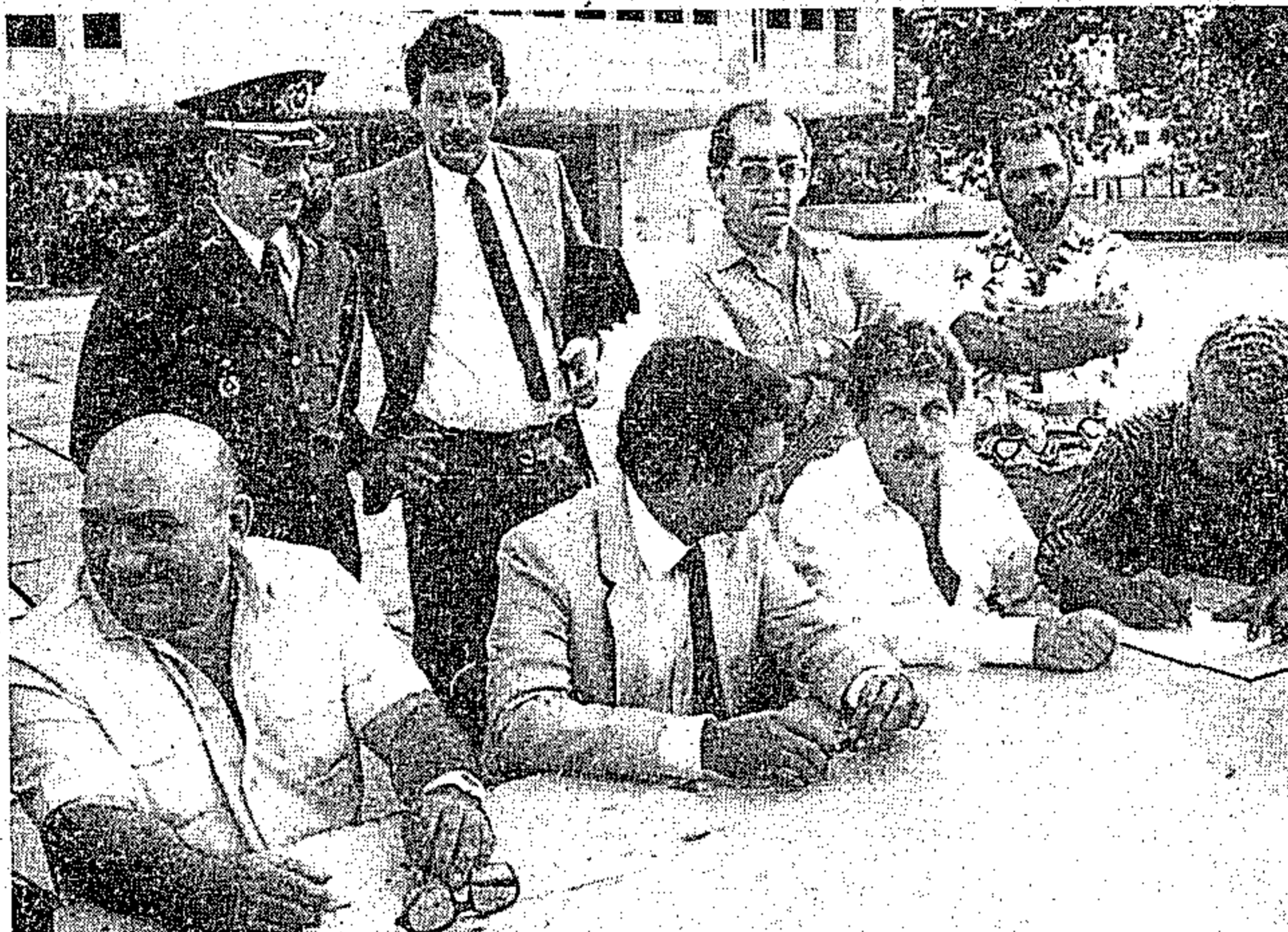
O governador assinou decreto repassando verba para a obra