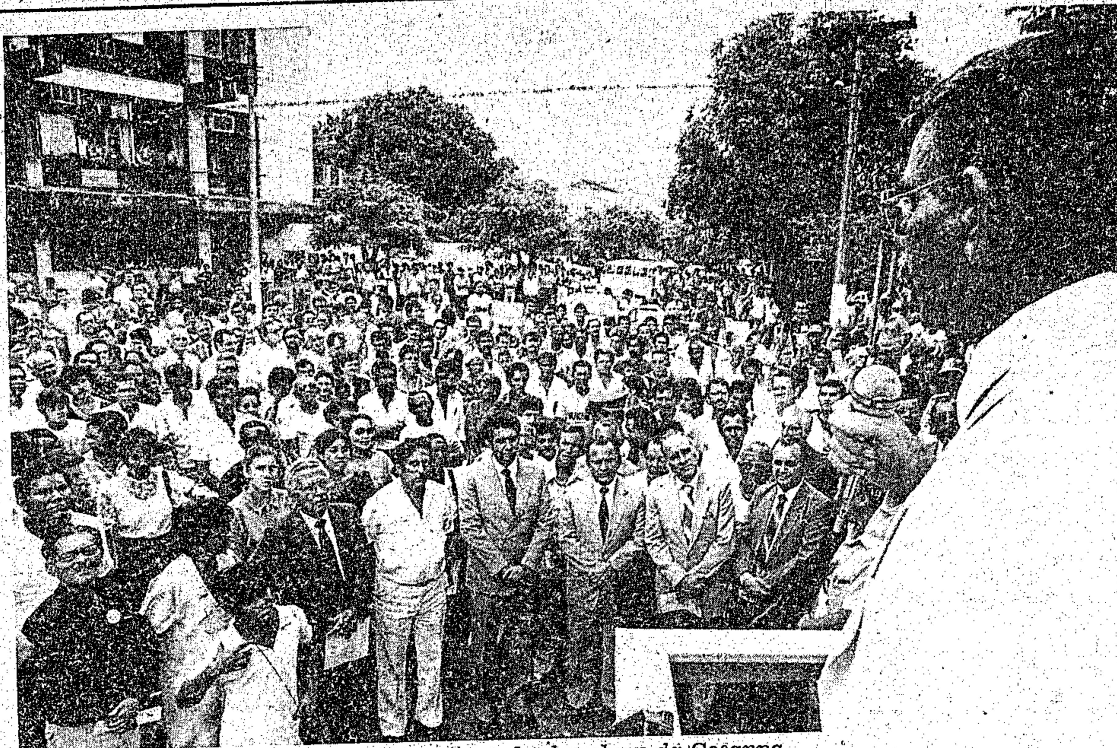
O governador Jader Barbalho na inauguração das obras da Cosanpa