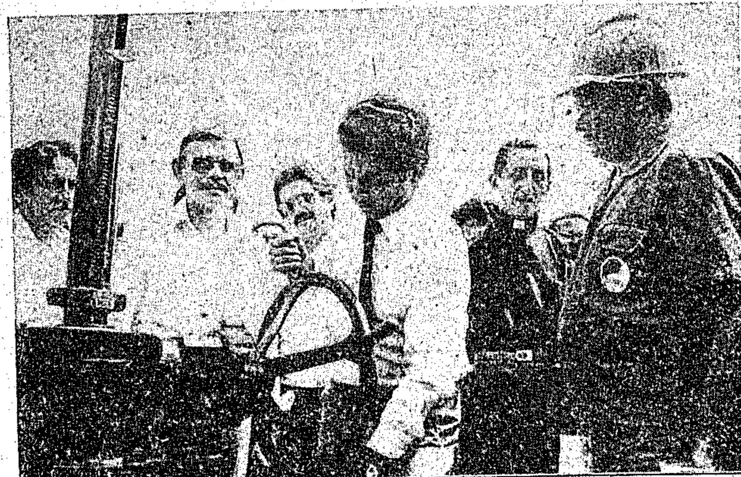
Jader Barbalho inaugura a elevatória

O governador do Estado ouviu explicações técnicas do presidente da Cosanpa, Haroldo Araújo, disse que com essas novas obras a capacidade de armazenamento de água para o abastecimento passará de 10 milhões de metros cúbicos para 12,5 milhões de metros. Ele ressaltou que a água passará a ser fluoretada para reduzir em 60 por cento o índice de cárie dentária em crianças.