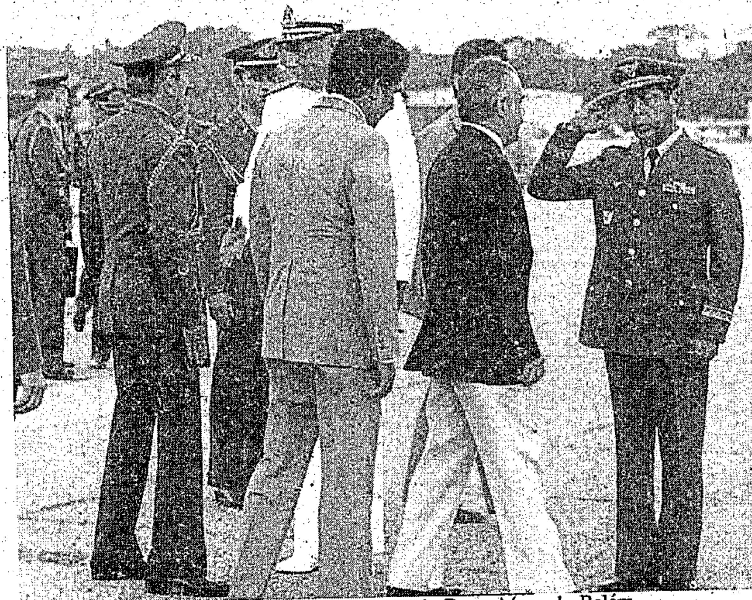
Chegada do presidente Sarney no aeroporto da Base Aérea de Belém