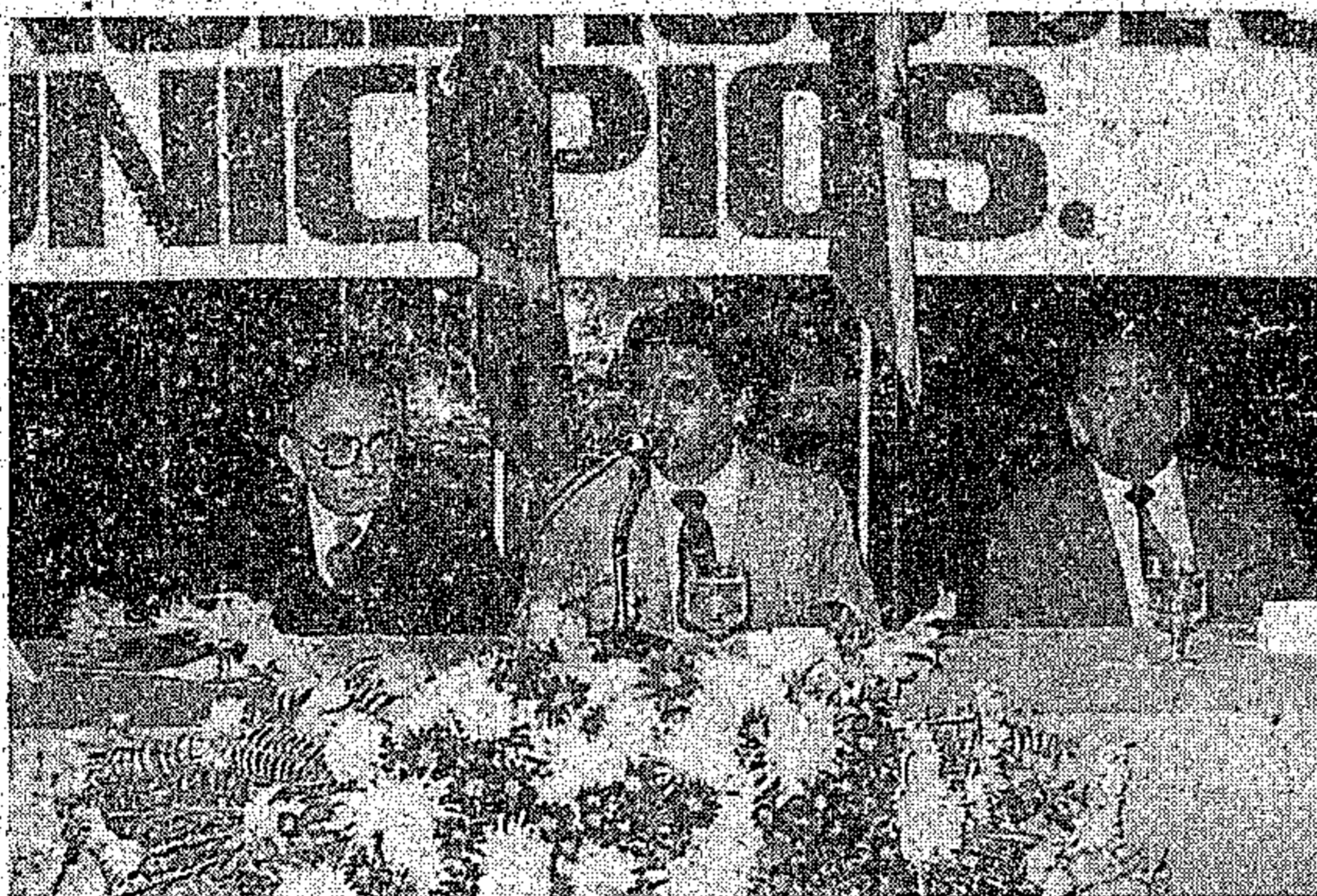
O governador Jader Barbalho presidiu a mesa, na abertura do evento

Ao falar de sua alegria em participar do Encontro e de ter sido eleito seu presidente de honra Jader contou que nas últimas 48 horas tivera a oportunidade de participar de eventos gratificantes