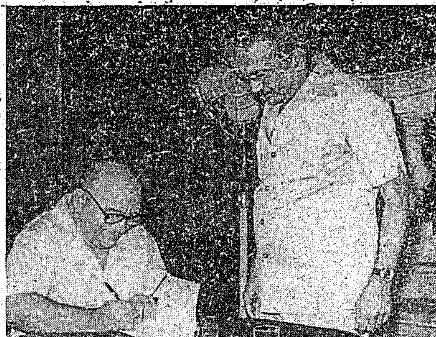
Acyr autografa o 'Proteção Contra a Inocência', no Teatro da Paz

Por outro lado, o titular da SECDet presidiu ontem a abertura do IV Encontro Estadual de Bibliotecas Públicas e Escolares do Pará, evento que se estenderá até hoje, com a realização de palestras e exposições. Tem o apoio do Instituto Nacional do Livro e se realiza no auditório do Serviço Nacional de Aprendizagem Comercial - SENAC