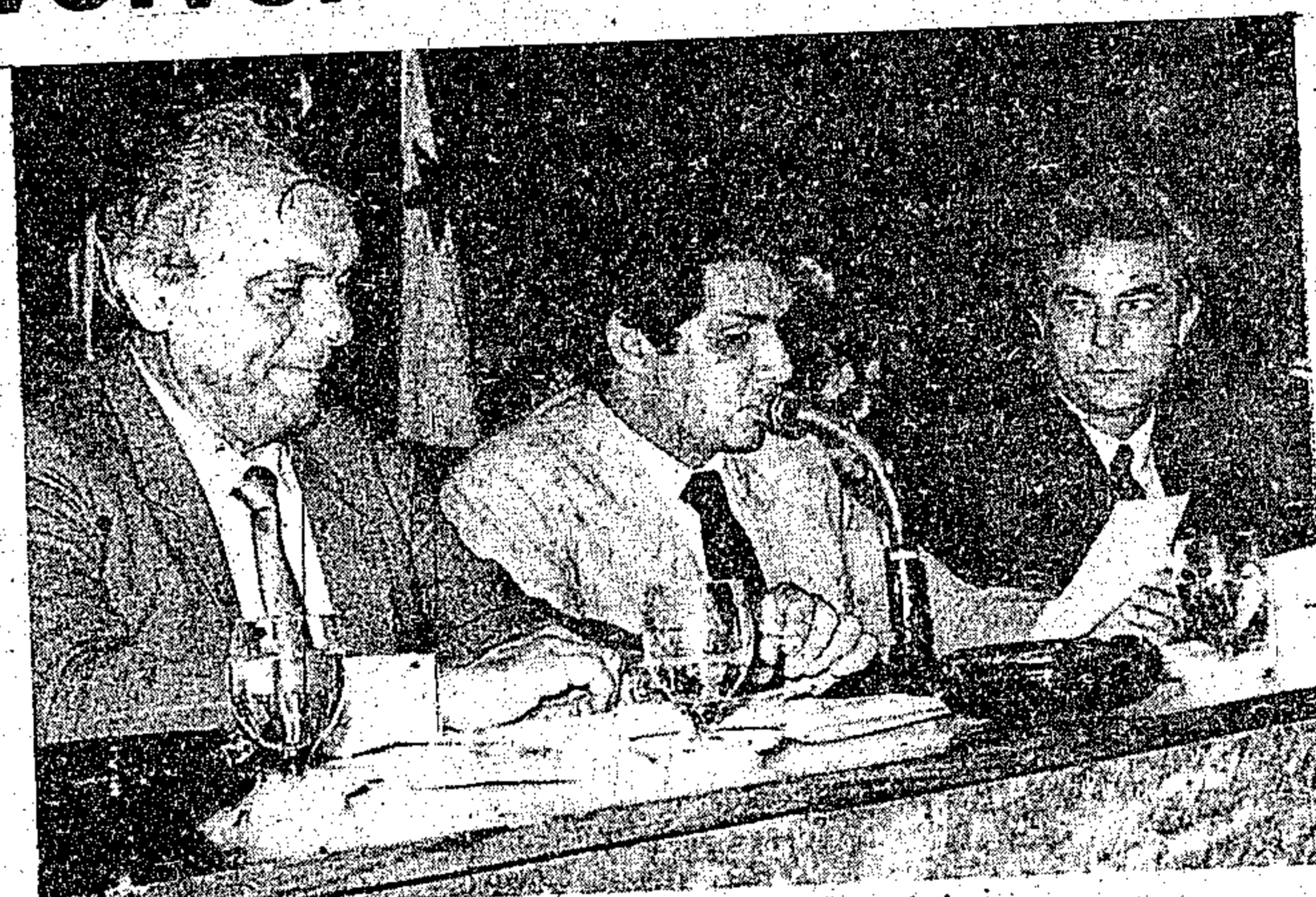
O governador Jader Barbalho no I Encontro da Amazônia

Jader pregou a necessidade de se repensar os rumos do desenvolvimento da Amazônia, cujo processo recente, sem qualquer compromisso com os interesses mais legítimos das populações locais, impuseram-lhes elevados custos sociais. E disse mais: o processo de ocupação recente da região amazônica levou em conta apenas o fornecimento de matérias-primas para regiões mais desen-