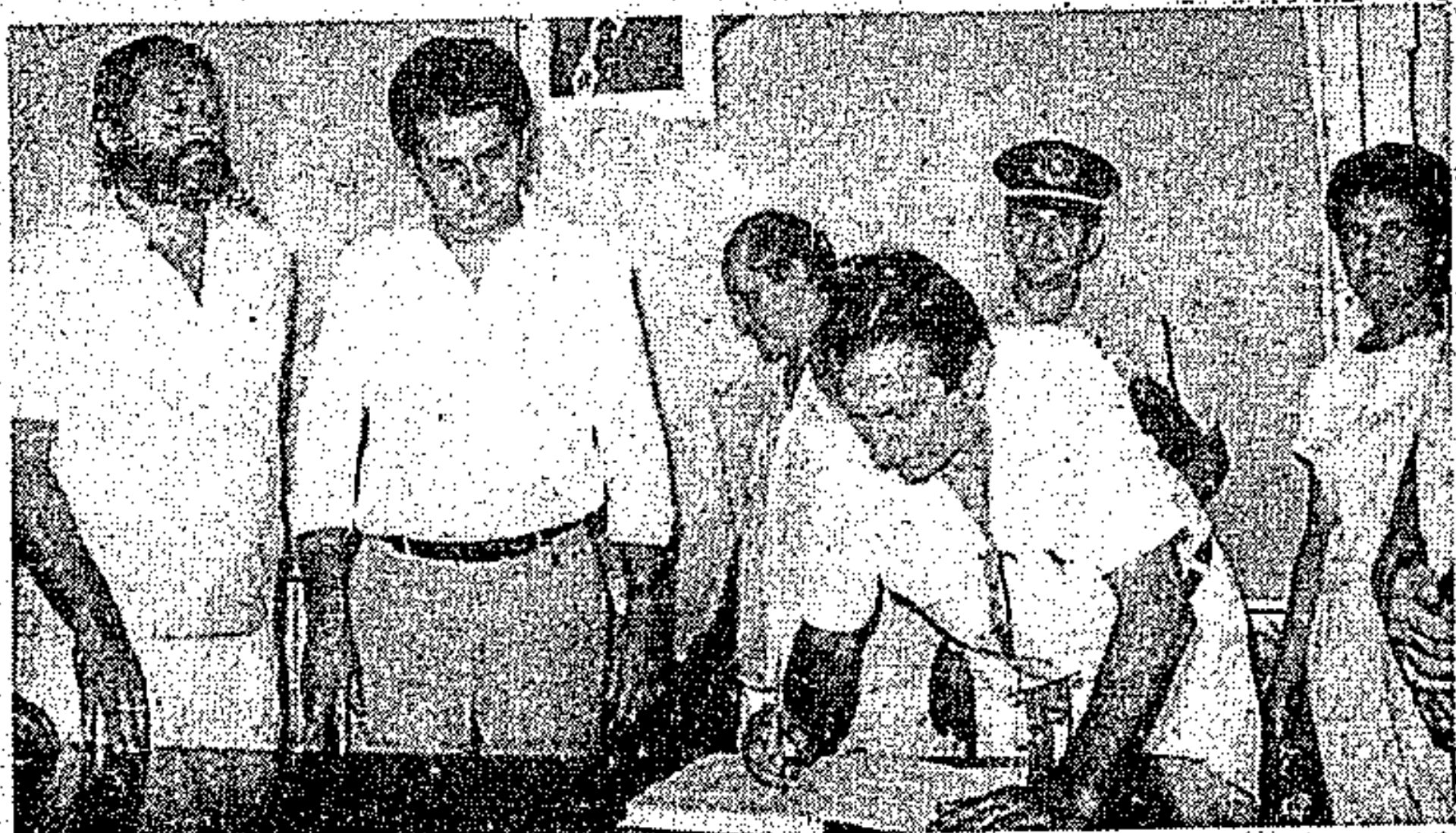
Em Mosqueiro, Jader inaugurou várias obras

Na oportunidade, o Governador Jader Barbalho parabenizou as lideranças comunitárias da Nova Marambaia que ajudaram o Governo do Estado e a Prefeitura de Belém na realização daquela programação.