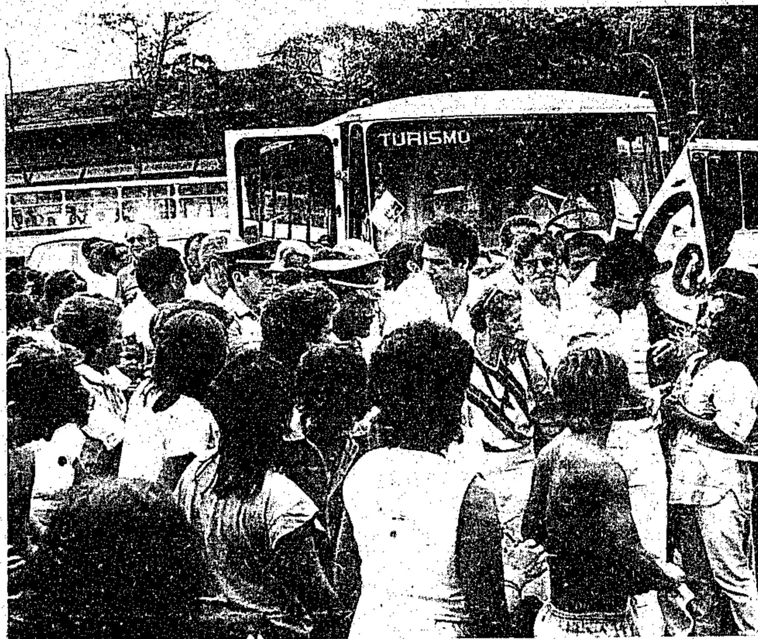
O governador chegou para presidir as inaugurações