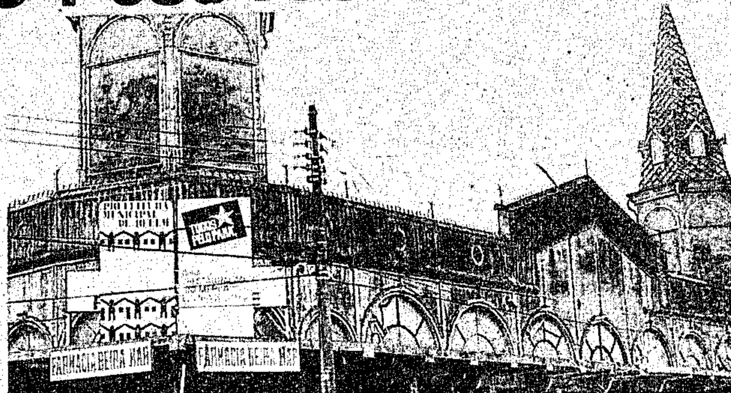
Imagem do velho Ver-O-Peso. Agora todo renovado

Outras obras foram a restauração completa da Feira do Açaí, ao lado do Forte do Castelo; restauração da primeira rua de Belém, que liga a Feira do Açaí até a Praça da Sé; restauração da Praça