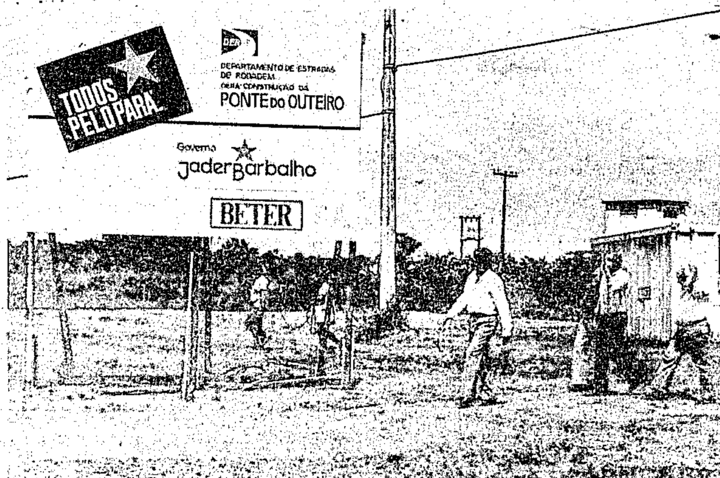
O governador Jader Barbalho percorreu o canteiro de obras

O Governador Jader Barbalho assinou, na última quarta-feira, a ordem de serviço das obras de construção da ponte sobre o Furo do Maguari, para início imediato das obras, com cerimônia sendo realizada em público, no bairro da Agulha, durante visita que fez aquela área de Belém o chefe do Executivo paraense. Desta forma, depois do Mosqueiro, chega a vez da Ilha do Outeiro ser ligada por via terrestre ao continente através de uma ponte.