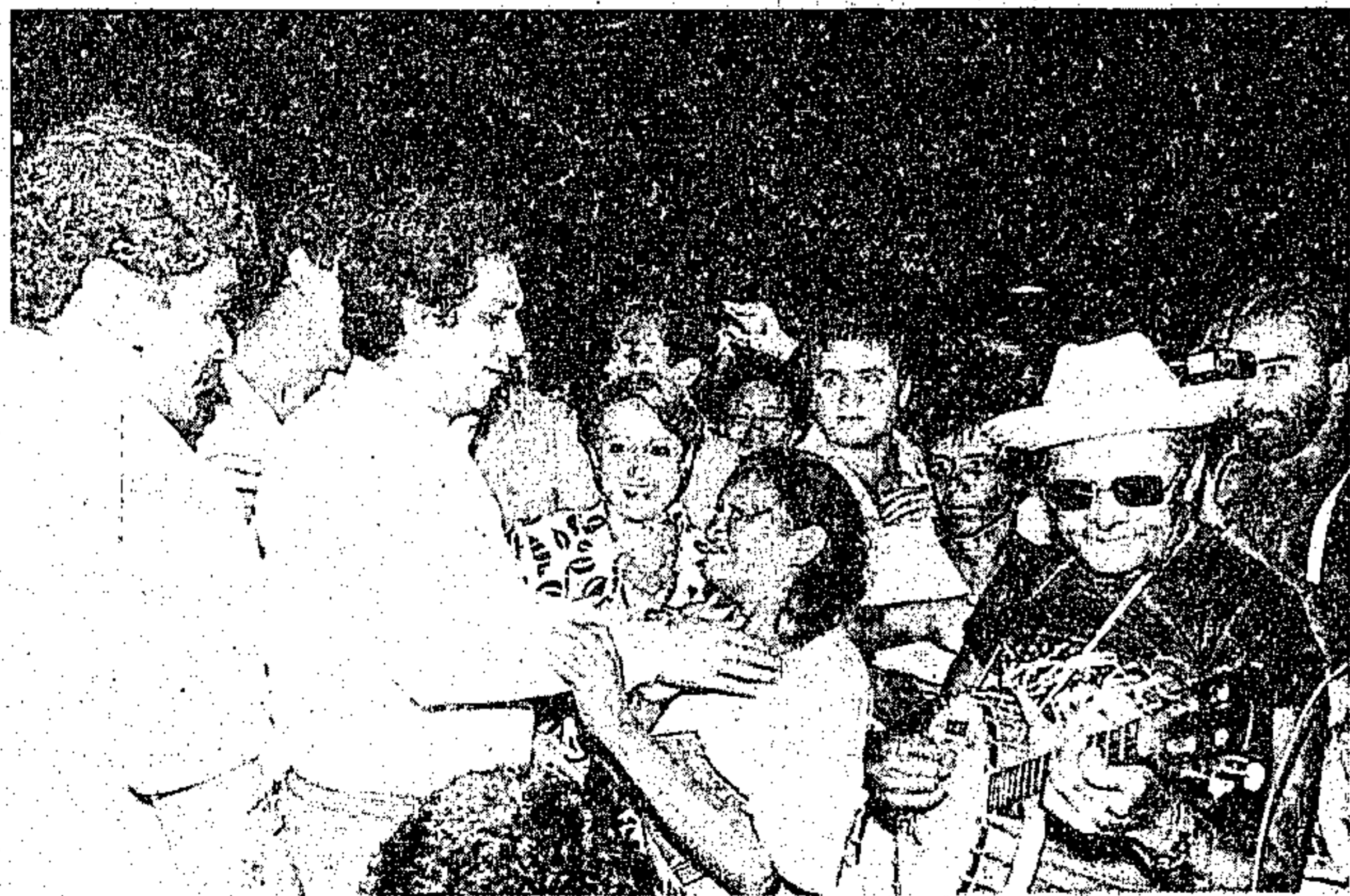
No Ver-O-Peso o governador recebeu o carinho do povo

Logo após uma chuva intermitente que caiu até o início da noite, o Governador Jader Barbalho iniciou por volta das 20:00 horas de quinta-feira passada, a visita a todo o Ver-o-Peso, quando deu por inauguradas as obras de recuperação que ali foram realizadas, o que veio permitir a que o mais autêntico ponto turístico da cidade voltasse às suas origens. As obras de restauração duraram treze meses e consumiram doze bilhões de cruzeiros.