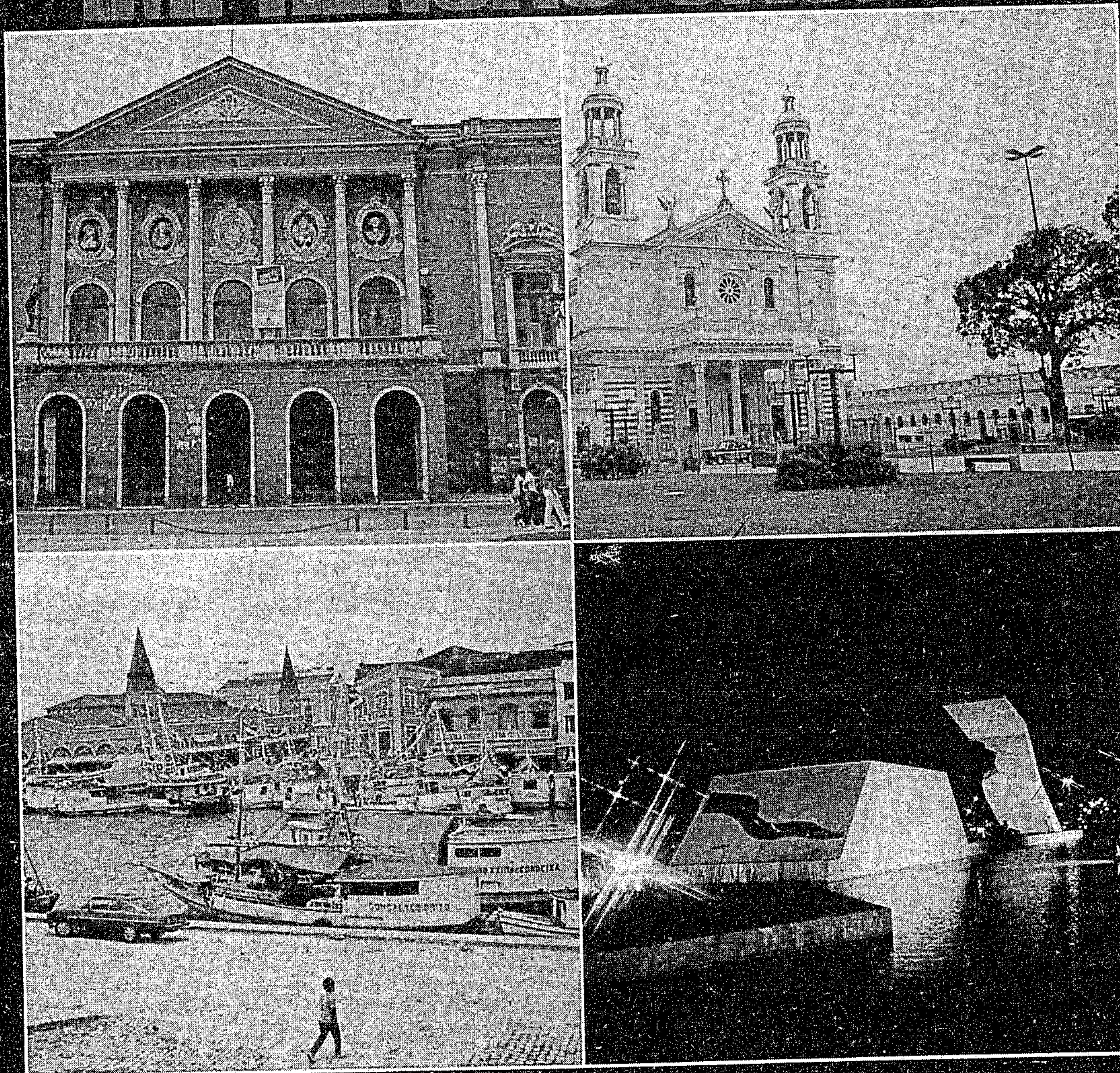
GRUPO FOTOLÓGICO IMPRESSÃO - IMPRENSA OFICIAL DO ESTADO DO PARÁ