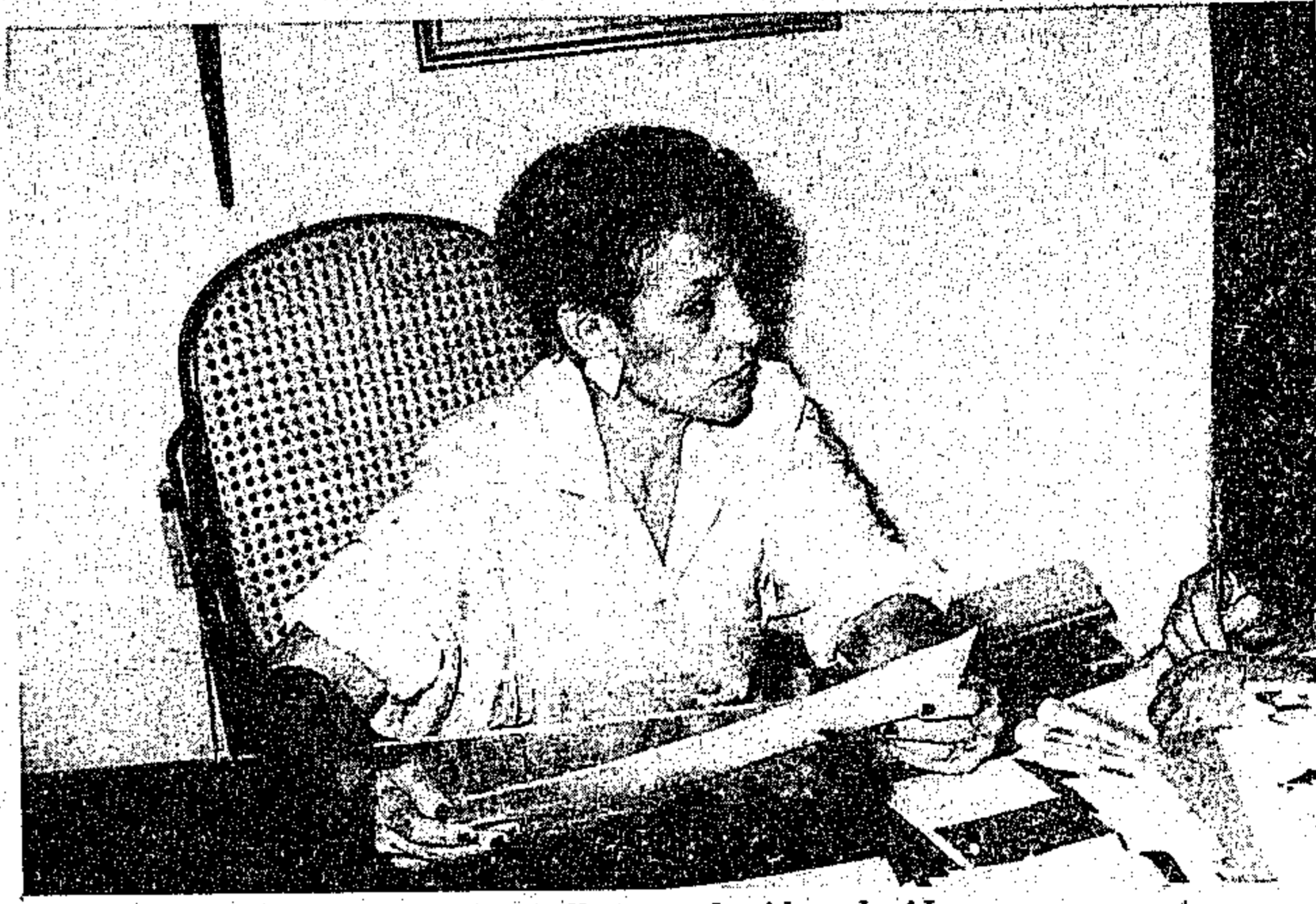
A Primeira Dama teve o seu trabalho reconhecido pela AL