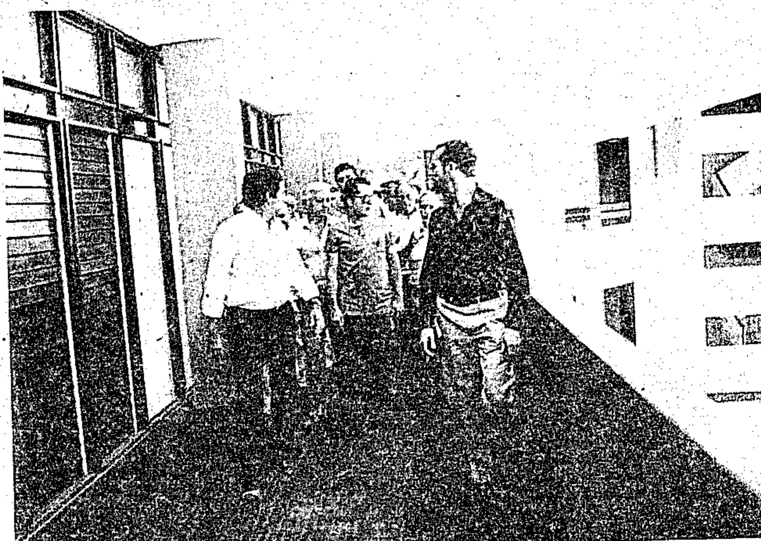
O governador Jader Barbalho quando visitava o Centro Administrativo

Iniciada no Governo Aloysio Chaves, a construção da sede da Seduc foi concluída no início deste ano, graças ao empenho do Governador Jader Barbalho e seu secretariado. A sede está instalada em amplo e moderno prédio na área