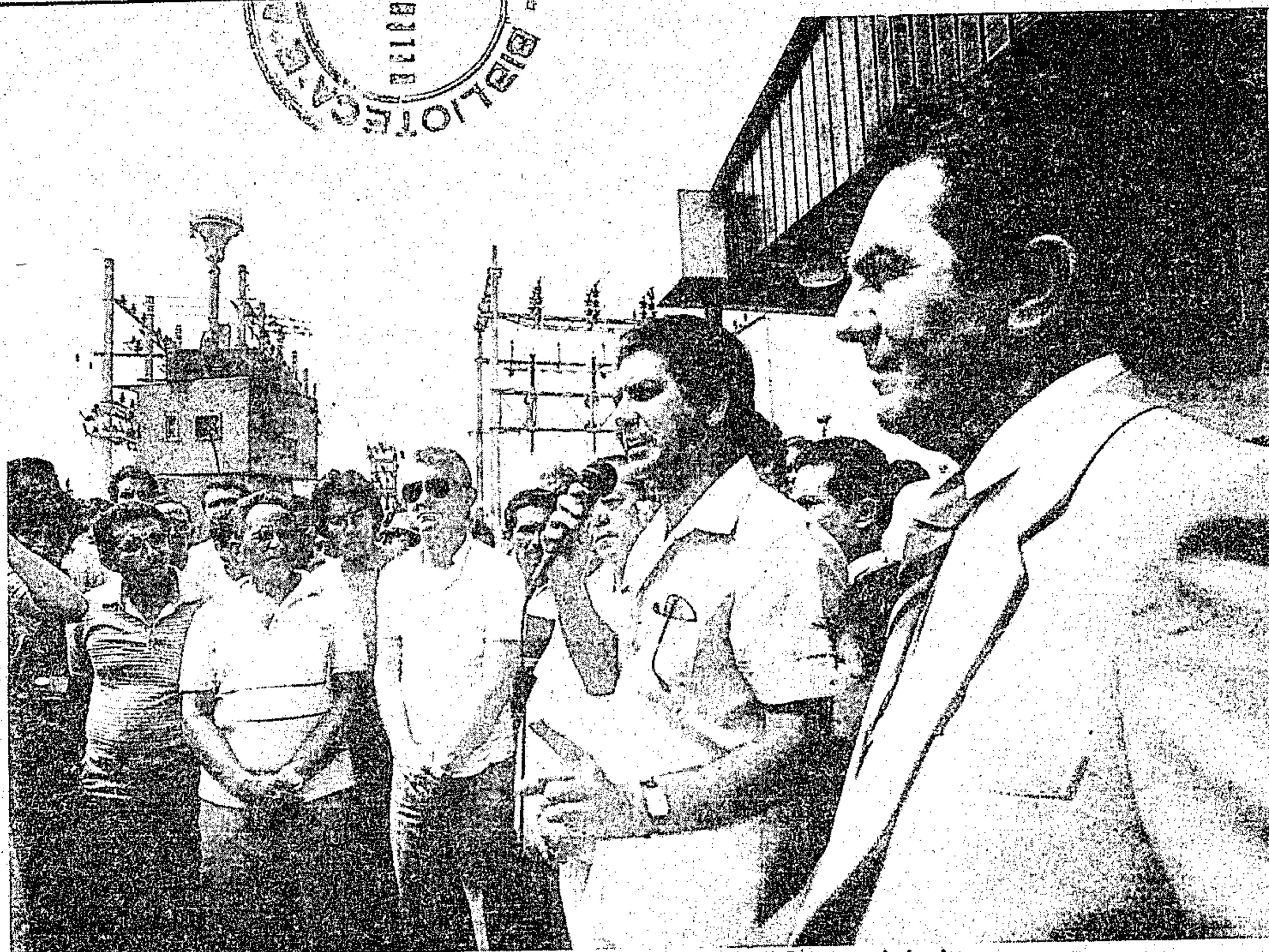
O governador quando inaugurava mais uma subestação da Celpa, no interior

A partir do dia 1º de janeiro do ano vindouro a tabela de preços para publicações no DIÁRIO OFICIAL DO ESTADO passará a ser cobrada à razão de Cr$ 72.670 (Setenta e dois mil, seiscentos e setenta cruzeiros), o centímetro e Cr$ 14.824.680 (Quatorze milhões, oitocentos e vinte e quatro mil e seiscentos e oitenta cruzeiros) a página comum.