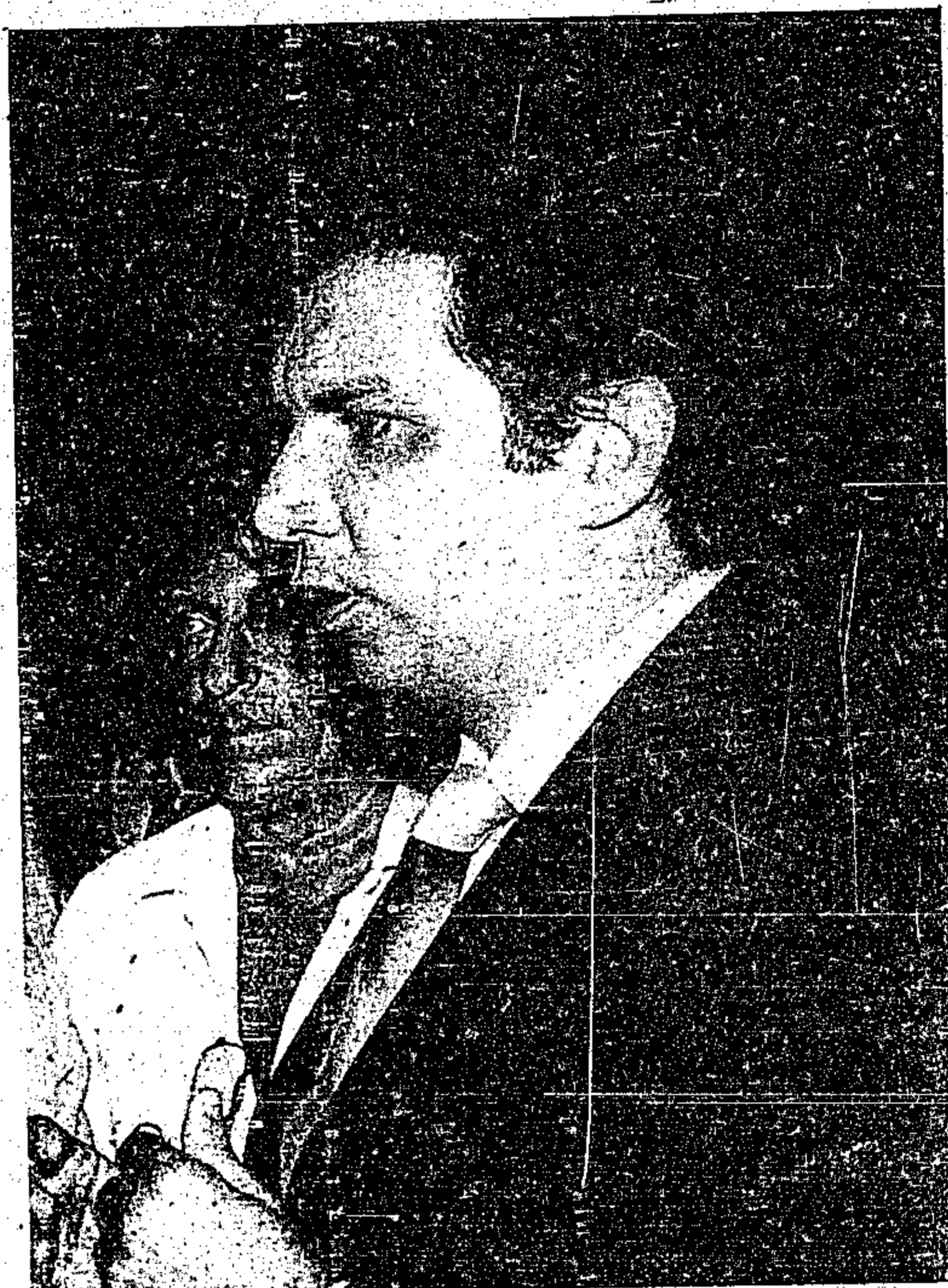
Jader prestigiou os eventos

Em seguida, o Governador Jader Barbalho e comitiva foram para a Rua 16 de Novembro, entre João Dlogo e Avertano Rocha, onde inauguraram a nova sede do DTI que entre os trabalhos de reforma e readaptação custou à Prefeitura cerca de 1 bilhão e 200 milhões de cruzeiros. O DTI nos seus dois andares divididos em Divisão de Planejamento e Apoio, composta das seções de Serviço de Atendimento e Controle e