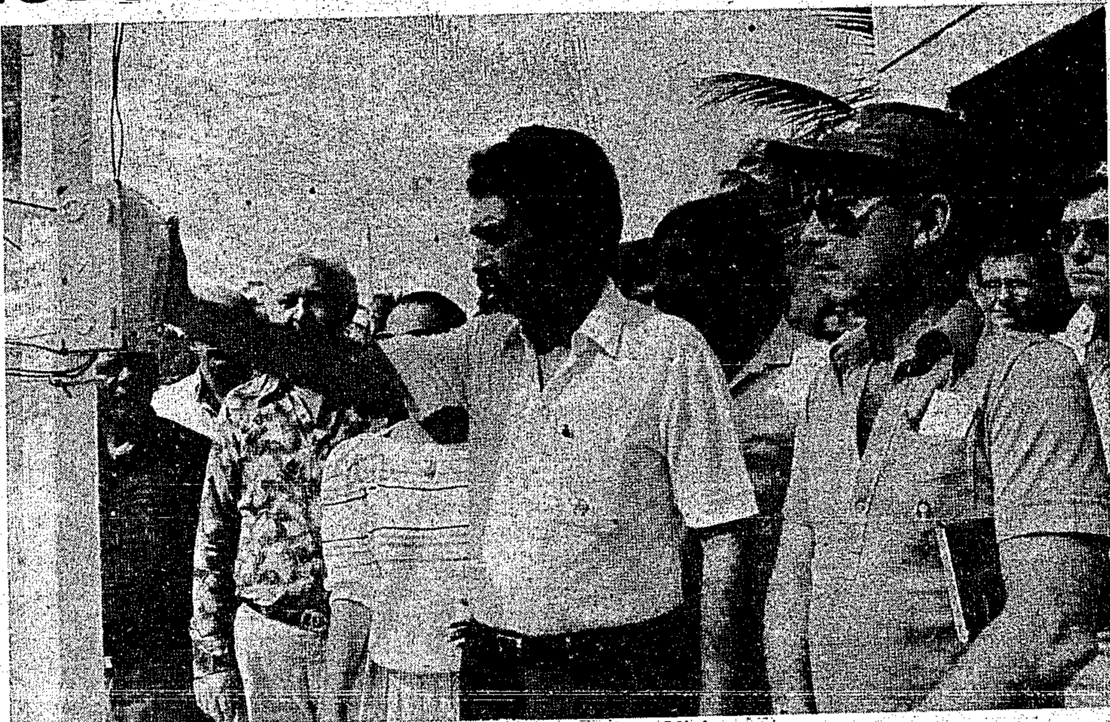
Em Estiva Grande, Ourém, o governador inaugura a luz elétrica

E destacou: — "Em Belém, poucas pessoas darão importância para esta inauguração, porém,