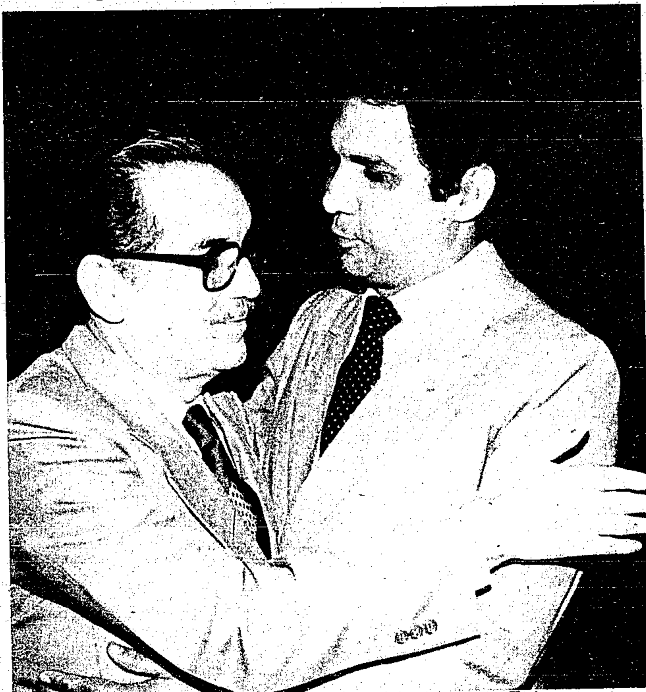
O governador teve encontro em Brasília com o ministro Nelson Ribeiro

Na ocasião do encontro em Brasília, o chefe do Executivo paraense ressaltou que a questão da gleba Cidapar é o pior problema fundiário do Pará, e que está fazendo coro com os colonos no pleito de infra-estrutura para a referida área. Tanto o governador como os colonos querem que o Mirad ajude na construção de mais escolas, postos de saúde, estradas, para servirem a mais de 10 mil famílias que habitam a área. Atualmente, a idéia é empregar recur-