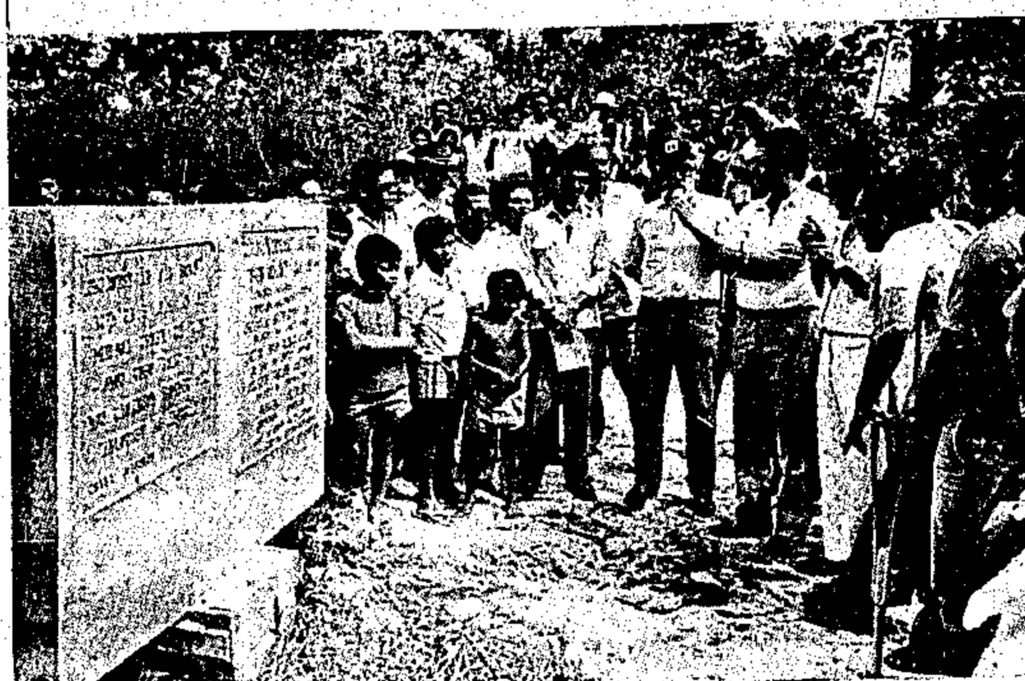
Aqui, o marco zero da rodovia Breves-Anajás