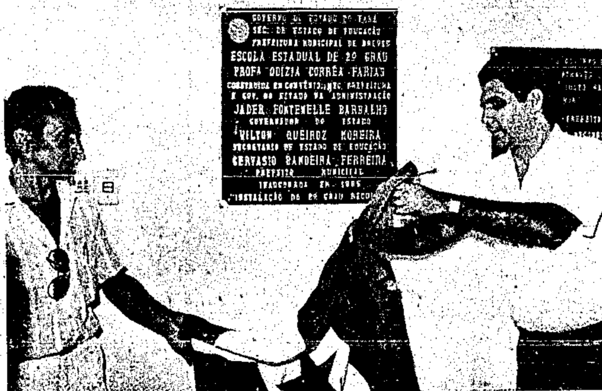
Inauguração da escola de segundo grau

tante que o governador visitou foi a da construção da rodovia PA-159, que liga Breves a Anajás, numa extensão de 110 Km, cujos 30 primeiros já estão abertos, como também já estão concluídos os estudos topográficos. Para tanto, o DER aplicou 200 milhões de cruzeiros, com o pico atingindo as cercanias de Anajás. A estrada, além de facilitar as comunicações entre os dois municípios, tem também um objetivo essencialmente econômico, de vez que ao longo de seu curso instala-se uma colônia agrícola, estando o Iterpa empenhado na doação de 200 lotes de terras aos pequenos produtores da região.