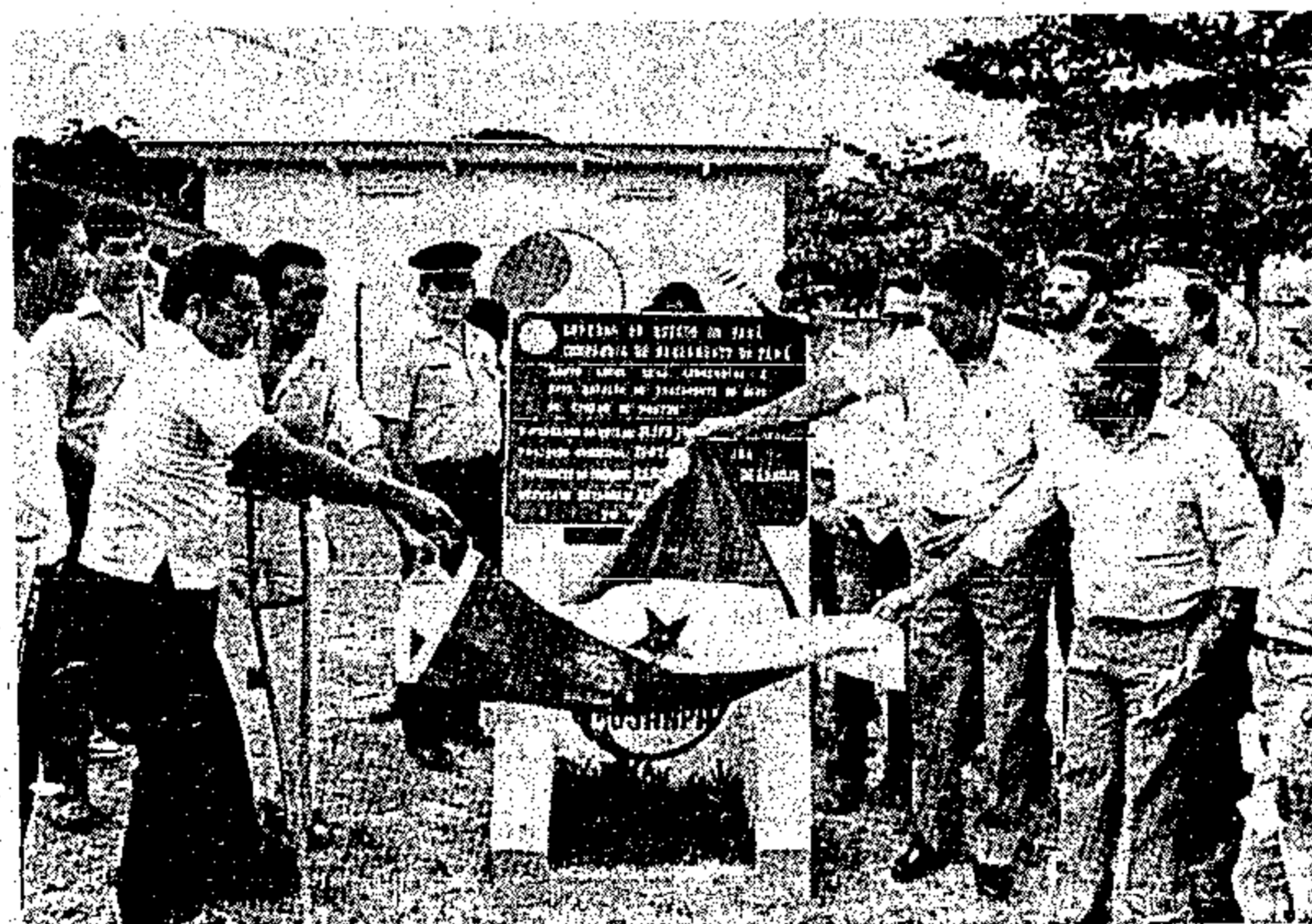
Primeira etapa do abastecimento de água